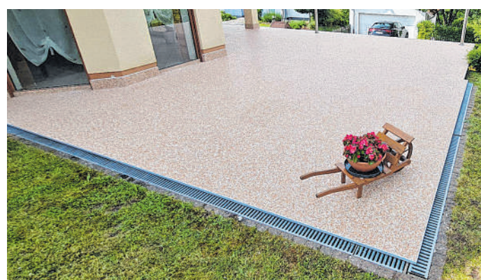
Hochwertiges Sanierungssystem: Interessierte werden von Fachleuten des Unternehmens happySystem professionell beraten.

Obwohl es viele verschiedene Balkonsanierungssysteme auf dem Markt gibt, sind nicht alle gleichermaßen geeignet. Oft werden lediglich die sichtbaren Schäden behandelt, ohne die eigentliche Ursache anzugehen. Es werden beispielsweise defekte Fliesen einfach ausgetauscht und der Anstrich an der Unterseite ausgebessert, während die eigentliche Problematik einer