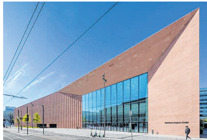
Das Heidelberg Congress Center: Die wellenförmig gestaltete Außenfassade aus regionalem Sandstein erinnert an einen Bühnenvorhang.