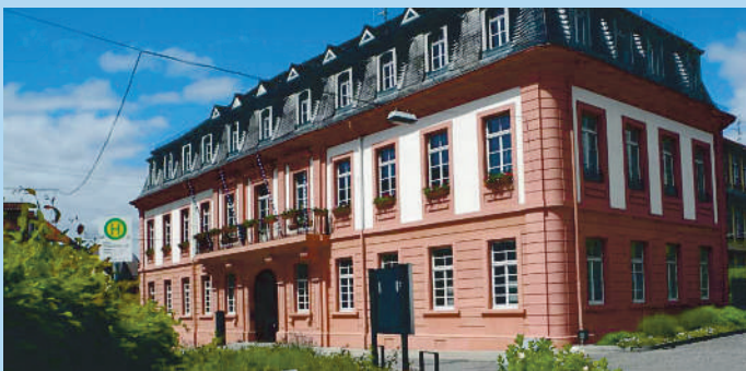
Historisches Rathaus: Leimen wurde erstmals im Jahre 791 im berühmten Lorscher Codex urkundlich erwähnt.

Nur wenige Kilometer von Heidelberg und Mannheim entfernt liegt Leimen im Herzen der Kurpfalz. Der alte Marktflecken wurde bereits 791 n. Chr. urkundlich erwähnt. Das vielfältige kulturelle Leben mit über 180 Vereinen spiegelt die gesellige kurpfälzische Lebensart wider. Das traditionelle Frühlingsfest und die Weinkerwe locken jedes Jahr unzählige Besucher an. Leimen hat eine mehr als 1200jährige Weinbau-Tradition, heute gibt es zwei als Familienbetriebe geführte Weingüter am Ort. In der Vergangenheit hat man hauptsächlich in den Klöstern den Wein durch Jahrhunderte hindurch veredelt und neue Sorten gezüchtet. Heute werden in Leimen die Sorten Müller-Thurgau, Riesling, Ruländer, Weißburgunder, Grauburgunder sowie Portugieser und Spätburgunder angebaut. Die Weine haben sehr gute Qualitäten und erhalten höchste Auszeichnungen. Mit seinen zahlreichen Sportanlagen und ausgedehnten Waldgebieten am Rande der Rheinebene bietet Leimen einen hohen Freizeitwert.