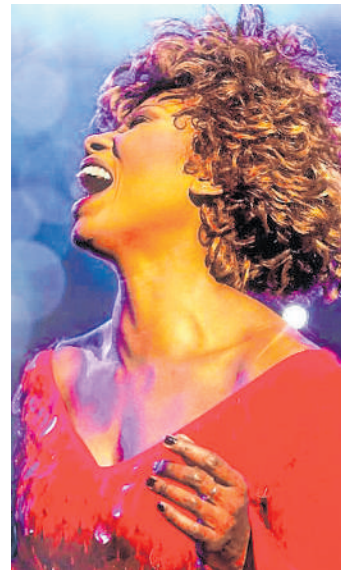
„Queen of Rock“: „Simply The Best – Die Tina Turner Story“ gastiert am 30. April im Mannheimer Rosengarten.

Die Erfolgs-Produktion „Simply The Best“ ist eine Hommage an die Rock-Ikone, die ein halbes Jahrhundert Rock-Geschichte ge-