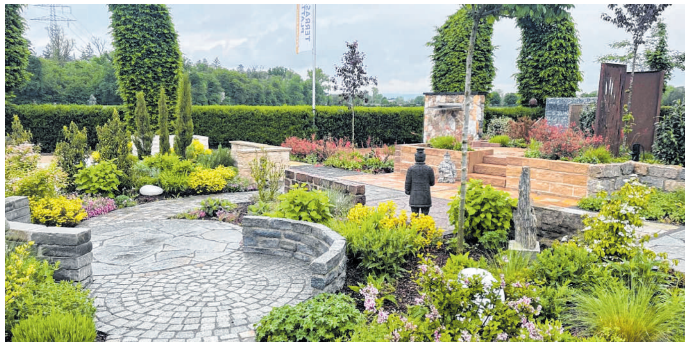
Besonderes Ambiente: Das umfassende Sortiment kann man sich in der großzügig angelegten Ausstellung anschauen.

Björn Stanek: Beim Wunsch nach Verschönerung des Lebensbereichs „Garten“ musste ich feststellen, dass es eine sehr begrenzte Auswahl an qualitativ