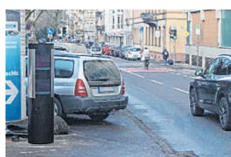
Altstadt: Auf Höhe des Hölderlin-Gymnasiums wurde eine neue Geschwindigkeitsmessanlage installiert.

Die neue Technik kommt ohne aufwendige Induktionsschleifen im Asphalt aus, die zwar sehr zuverlässig arbeiten, durch die ständigen Temperaturwechsel, die mechanische