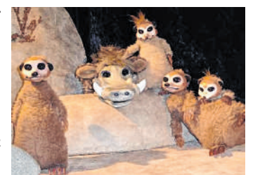
Raus aus dem Bau: Die Erdmännchenkinder Aki und Suki erkunden die Welt – doch überall lauern Gefahren.

Ein weiteres Abenteuer im Leben der Erdmännchenkinder Aki und Suki und deren „Bruder“ Kuno: Die Eltern sind früh