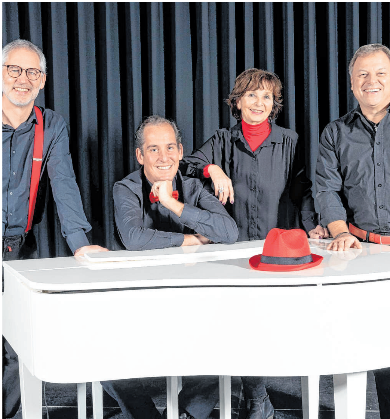
Kabaretttruppe aus Weinheim: Die Spitzklicker wirft ihren sprichwörtlichen Hut im April in den Ring der Festhalle.

Telefon: 0621/ 392 2802 E-Mail: kschwindt@ haas-publishing.de