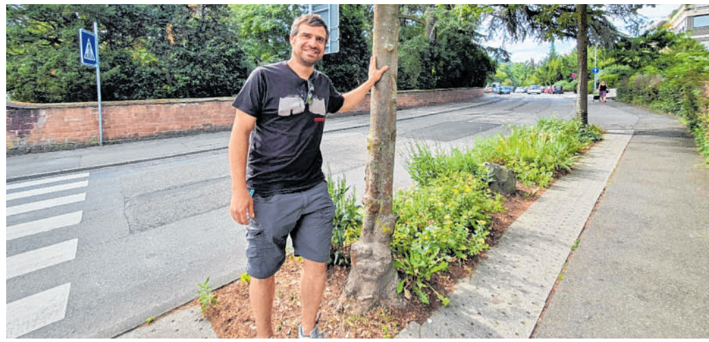
Grünflächenabteilung: Die Baumpatenschaft bedeutet in erster Linie das Gießen des Baumes und das Befreien der Baumscheibe von Unrat.