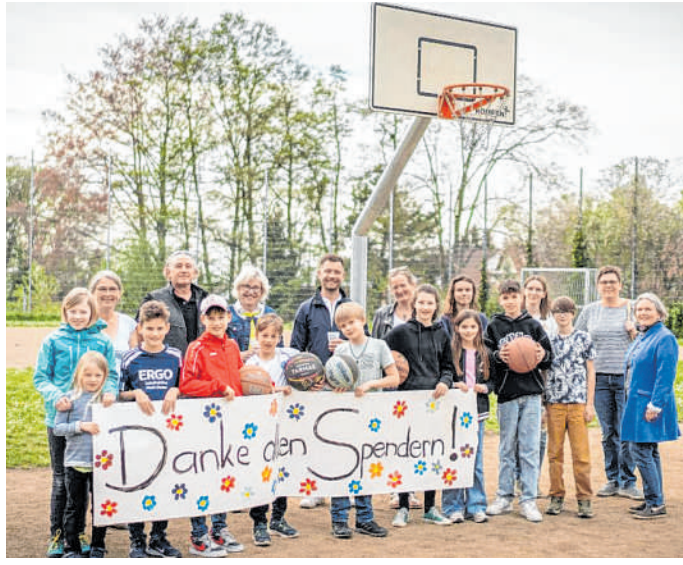
Einweihung: Dank der Stadt Weinheim und der Ortsvorsteherin konnte der Wunsch nach einem Basketballkorb schnell umgesetzt werden.