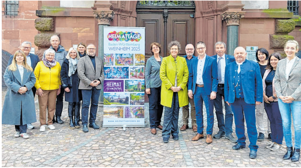
Landesausschuss Heimattage und Lenkungsausschuss tagten in Weinheim: Bereits jetzt schon sorgen die Heimattage im ganzen Land für großes Aufsehen.