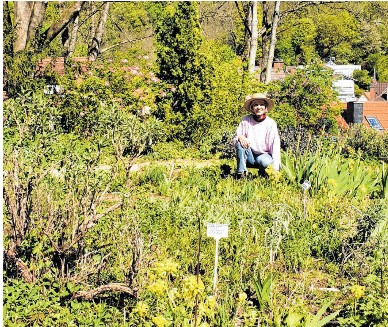
Führung für Groß und Klein: Im Weinheimer Schlosspark befindet sich der Heilpflanzengarten.

Telefon: 0621/ 392 2814 E-Mail: crink@haas-publishing.de