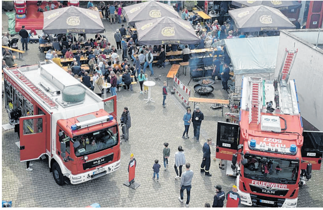
Albert-Schweitzer-Straße in Sulzbach: Schon im vergangenen Jahr war die Veranstaltung der Freiwilligen Feuerwehr Weinheim Abteilung Sulzbach gut besucht.