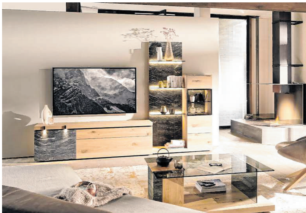
Alpines Holz und Granit in Harmonie: Natürliche Materialien verleihen dem Zuhause ein besonderes Flair.

Bei der Einrichtung des Zuhauses achten viele bewusst auf die Qualität der Materialien. So weist etwa Massivholz keine bedenklichen Emissionen auf, sondern fördert ein gesundes Raumklima – vorausgesetzt, es stammt aus nachhaltigem Anbau. Eine verwendete Wildziege beispielsweise wird handverlesen, genau kontrolliert und nach traditionellen, handwerklichen Methoden verarbeitet.