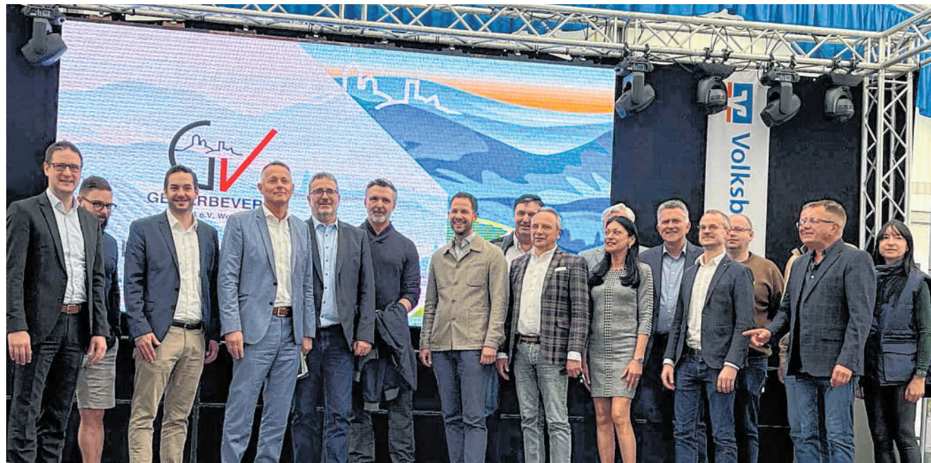
Große und kleine Besucher kommen voll auf ihre Kosten: Die Weinheimer Woche vom 19. bis 21. April lockt auch in diesem Jahr mit einem faszinierenden Rahmenprogramm.