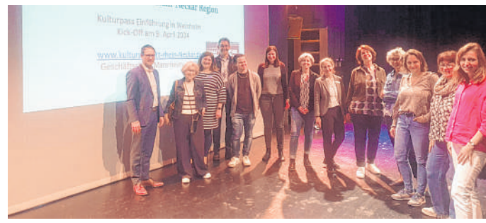
Kulturparkett baut Brücken ins Kulturleben: Seit einigen Tagen kommen auch bedürftige Personen aus Weinheim in den Genuss von vielen Veranstaltungen, die kostenlos sind.

So geht's: Menschen, die bedürftig sind entsprechend berechtigt, Sozialleistungen zu