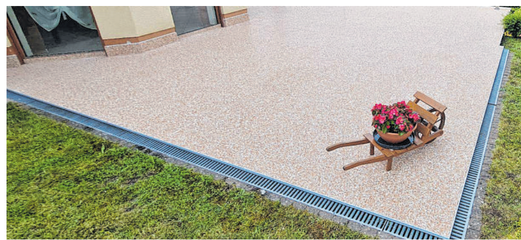
Hochwertiges Sanierungssystem: Interessierte werden von Fachleuten der Firma happySystem professionell beraten.

Obwohl es viele verschiedene Balkonsanierungssysteme auf dem Markt gibt, sind nicht alle gleichermaßen geeignet. Oft werden lediglich die sichtbaren Schäden behandelt, ohne die eigentliche Ursache anzugehen. Es werden beispielsweise defekte Fliesen einfach ausgetauscht und der Anstrich an der Unterseite ausgebessert, während die eigentliche Problematik einer