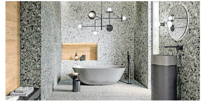
Ästhetik und Komfort: Fliesen im Natursteinlook sind zeitlos und sparen viel Arbeit.

Neben der Optik kommt es bei Wohnmöbeln naturgemäß stets auf den Einklang von Form und Funktion an. Verschiedene Hersteller verbinden deshalb ein innovatives Design mit ausgeklügelten Details. So scheinen die Korpusse der Schrankmöbel, aufgrund der filigranen Metallprofile buchstäblich zu schweben. Der Esstisch lässt sich mit einem Einhand-Beschlag einfach und komfortabel verlängern, das Tischgestell bleibt dabei fix auf der Standposition. Regale mit integriertem Licht, die in die Leisten eingehängt werden, bringen den Alpengranit zum Leuchten. Der Couchtisch wiederum befindet sich auf Rollen und lässt sich somit mühelos verschieben. Im Internet gibt es mehr Inspirationen für einen alpinen Einrichtungsstil. Auf moderne Weise neu interpretiert, erleben Naturmaterialien somit ein bemerkenswertes Comeback und punkten neben Aspekten der Wohnqualität insbesondere mit ihrer Individualität. djd