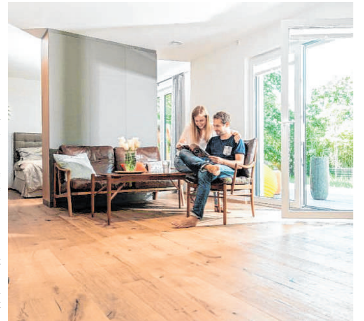
Gleicher Boden in einer komplett neuen Optik: Erfahrene Parkettprofis können alle Echtholz-Beläge aufbereiten und vielseitig gestalten.

ihres Holzfußbodens auf einen komplett neuen Look setzen wollen, haben viele Möglichkeiten: Beispielsweise können Parkettprofis durch eine spezielle Bürstechnik die einzigartige Struktur und den Charakter eines Parkettfußbodens im Handumdrehen neu herausarbeiten. Wer farbliche Akzente auf seinem Boden setzen möchte, hat ebenfalls eine große Auswahl: Auffellen mit grellen knalligen Farben wie Rot oder Gelb ist ebenso möglich wie das Abdunkeln mit ruhigen dunklen Tönen. Parkettprofis vor Ort beraten dazu gerne.