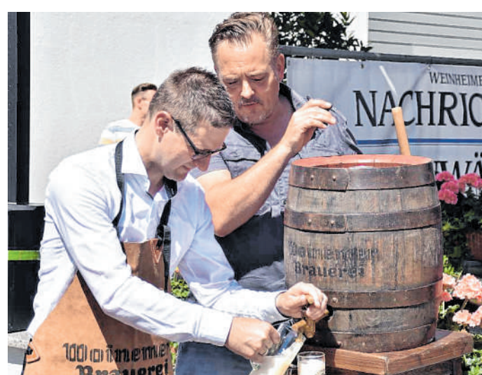
Fassanstich: Weinheims Oberbürgermeister wird das vierte Nordstadtfest eröffnen.

Anmeldungen zum Flohmarkt werden unter der Telefonnummer 06201/172 25 oder per E-Mail unter conny.boris@arcor.de entgegen genommen. Hier gibt es auch mehr Infos zum dem Fest.