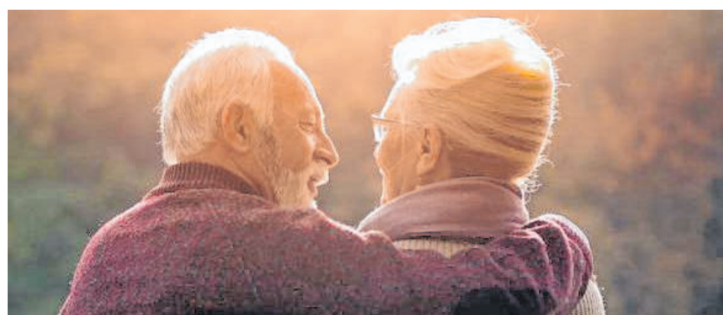
Das klassische Erdgrab auf dem Friedhof wird nur noch von wenigen gewünscht: Immer mehr Menschen entscheiden sich selbstbewusst bereits zu Lebzeiten für alternative Bestattungsformen.

nen zu einem Rohdiamanten gepresst und auf Wunsch geschliffen, die restliche Asche kann in der Urne beigesetzt werden. Inzwischen ist die Asche aber nicht mehr die einzige Kohlenstoffquelle, die für die Herstellung eines Erinnerungsdiamanten genutzt werden kann. Die Alternative sind Erinnerungsdiamanten aus Haaren. Auf sie kann man zurückgreifen, wenn Erinnerungsobjekte aus Kremationsasche aus sozialen, rechtlichen oder familiären Gründen nicht möglich oder erwünscht sind. Wenn man sich für einen Erinnerungsdiamanten aus Haaren entscheidet, wird die Asche in den meisten Fällen in einer Urne beigesetzt. Wer an einem Erinnerungsdiamanten aus Asche oder Haaren interessiert ist, wendet sich in Deutschland an ein Bestattungsunternehmen seiner Wahl. Für die Produktion eines oder mehrerer Erinnerungsdiamanten werden nur fünf bis zehn Gramm Haar benötigt. In einem ersten Schritt wird Kohlenstoff isoliert, gereinigt und aufgearbeitet. Im Anschluss wächst dieser unter hohem Druck und hoher Temperatur zu einem Erinnerungsdiamanten heran. Ein Rohdiamant kann mit einer Lasersgravierung versehen werden. djd