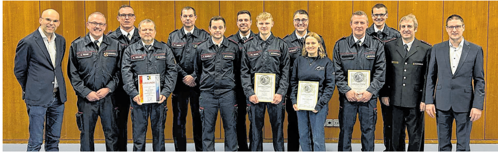
Neuwahlen: Geehrte und Beförderte bei der Jahreshauptversammlung in Rippenweier: