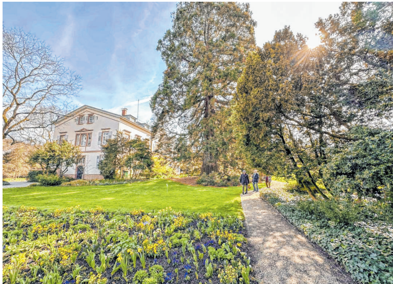
Besonders prachtvoll: Die wertvollen alten Bäume im Weinheimer Schau- und Sichtungsgarten Hermannshof sind nach einer Sonderbehandlung gut gerüstet.