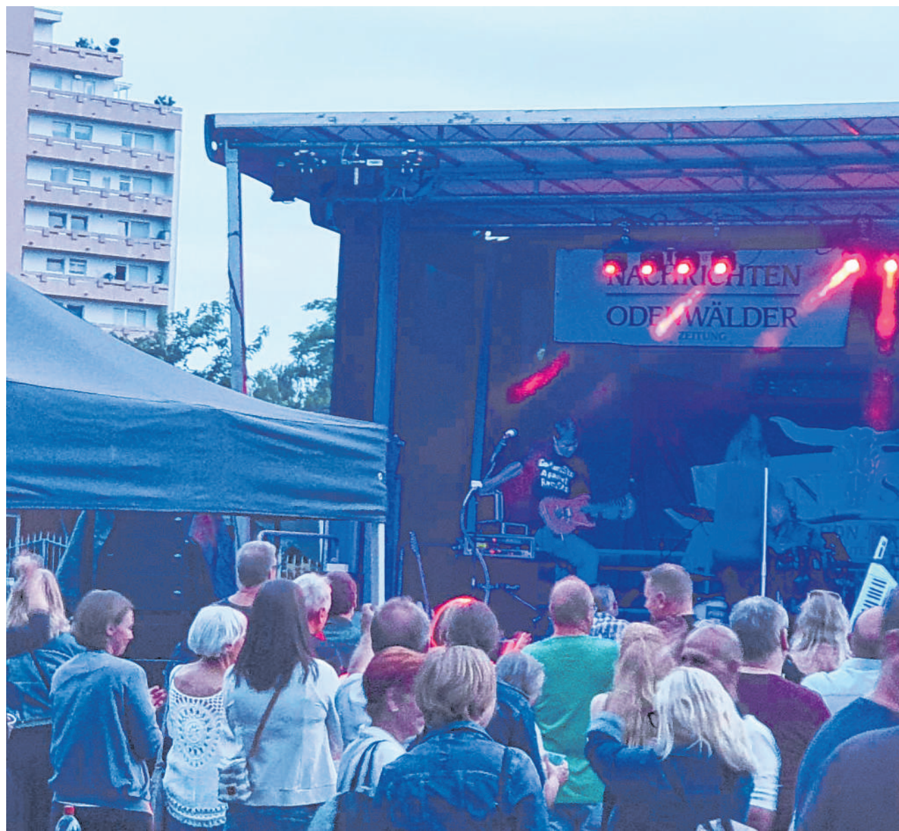
Zwei Bühnen mit Profi-Technik: Anmeldungen für Stände und Flohmarkt jetzt möglich.

Telefon: 0621/ 392 2814 E-Mail: crink@ haas-publishing.de