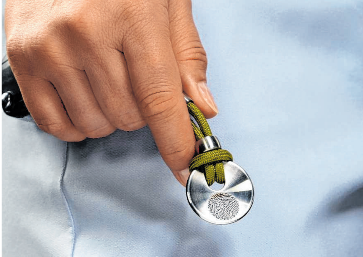
Alltagsbegleiter, die an geliebte Verstorbene erinnern: Auf Schlüsselanhängern kann ein Fingerabdruck per Laser aufgetragen werden.