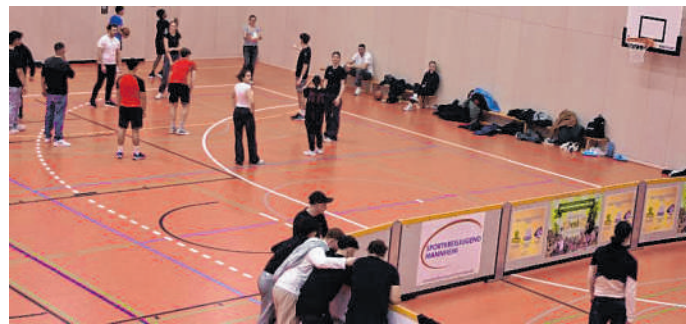
Über 100 Jugendliche strömten nach Weinheim: Gewohnt interessantes Angebot trotz des neuen Ortes.