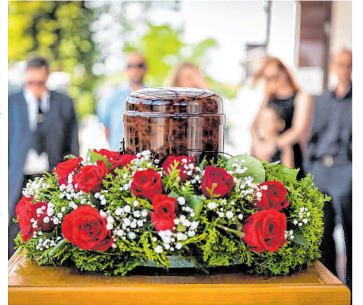
Alleine die Beerdigungskosten liegen in Deutschland schnell bei 6000 bis 8000 Euro: Mit Grabpflege und Friedhofsgebühren kommen weitere Ausgaben auf die Familie zu. Mit einer Bestattungsvorsorge kann man seine Hinterbliebenen finanziell entlasten.

Der Tod eines geliebten Menschen ist für die Angehörigen eine extreme Herausforderung. Eine Zeit, die mit vielen Fragen und Organisationsaufwand verbunden ist. Gerade in den ersten Tagen kann das zu einer großen Belastung werden. Gut, wenn sich die Angehörigen dank einer Bestattungsvorsorge dann keine Gedanken über die Bestattungsleistungen und deren Kosten machen müssen. Diese liegen in Deutschland aktuell durchschnittlich zwischen 6000 und 8000 Euro. Sie sind in der Regel durch die Hinterbliebenen zu tragen. Bestattungsvorsorge kann daher eine sinnvolle und verantwortungsbewusste Entscheidung sein.