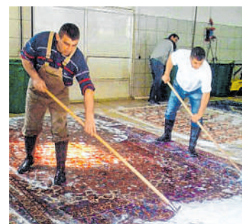
Reinigung: Der Waschvorgang geschieht in mehreren Stufen.

Mona Tex, Darmstädter Straße 2, 64646 Heppenheim, Tel.: 06252/689913, E-Mail: info@monatex.de, Homepage: www.monatex.de