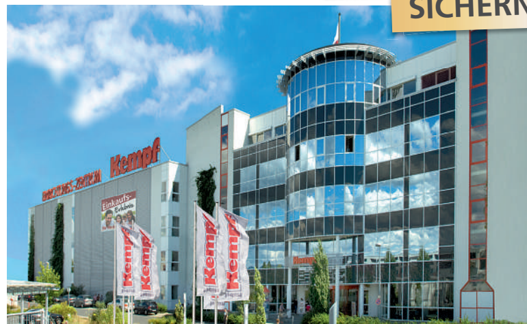
1999 Baubeginn Möbel Kempf in Aschaffenburg. 150 neue Mitarbeiter, 30.000 m² Verkaufsfläche. Neueröffnung nach Rekordbauzeit am 27. Juli 2000

indem wir viele verschiedene, spannende Arbeitsplätze mit Aufstiegsmöglichkeiten bieten. Das Ausbildungsangebot von Möbel Kempf und Mobile Wohnspass umfasst dreizehn Berufe und ein duales Studium an vier möglichen Standorten. Auch der relativ neue Ausbildungsberuf zum Kaufmann oder zur Kauffrau im E-Commerce ist dabei. Wir fördern individuelle Ta-