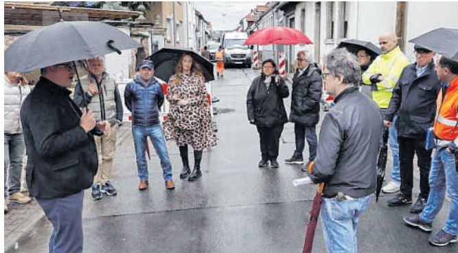
Vor-Ort-Termin: Die Anwohner und Eigentümer werden für die voraussichtlich acht Monate andauernden Arbeiten in zwei Abschnitten um Verständnis gebeten.