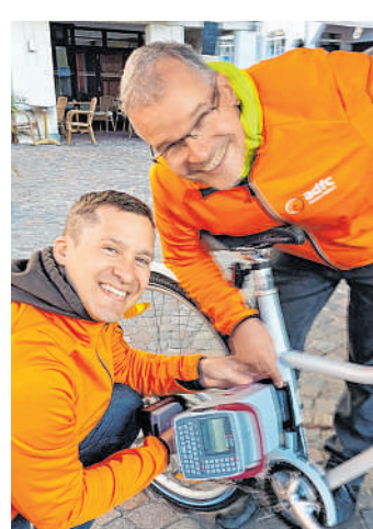
Vor Ort: Die Prägung erfolgt im oberen Drittel des Sattelrohrs, auf der rechten Seite.

Wiesloch/Walldorf. Aufgrund der hohen Nachfrage auch aus Walldorf bei der Fahrradcodierung in Wiesloch führt die ADFC Ortsgruppe Wiesloch/Walldorf eine Fahrrad-Codierungsaktion am Samstag, 20. April, zwischen 10 und 13 Uhr auf dem Marktplatz in der Hauptstraße in Walldorf Nähe katholische Kirche durch.