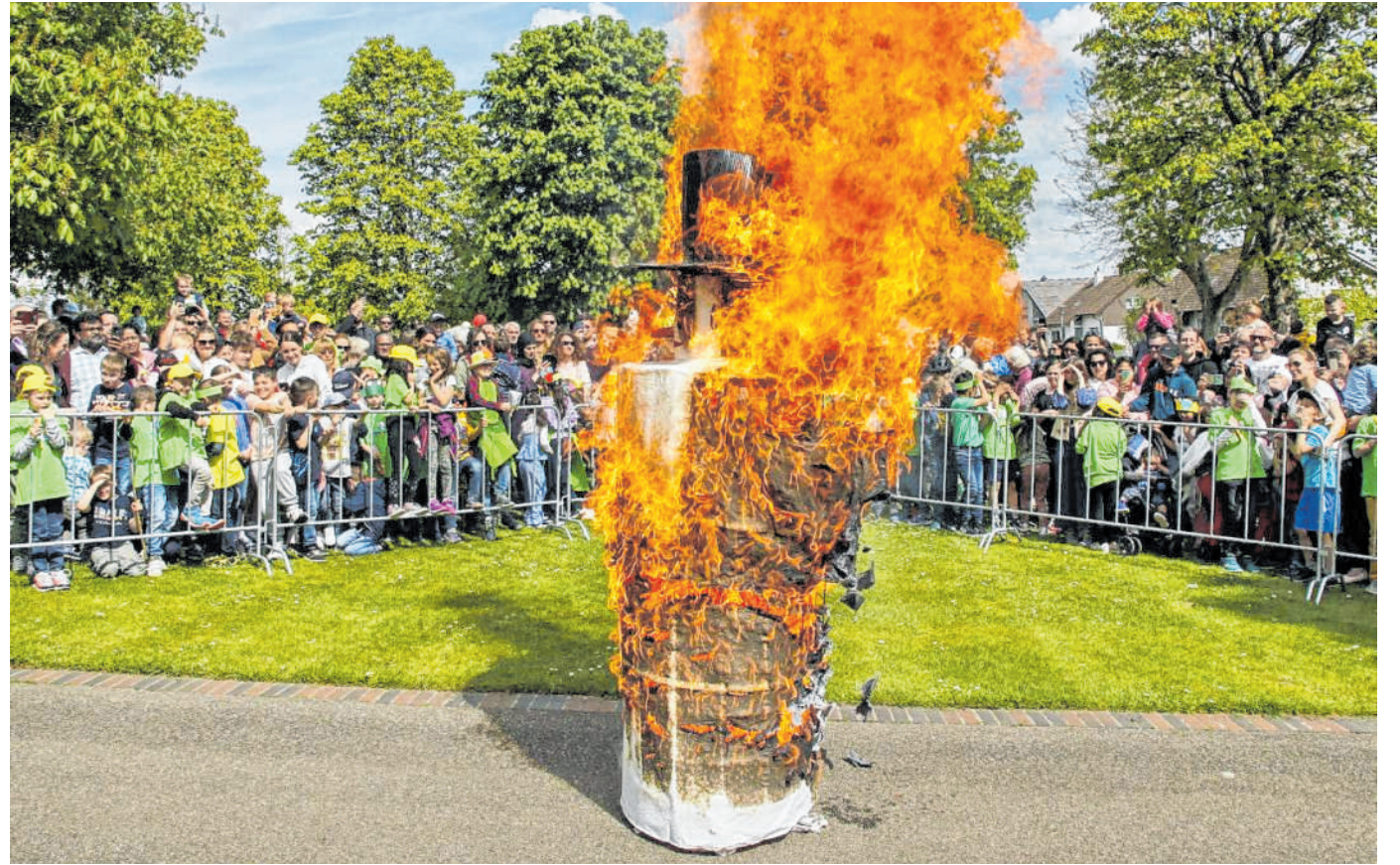
Ein beliebtes Ereignis ist der Sommertagszug, bei dem am Ende der Winter verbrannt wird: Das Frühlingsfest findet am 20. und der Sommertagszug am 21. April statt.

Am Dienstag ist der große Familientag, an dem es vor allem auch ermäßigte Preise für alle gibt.