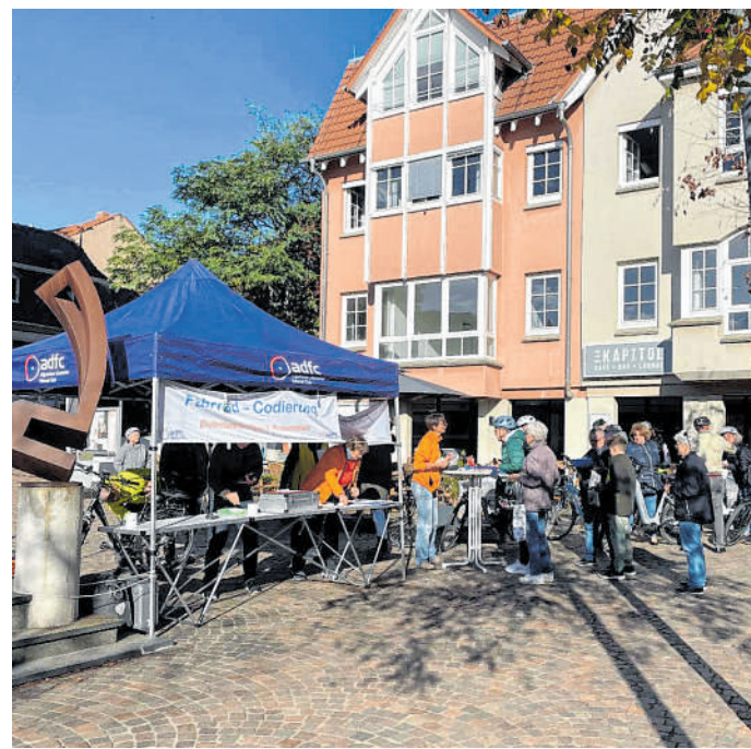
Fahrradcodierung in Wiesloch: Aufgrund der hohen Nachfrage, bietet die ADFC Ortsgruppe diese Aktion auch in Walldorf an.