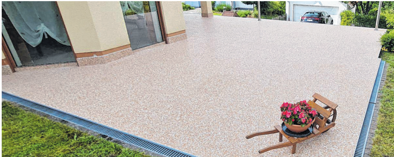
Hochwertiges Sanierungssystem: Interessierte werden von Fachleuten der Firma happySystem professionell beraten.