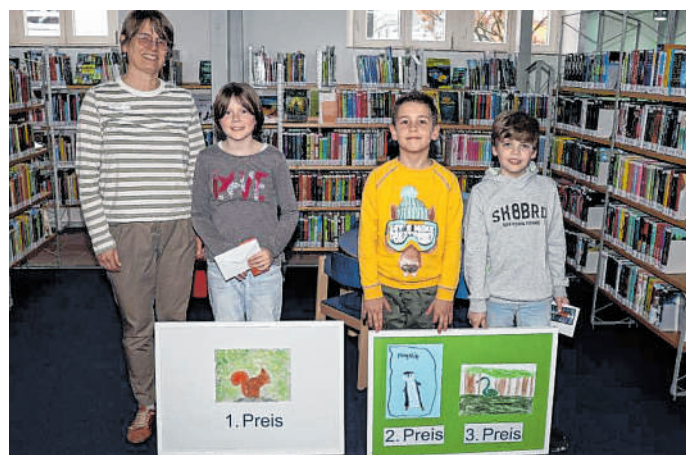
Preise für junge Künstler übergeben: Die Bilder der Gewinner wurden in der Waldorfer Stadtbücherei aufgehängt.

Informationen können unter der Telefonnummer 0177/ 886 9631 angefordert werden. Mehr auch online unter www.taekwondo-wiesloch.de