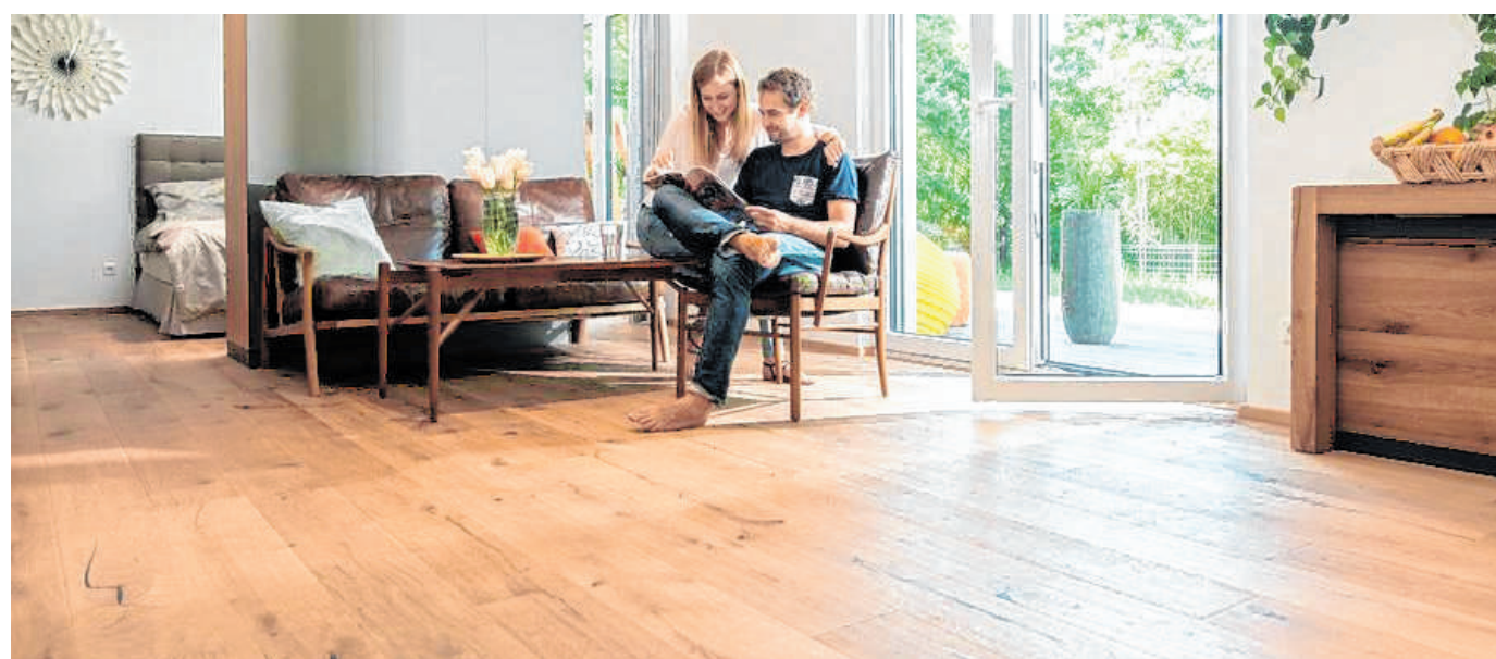
Gleicher Boden in einer komplett neuen Optik: Erfahrene Parkettprofis können alle Echtholz-Beläge aufbereiten und vielseitig gestalten.