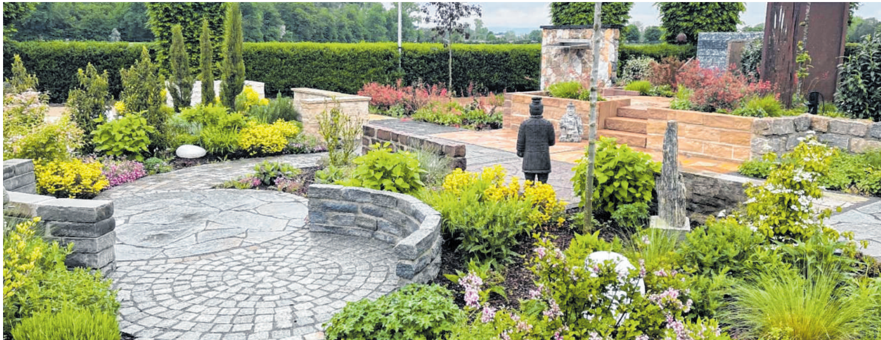
Besonderes Ambiente: Das umfassende Sortiment kann man sich in der großzügig angelegten Ausstellung anschauen.