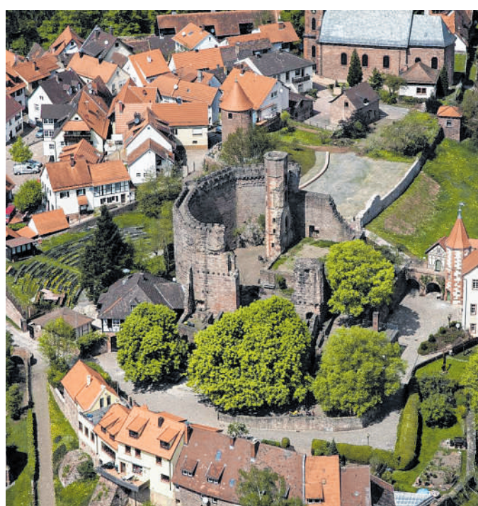
Burgfeste Dilsberg: Dienstags bis sonntags und an Feiertagen können Gäste den atemberaubenden Panoramablick über das Neckartal und die Hügel des Odenwalds genießen.

Die Burgfeste Dilsberg thront majestätisch auf einem 288 Meter hohen Bergsporn. Das Monument bietet einen unvergleichlichen Blick über das Neckartal und die Hügel des Odenwalds. Die Geschichte der Burg reicht bis ins 12. Jahrhundert zurück und lädt dazu ein, auf