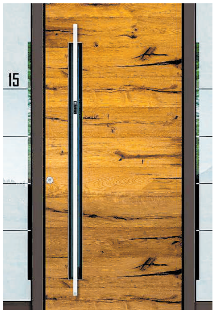
Das Unternehmen Wohnkonzepte Wittmer bietet für jedes Haus genau die richtige Lösung: Im Trend liegen flügelüberdeckende Aluminiumhaustüren mit Holzdesign und Fingerprintsystem im Türgriff integriert.

Eine Haustüre besteht zum einen aus dem Rahmen- und Flügelprofil, zum anderen aus der Türfüllung. Die Türfüllung gibt es in vielen Designvarianten. Sie wird in das Flügelprofil eingesetzt und gibt der Türe ihr individuelles Gesicht. Türfüllungen gibt es als Einsatzfüllung oder in einer flügeldeckenden Ausführung. Dazu ein passender Stoßgriff außen und ein Innentürdrücker raumseitig. Bei den flügeldeckenden Haustürfüllungen wird der Stoßgriff aus Designgründen häufig auch direkt auf der Türfüllung befestigt. Was die Beschlagtechnik be-