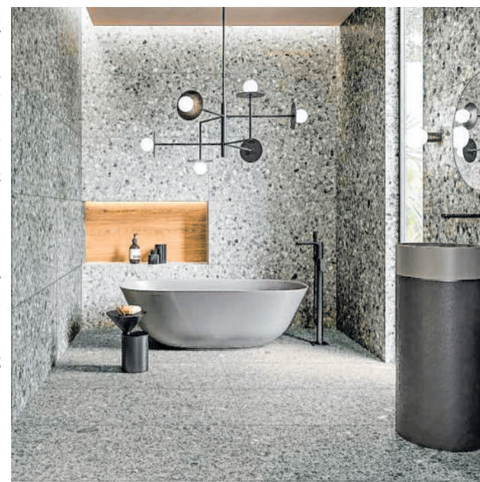
Ästhetik und Komfort: Fliesen im Natursteinlook sind zeitlos-hochwertige Materialien für eine Innenausstattung, die optisch und funktional problemlos Jahrzehnte überdauern kann. BILD: DJD/DEUTSCHE-FLIESE.DE/VILLEROY & BOCH FLIESEN

Der Renovierungsbedarf im Bad ist groß: Laut einer Umfrage der Vereinigung Deutsche Sanitärwirtschaft denken über sechs Millionen Deutsche über eine Komplettsanierung im Bad nach. Neben dem Wunsch nach Komfort und mehr Wohnqualität ist für viele die Unsicherheit an den Finanzmärkten ausschlaggebend: Sie führt dazu, dass lieber in das eigene Zuhause investiert wird. Auch die Heizungsmodernisierung und der Wechsel zu Wärmepumpe und Bodenheizung sind wertsteigernde Investitionen in die eigenen vier Wände, in deren Zug auch häufig die Bodenbeläge erneuert werden.