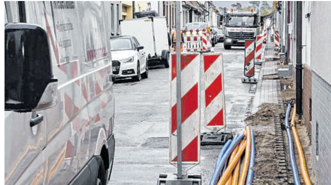
BILDER (2): STADT WALLDORF