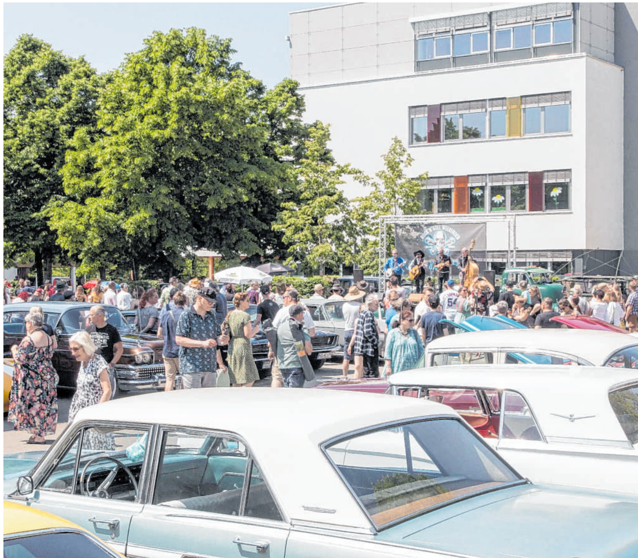
Rust'n'Chrome: Das Oldtimer-Autotreffen am Pfingstmontag hat sich in vergangenen Jahren zu einem Besuchermagnet entwickelt. BILD: STADT WALLDORF

Telefon: 0621/ 392 2814 E-Mail: crink@ haas-publishing.de