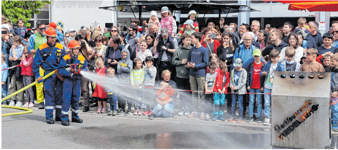
Wenn der Nachwuchs Brände löscht: Die Schauübung der Jugendfeuerwehr wollte sich kein Besucher entgehen lassen.