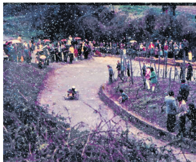
Die Anfangszeit: Das erste Rennen wurde 1973 am Mannaberg durchgeführt.

Die Organisatoren erkannten das Potenzial der Veranstaltung und öffneten die Teilnahme bald für andere Vereine und Gruppen, so dass sich das Rennen schnell zu einem Großereignis entwickelte. Viele befreundete Vereine und KJGs anderer Gemeinden nahmen fortan an