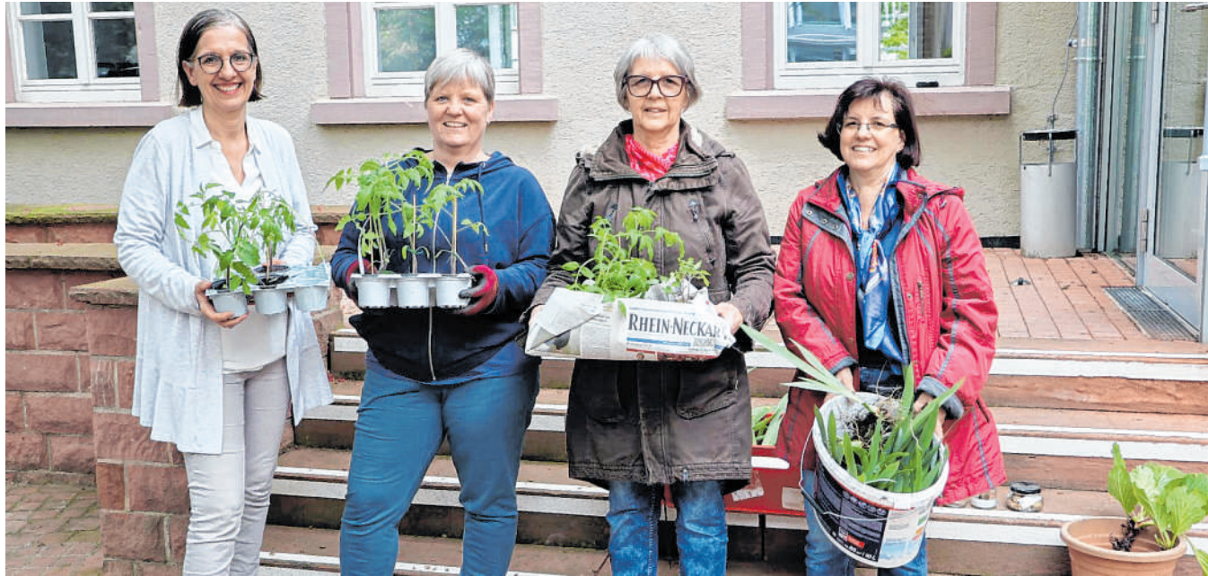
Saatgutbibliothek gut angenommen: Der Verein zur Erhaltung der Nutzpflanzenvielfalt (VEN) hat das Saatgut für alte Gemüsesorten bereitgestellt.