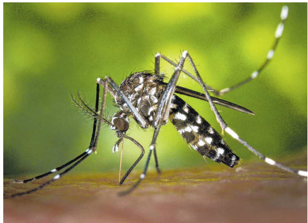
Wasseransammlungen vermeiden: Bereits kleine natürliche oder künstliche Gewässer genügen der anpassungsfähigen Tigermücke zur Eiablage.

Das Ergebnis: Nach dem Bestattungsgesetz seien mit Ruhezeiten keine subjektiv-öffentlichen Rechte verbunden, daher könnten diese auch für bereits belegte Gräber verkürzt oder verlängert werden. Auch das Kommunalrechtsamt des Rhein-Neckar-Kreises habe keine Bedenken gegen die Satzungsänderung. Es habe jedoch ausdrücklich darauf hingewiesen, dass durch eine Verkürzung der Ruhezeit keine Erstattungsansprüche entstehen. red