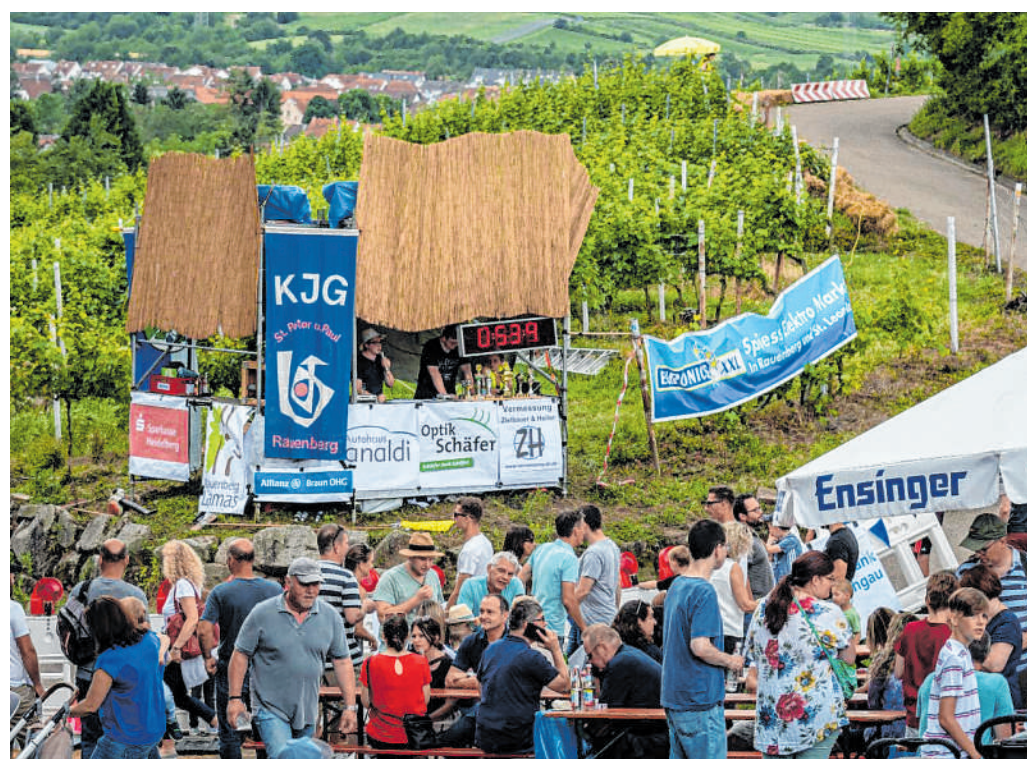
Kurzentschlossene können sich am Renntag noch nachmelden: Auf dem Moderatorenturm wird über die einzelnen Rennen live berichtet.