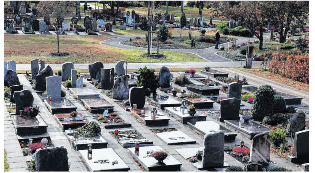
Eine Möglichkeit, ohne Zwang: Nach der neuen Friedhofsatzung haben Urnenwahlgräber eine Ruhezeit von 15 Jahren, während die Nutzungszeit 20 Jahre beträgt und Verlängerungen durchaus möglich sind.

Mehr zur Tigermücke, zu Bekämpfung und Maßnahmen finden Interessierte auf der Infoseite tigermuecke-icybac.de. Mit Rückfragen kann man sich an die E-Mail-Adresse tigermuecke@rhein-neckar-kreis.de wenden.