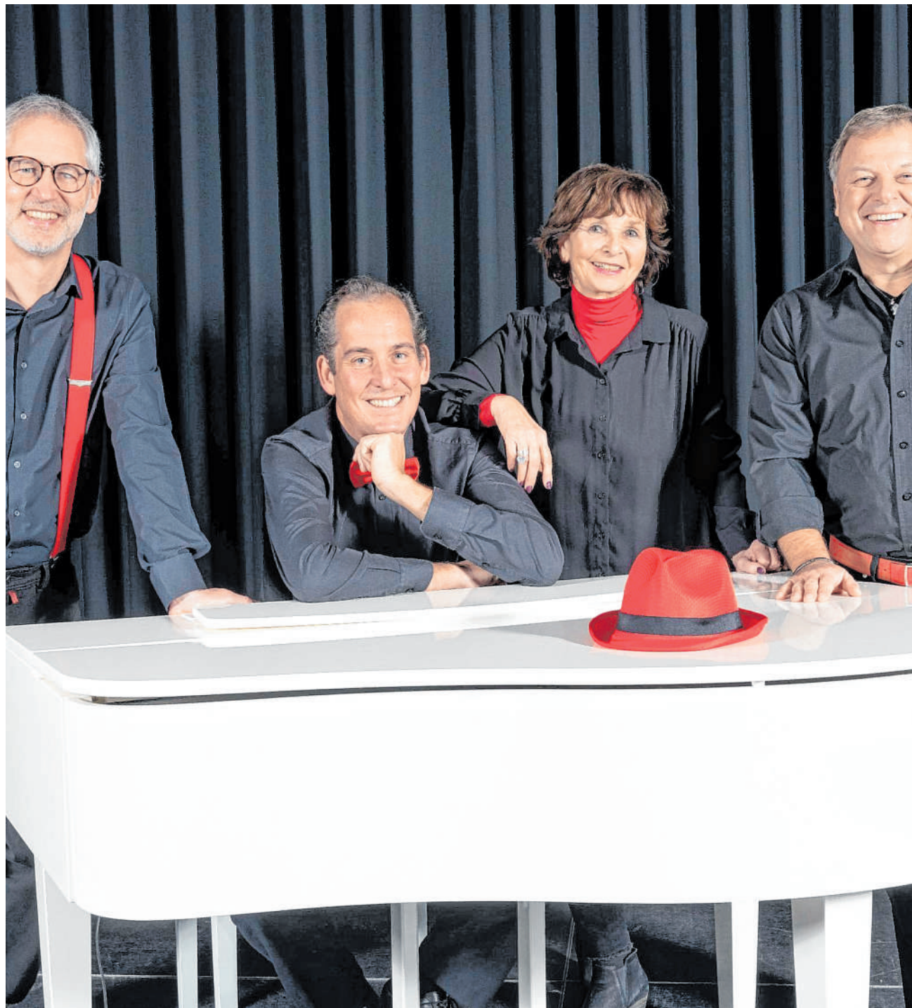
Kabaretttruppe aus Weinheim: Die Spitzklicker wirft ihren sprichwörtlichen Hut im April in den Ring der Festhalle.

Telefon: 0621/ 392 2814 E-Mail: crink@ haas-publishing.de