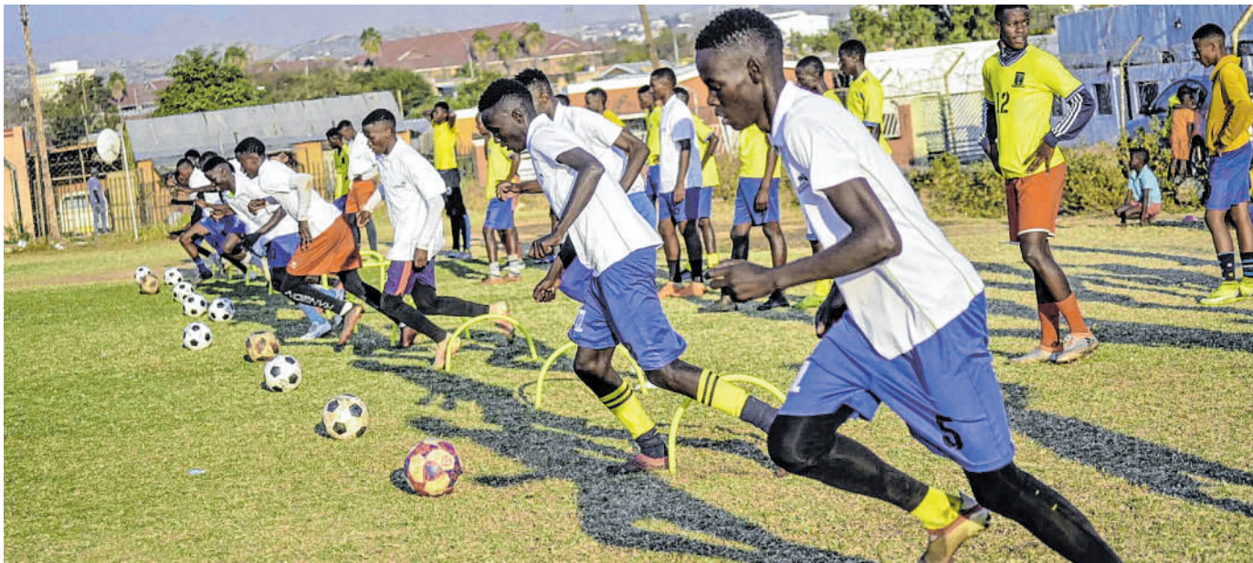
Fußball als Lebenschance: Eines der aktuellen Projekte des Vereins Hilfe zur Selbsthilfe.