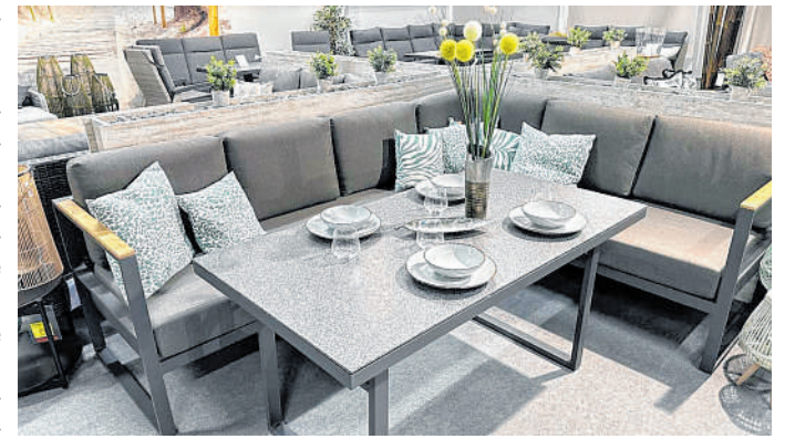
Noch bis 6. April im Angebot: Viele attraktive Angebote, Einzelteile, Tischsets und Loungemöbel gibt es bei Gartenmöbel-Riesen Bacz in Helmstadt.

Fazit: Man sollte unbedingt das große Gartenmöbelgeschäft-Bacz in Helmstadt, beim größten Gar-