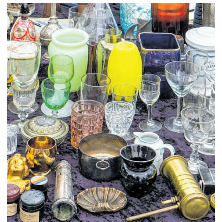
Von Büchern bis Porzellan: Der dritte Hofflohmart findet von 11 bis 16 Uhr in Rotenberg statt.

sowie im Flyer aufgeführt. Jeder Teilnehmer ist Veranstalter seines eigenen Flohmarkts. Angeboten werden können Waren aller Art, ausgenommen sind Speisen und Getränke zum direkten Verzehr. Der Verkauf von beispielsweise selbst gemachten Marmeladen sind allerdings möglich. Für den Verkauf sollte man das private Grundstück nutzen und die Gehwege frei halten. Externe Standbetreiber oder gewerbliche Anbieter sind nicht zugelassen. red