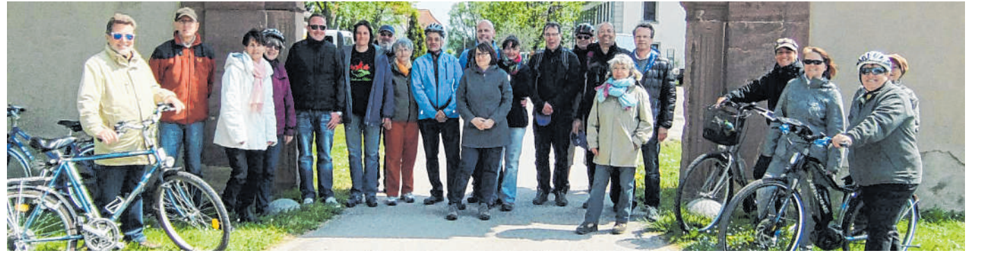
Beliebt: Auch 2016 fand der Naturerlebnistag als Radtour statt.

Weitere Informationen zum Stadtradeln in Brühl geben im Rathaus die Klimaschutzbeauftragte Birgit Sehls, Telefon 06202/200 396, und Katja Rheude, Telefon 06202/200 358.