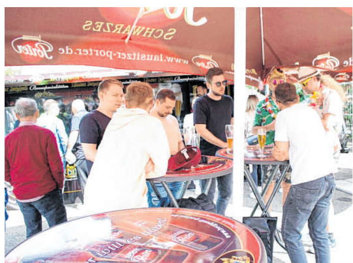
Vatertagsfest des Ketscher Vereinsstammtisches: Leckereien und gute Stimmung gibt es hier am 9. Mai.