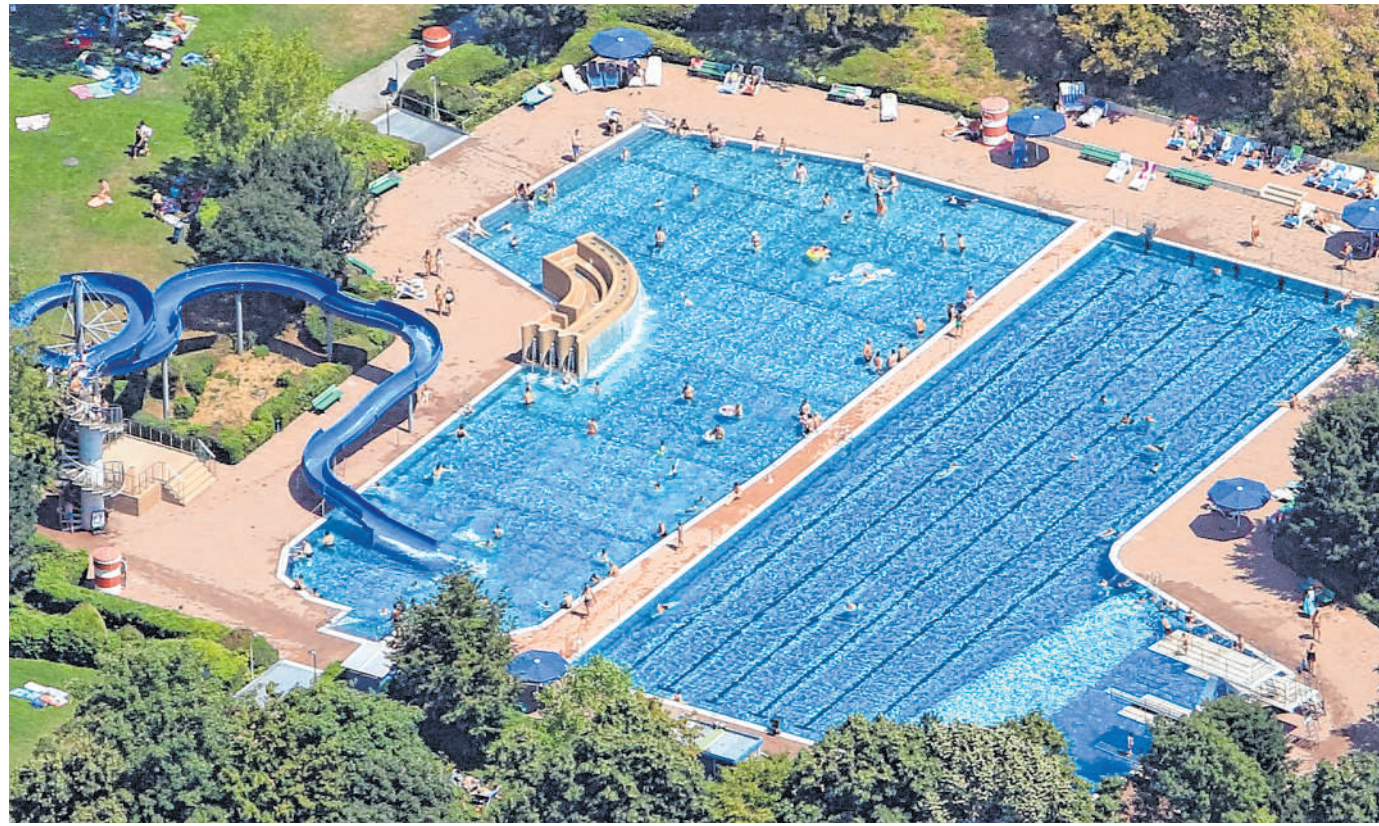
Viele Besucher in spe freuen sich schon jetzt auf die kommende Freibadsaison: Nicht ohne Grund zählt die Brühler Anlage zu den schönsten der Region.