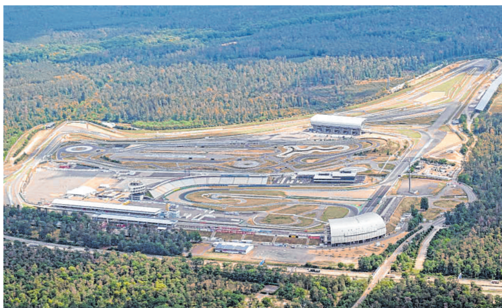
Soll in den kommenden zehn Jahren für Besucher attraktiver werden: Am Hockenheimring sind unter anderem ein neues Hotel und eine „Motorworld“ geplant.

Hockenheim. Der Hockenheim-Gemeinderat hat am Mittwochabend einstimmig bei drei Enthaltungen die Weichen für die Weiterentwicklung des Hockenheimrings beschlossen. Die Politiker gaben grünes Licht für den Einstieg eines Konsortiums aus fünf Wirtschaftsunternehmen, die sich als Emodrom Group Holding zusammenschlossen haben. Demnach treten die Stadt und der Badische Motorsportclub (BMC), die derzeit sämtliche Geschäftsanteile der Hockenheim-Ring GmbH halten, 74,99 Prozent davon an die Emodrom Group Holding ab.