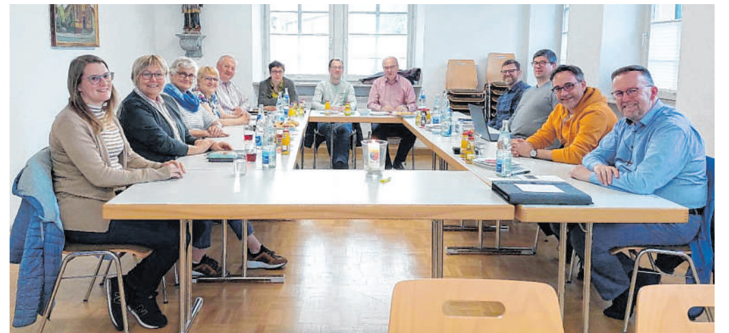
Planung: In einer gemeinsamen Sitzung prüften die Projektleitung, der Vorstand der PGR-Vollversammlung sowie die Projektkoordinatoren den aktuellen Entwurf der Gründungsvereinbarung, zu dem nun Rückmeldungen gesammelt werden.

Weitere Informationen gibt es unter www.plankstadt.de .