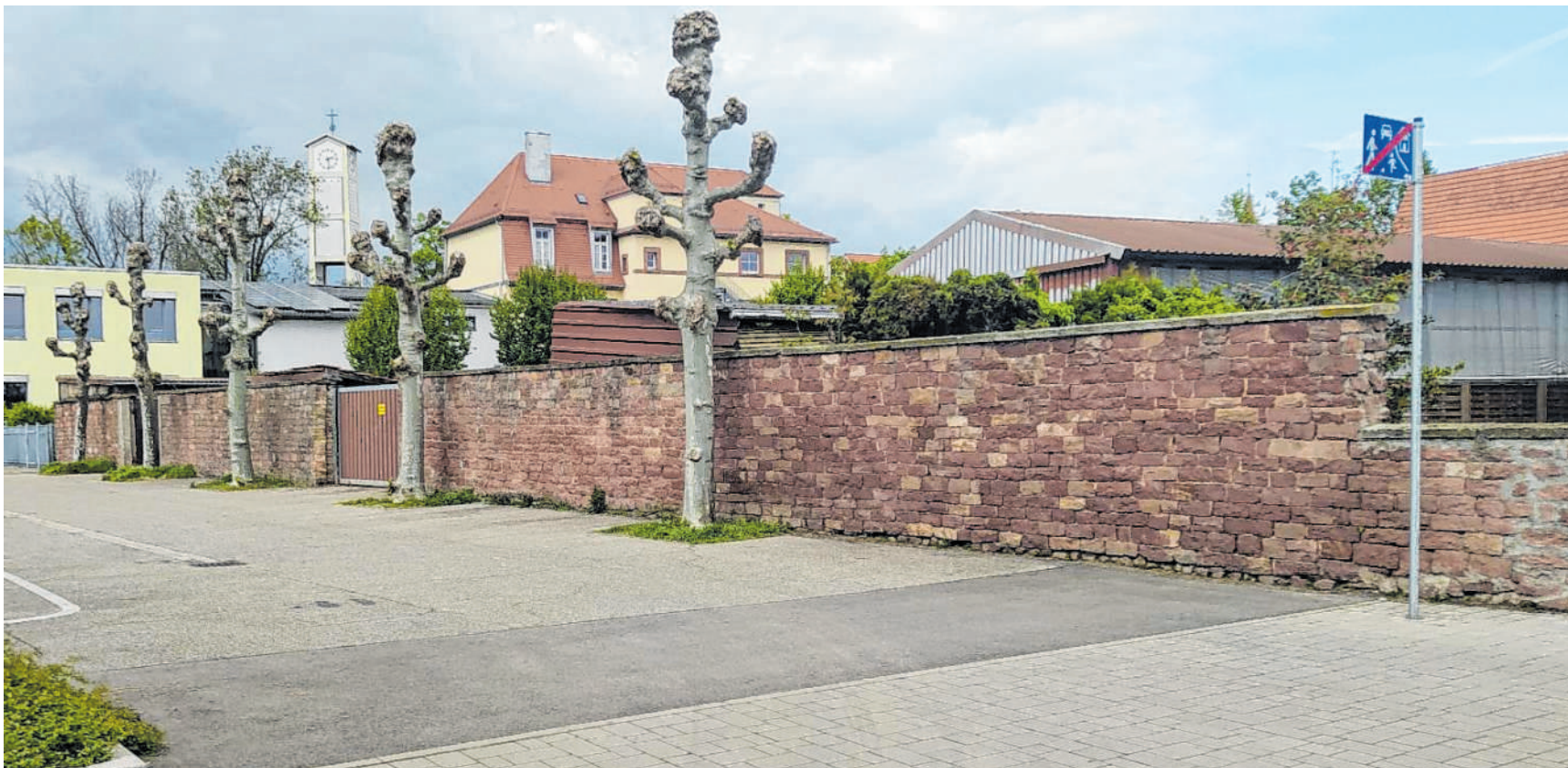
Blick aus der Gerhart-Hauptmann-Straße in Richtung Festplatz: Von hier aus oder über die Freiherr-vom-Stein-Straße soll die Zufahrt zu den beiden Grundstücken – hinter der Mauer an den Bäumen – künftig erfolgen.

Grundsätzlich ging es bei dem Tagesordnungspunkt erst mal um die Entscheidung, die beiden Grundstücke überhaupt zu erschließen und in welcher Form. Beschlossen ist nun eine offene Wegführung, sprich ohne dauerhafte Abgrenzung in Richtung des Festplatzes. Wenn dort allerdings regelmäßige Veranstaltungen wie die Kerwe stattfinden, wäre nur eine Zufahrt für Rettungsfahrzeuge an dieser Stelle möglich, kein regulärer Pkw-Verkehr.