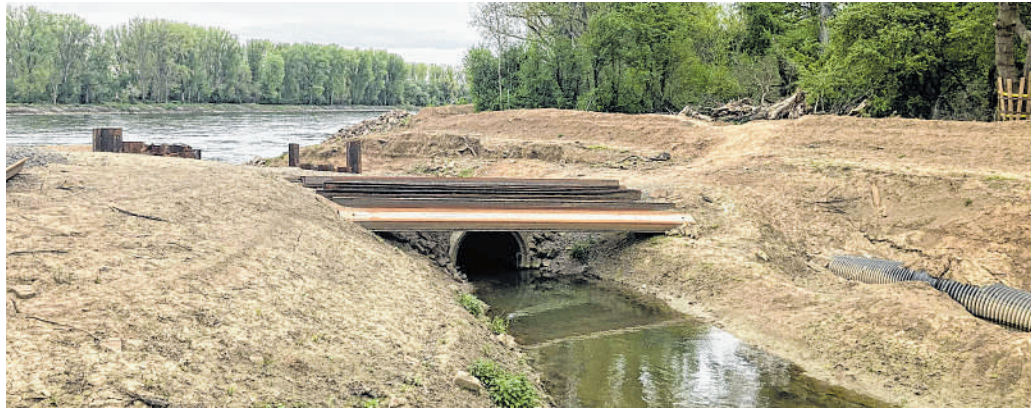
Nichts passiert zurzeit bei der Baustelle an der Leimbachbrücke: Das sorgt bei manchen Zeitgenossen für sehr viel Unmut.