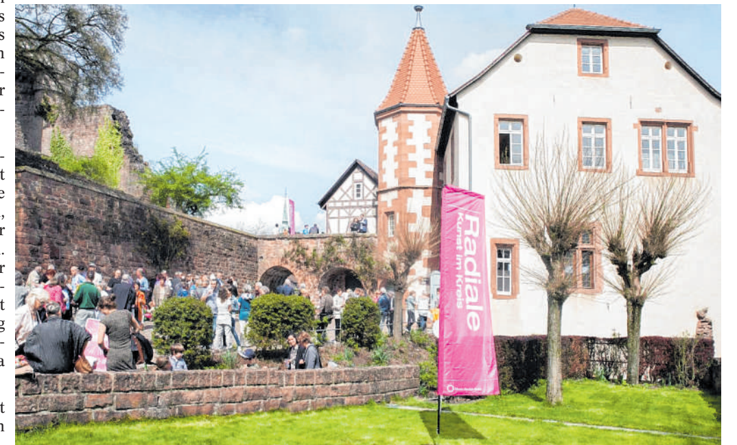
Die nächste Radiale öffnet ihre Pforten im Frühjahr 2025: Ortsspezifische Ausstellungskonzeptionen an mehreren Orten im Landkreis prägen das Ausstellungskonzept.