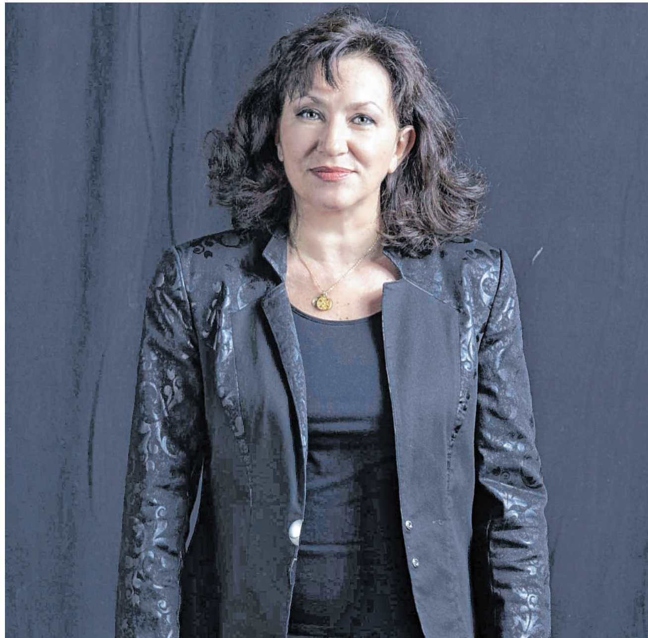
Konzert: Die Deutsche Radio Philharmonie und Chefdirigent Pietari Inkinen geben sich die Ehre. Die Sopranistin Krassimira Stoyanova ist bei dem Konzert eine der führenden Strauss-Sängerinnen.

Telefon: 0621/ 392 2802 E-Mail: kschwindt@ haas-publishing.de