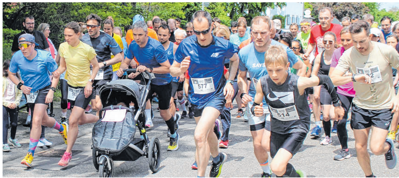
Die Läufer gehen wie im Vorjahr auf drei Strecken: Jugendliche und Erwachsene absolvieren fünf oder zehn Kilometer, Kinder und Senioren 1000 Meter.

HARDTRUN: Organisationstrio freut sich über hohe Anmeldezahlen für die dritte Auflage