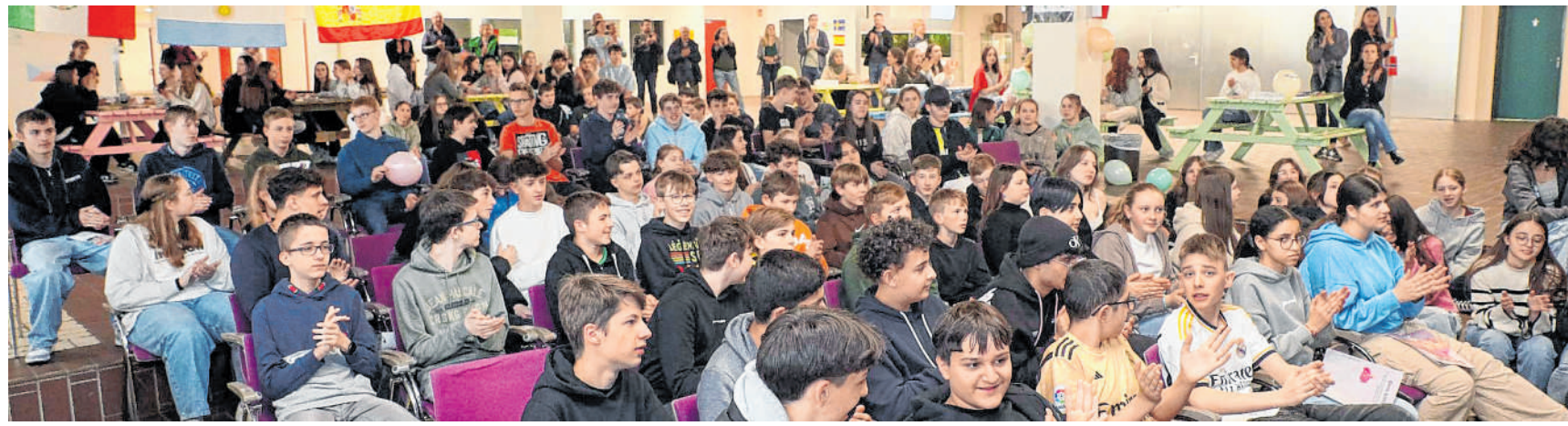
Vielfalt: Der interkulturelle Austausch steht am Gauß-Gymnasium im Zentrum eines Aktionstages gegen Rassismus, dabei lernen die Teilnehmer Essen und Tänze aus verschiedenen Ländern kennen.