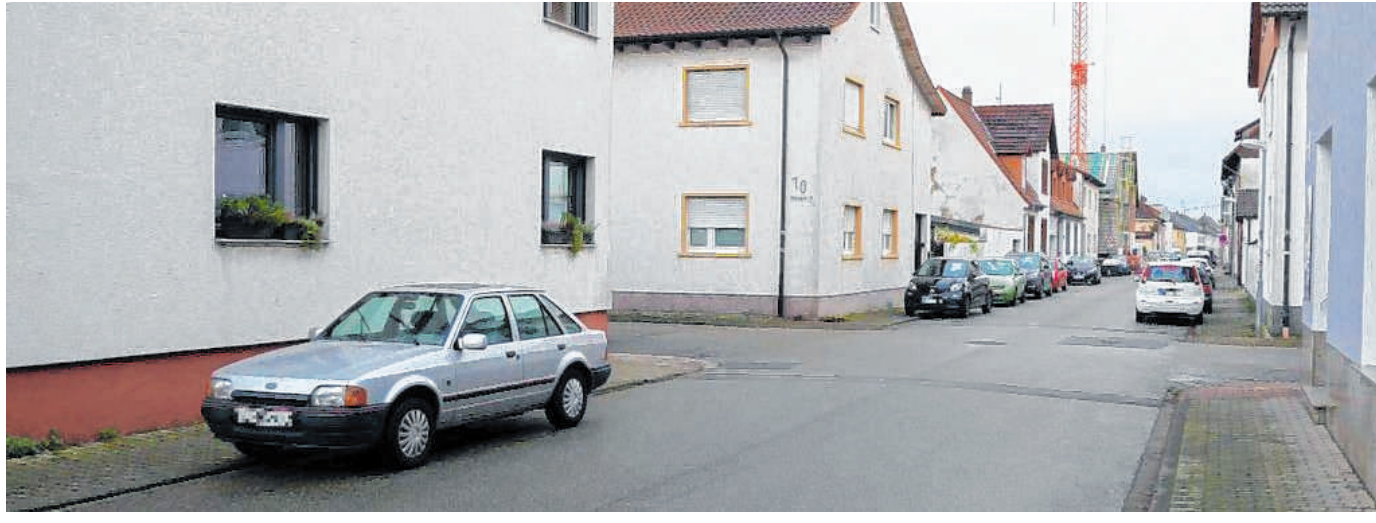
Der nächste Schritt zum Großprojekt für die Kanalsanierung in der Enderlestraße ist vollbracht: Die Tiefbauarbeiten sind vom Gemeinderat vergeben und sollen Anfang Mai beginnen.