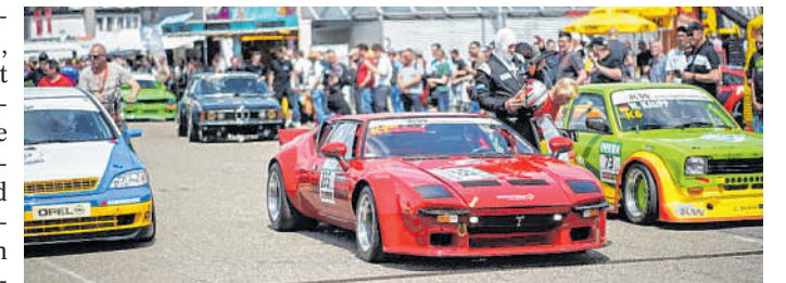
Wettkämpfe: Bei den ADAC Hockenheim Historics lassen Rennwagen das Herz von Motorsportfans höher schlagen.

Zum Auftakt der Kooperation hat man sich eine Überraschung für die Besucher überlegt: Am Samstag und Sonntag können Fans aus Richtung Stuttgart die Reise zum Event in einem historischen Bus antreten. ring