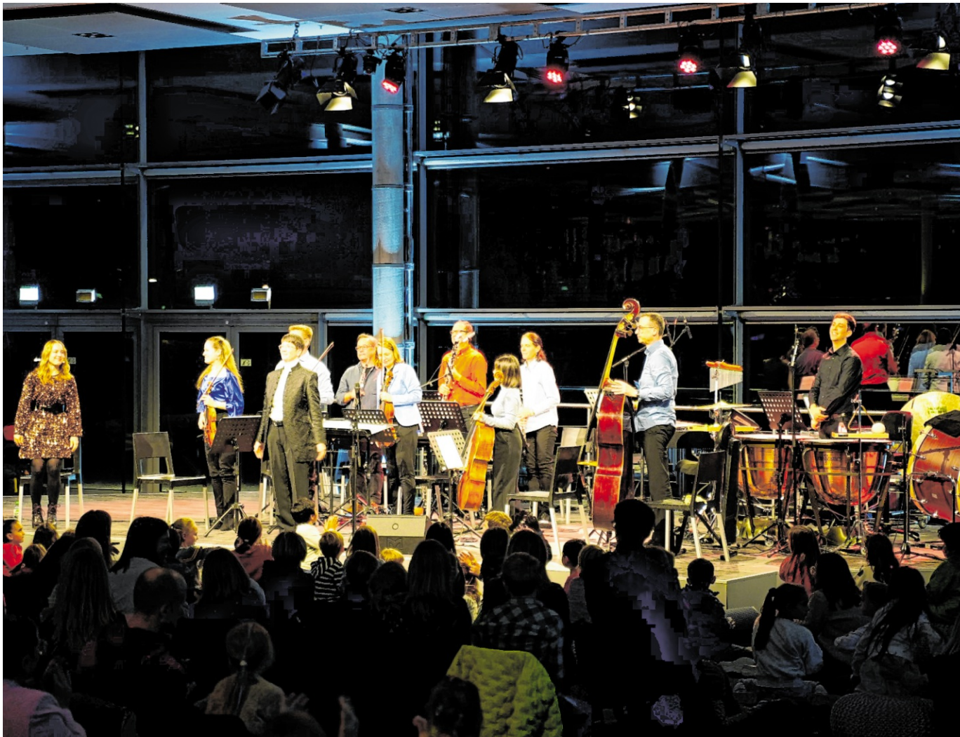
Das SAP Sinfonieorchester gibt im Königssaal von Schloss Heidelberg ein Benefizkonzert zugunsten der Stammzellenforschung.