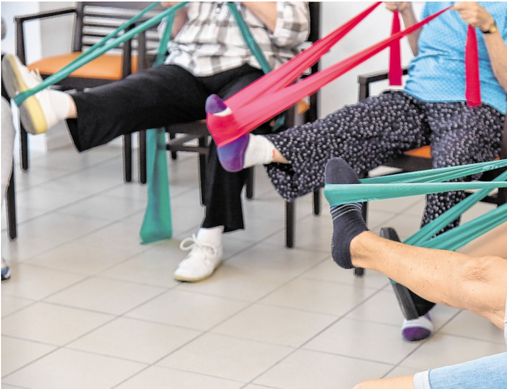
Fit wie ein Turnschuh: Gymnastik ist Teil des Angebots der Heidelberger Mobilitätstagen für Ältere ab Montag, 4. Mai.

Das ausführliche Programm der Mobilitätstage mit allen Angeboten findet sich vor Ort und auf der Internetseite des Seniorenzentrums Weststadt/Südstadt unter www.seniorenzentren-hd.de/seniorenzentren/weststadt/mobilitaetstage .