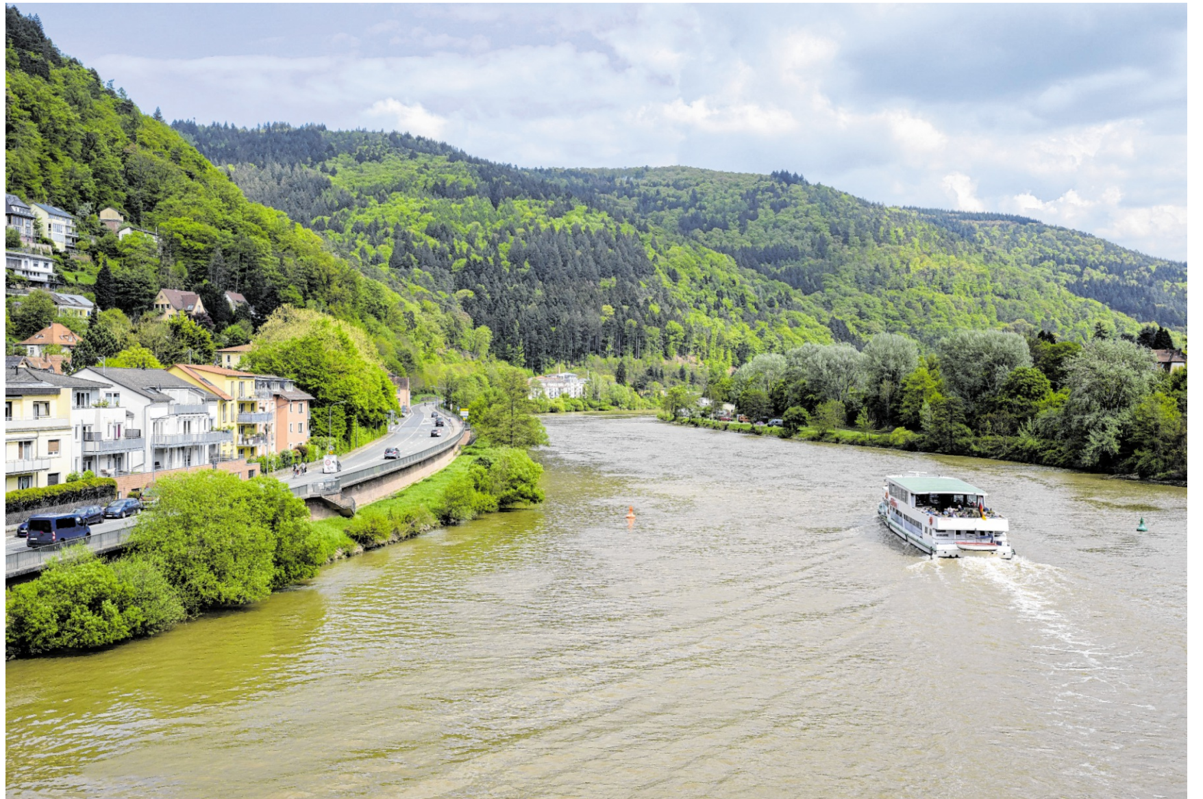
Der Lammerskopf zwischen Ziegelhausen und Kleingemünd ist als Standort für sieben Windkraftanlagen im Gespräch.

Die AZP GmbH ist ein Unternehmen der HAAS Mediengruppe: Mannheimer Morgen, Südhessen Morgen, Bergsträßer Anzeiger, Schwetzingener Zeitung, mannheimer-morgen.de, Mannheim24.de.