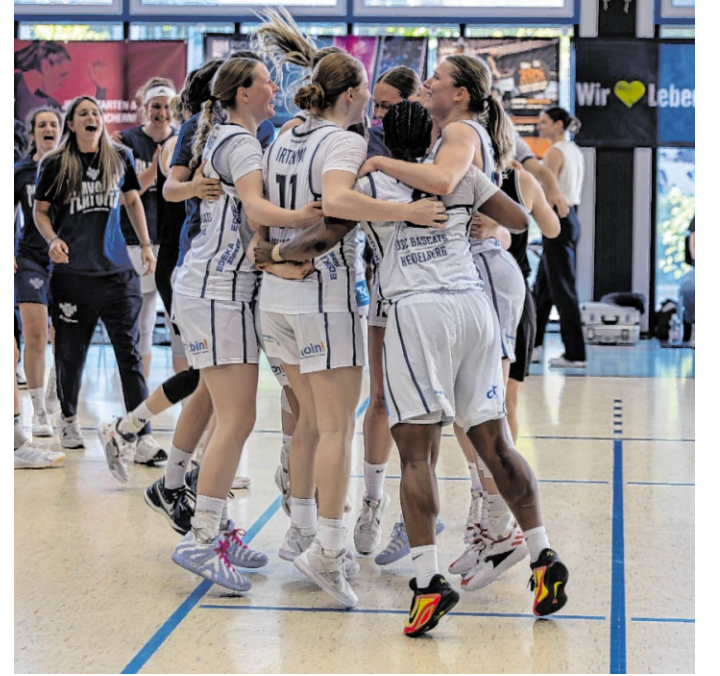
Der Jubel der BasCats kannte keine Grenzen.