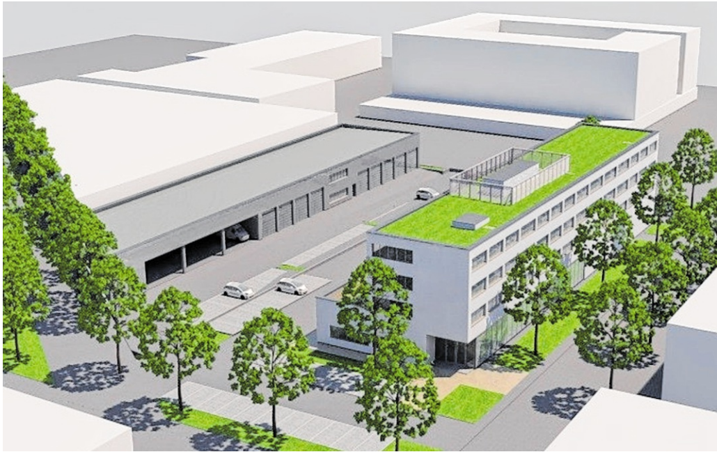
Der DRK-Kreisverband Rhein-Neckar/Heidelberg treibt den Neubau seines Rettungszentrums in Heidelberg weiter voran.

Im Januar hatte der Finanzausschuss des Landtags angekündigt, den Neubau der Rettungswache Heidelberg mit einem Zuschuss in Höhe von rund 5,6 Millionen Euro zu fördern. Mit dem nun zugestellten Bescheid liegt eine verbindliche Zusage der Gelder vor. Die Landesförderung ist neben Eigenmitteln und Spendengeldern ein zentraler Baustein für die Umsetzung des Neubaus mit Gesamtkosten von rund 19 Millionen Euro.