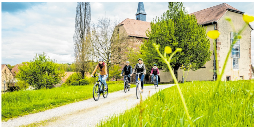
Auch das Kloster Lobenfeld wird im Rahmen einer Radtour der RadGuides Rhein-Neckar angesteuert – diese starten nun wieder mit vielen interessanten Touren in die Saison.

Zu den ersten Touren der Saison zählt am 3. Mai um 10 Uhr die Fahrt „Schwarzbach von der Quelle bis zur Mündung“. Die großzügige Tour führt über 56 Kilometer entlang von Lobbach und Schwarzbach, den zwei größten Zuflüssen der Elsenz. Von Meckesheim aus fährt die Gruppe das Lobbachtal aufwärts bis Haag. Weiter geht es über Schwanheim zur Quelle des Schwarzbachs oberhalb von Neunkirchen, dem höchsten Punkt der Tour.