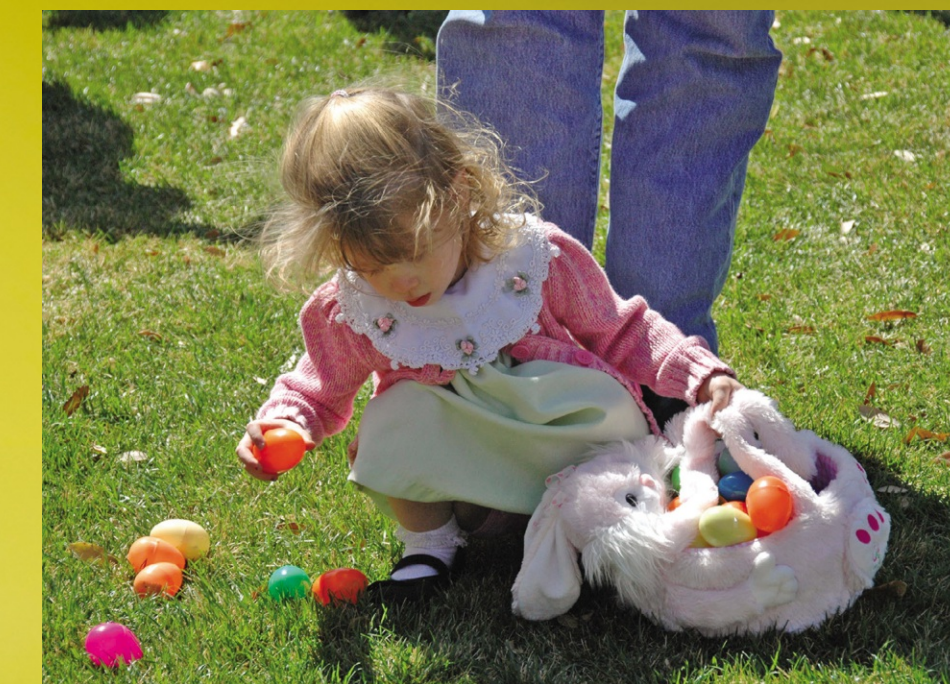
Jedes Kind fiebert der Osterhase suchende Freude entgegen.