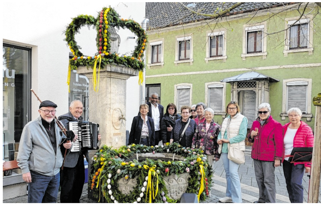
Einweihung mit musikalischer Begleitung und österlichem Glanz: Der Bärenbrunnen erstrahlt als farbenprächtiges Symbol für den Frühling.

Gemeinsam mit Fachleuten und lokalen Akteuren sollen im Rahmen des Projekts konkrete Maßnahmen entwickelt werden, um die Bevölkerung besser vor Hitze zu schützen und die Lebensqualität nachhaltig zu sichern. Das Projekt ist bis Ende diesen Jahres angelegt. red