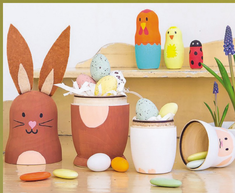
Überraschung: Aus manchen Osterhasen kommen Eier, aus anderen schlüpft ein Lamm, ein Huhn, ein Küken, ein Marienkäfer.

Niedliche Figuren mit Überraschungseffekt