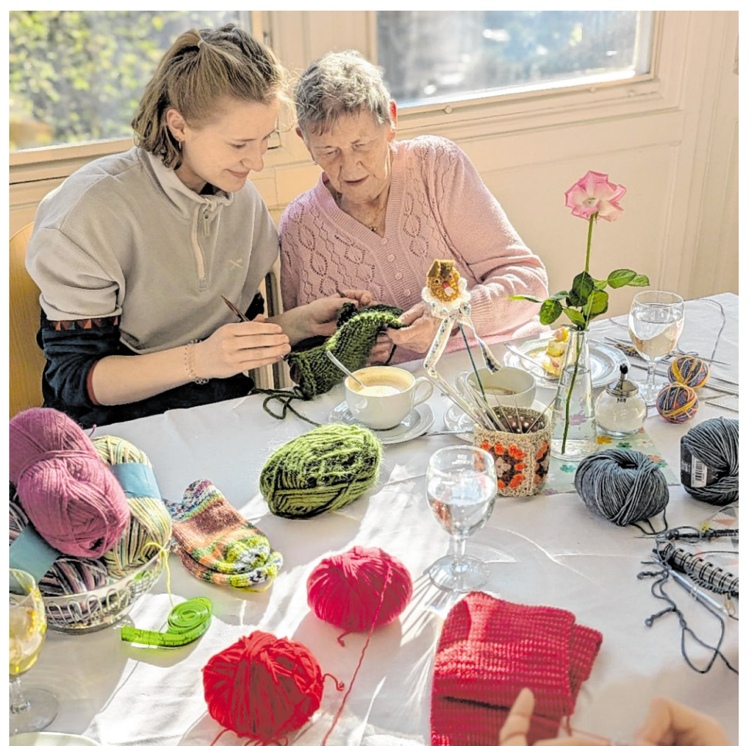
Das Seniorenzentrum Weststadt ist eines der drei neuen offenen Strickcafés, in der Menschen aller Generationen eingeladen sind, sich am Sockenstrick-Weltrekord zu beteiligen.

Aber auch bestehende private Handarbeitsgruppen und Einzelstricker sind eingeladen, sich am Weltrekord zu betei-