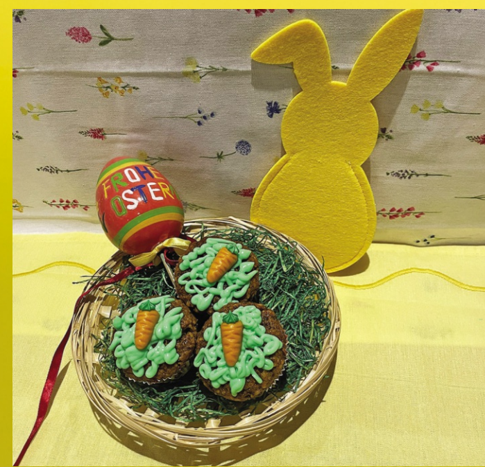
Karotten-Schoko-Muffins mit Frischkäse-Topping passen gut zur Osterzeit.

Ostern steht vor der Tür - und neben Basteln gehört auch das Backen einfach dazu. Es müssen jedoch nicht immer große Torten oder klassische Kuchen sein: Kleine Küchlein sind eine willkommene und praktische Alternative. Die Karotten-Schoko-Muffins mit Frischkäse-Topping wurden bereits ausprobiert - mit überzeugendem Ergebnis. Sie gelingen zuverlässig, schmecken köstlich und eignen sich hervorragend zum gemeinsamen Backen und Dekorieren, auch mit kleinen Bäckerinnen und Bäckern.