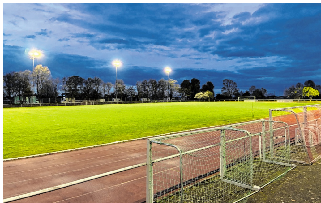
In nur einer Woche wurde die Flutlichtanlage auf dem Schriesheimer Sportplatz vollständig modernisiert. Nun gibt es beste Bedingungen für Sport und Training.