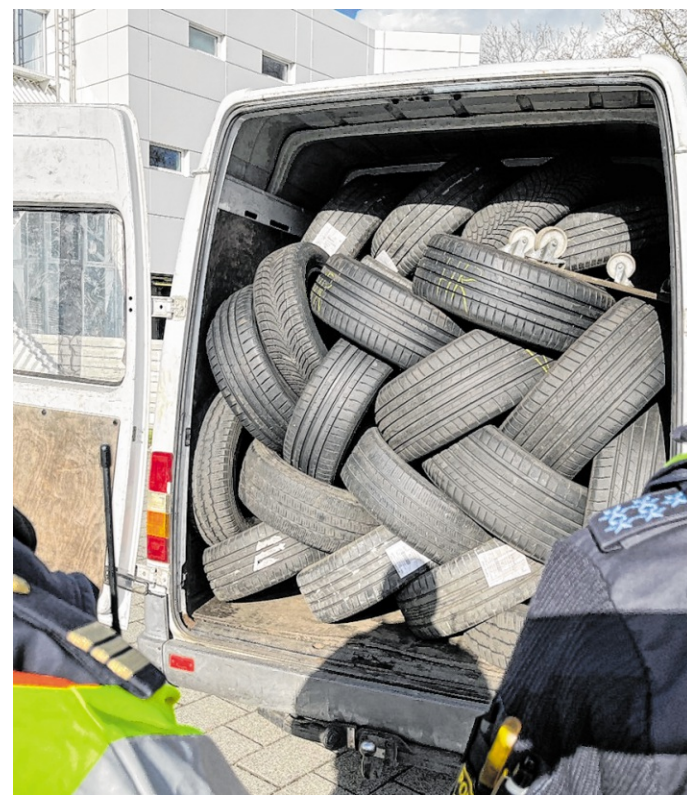
Bei einer Kontrolle in Heidelberg wurde ein Abfalltransport ohne die vorgeschriebene Kennzeichnung gestoppt – die Weiterfahrt wurde bis zur Behebung der Mängel untersagt.

► Vier Verstöße gegen die Straßenverkehrsordnung, dar-