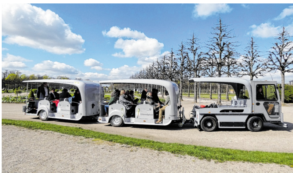
72 Hektar Gartenkunst ganz entspannt erleben: Die Solar-Wegebahn bringt Besucher klimafreundlich zu den Highlights der Anlage.

Mit der neuen Solar-Wegebahn wird es nun deutlich einfacher, den gesamten Garten zu erkunden – insbesondere für Gäste, die nicht gut zu Fuß sind. Die etwa 90-minütige Rundfahrt startet an der Schlossterrasse und führt durch die wichtigsten Bereiche der Anlage.