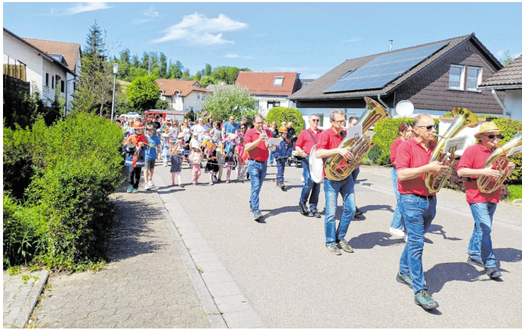
Beim Sommertagsumzug in Gauangelloch zogen zahlreiche Teilnehmer durch den Ort und feierten anschließend beim Frühlingsfest weiter.