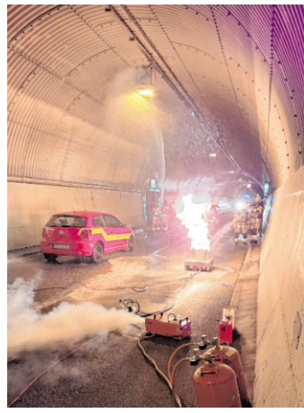
Für die Übung im Schlossbergtunnel wurde ein anspruchsvolles Brandszenario angenommen.

Heidelberg. Rund 70 Einsatzkräfte von Berufsfeuerwehr und Freiwilliger Feuerwehr, Technischem Hilfswerk, Polizei und Rettungsdienst haben am Montagabend, 27. April, die Bekämpfung eines Autobrandes mit mehreren verletzten Personen im Schlossbergtunnel geübt. Die Feuerwehr Heidelberg überarbeitet derzeit ihre Einsatzplanung bei Tunnelbränden. Die Übung war ein wichtiger Bestandteil dieses Prozesses, der im Oktober 2026 mit einer groß angelegten Übung seinen Höhepunkt finden soll. Während der Übung war der Schlossbergtunnel wie vorab angekündigt gesperrt. Die Stadt Heidelberg will frühzeitig über Sperrungen anlässlich der Übung im Oktober informieren.