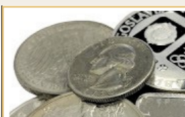
Silbermünzen & Barren