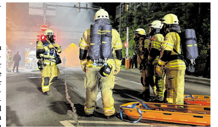
Die Feuerwehr Heidelberg überarbeitet aktuell ihre Einsatzplanung bei Tunnelbränden. Die Übung im Schlossbergtunnel war ein wichtiger Bestandteil in diesem Prozess.

Bereits 2025 hatte die Feuerwehr Heidelberg begonnen, Einsatzkräfte von Berufsfeuerwehr und Freiwilliger Feuerwehr in mehrtägigen Seminaren an der International Fire Academy in der Schweiz für die anspruchsvolle Aufgabe der Tunnelbrandbekämpfung zu schulen. Das dort erlernte Vorwissen wurden in einem Einsatzplan fest definiert. red