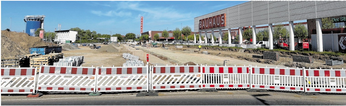
Der Höhenunterschied in der Eppelheimer Straße auf Höhe des Bauhauses wurde mittlerweile ausgeglichen.