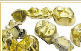
Zahngold (auch mit Zähnen)