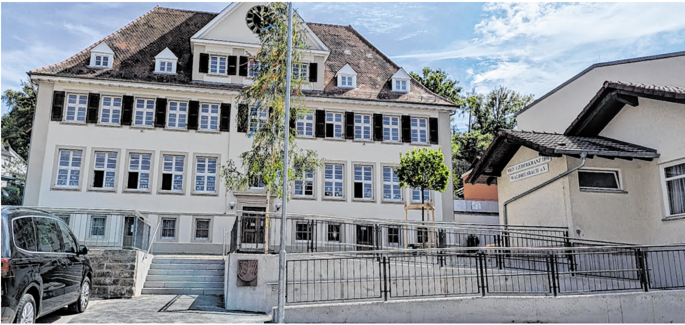
Mit der Fertigstellung der neuen Rampe sind auch die angrenzende Mehrzweckhalle, das Sangerheim und die dortigen Veranstaltungen erreichbar.