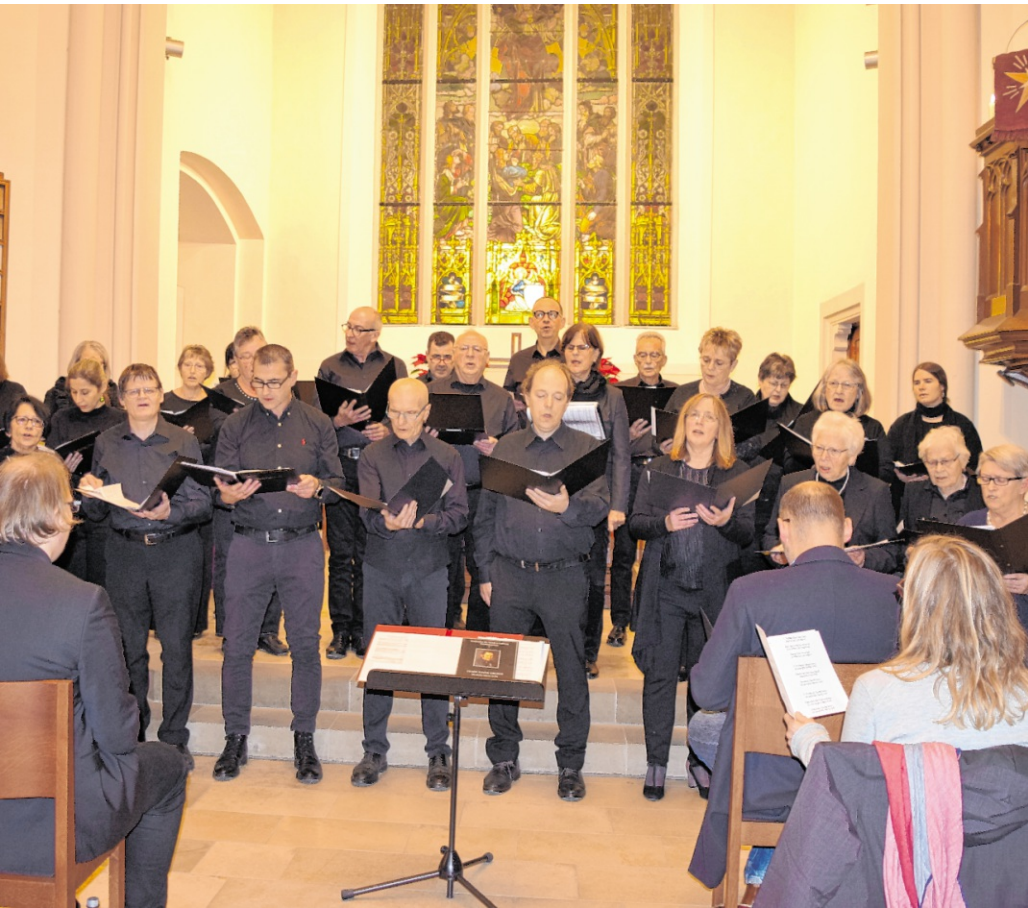
Musikalisch verbindet „Lux quae venit“ avantgardistische Spieltechniken mit vertrauten weihnachtlichen Klängen. BILD: CHOR