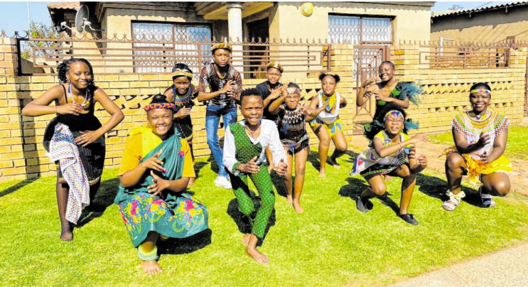
„Komm, tanz mit uns!“: Die jungen Gäste laden dazu ein, Tanz gemeinsam zu erleben.

und Jugendlichen beider Länder. Während ihres Aufenthaltes gestalten sie ein buntes Programm: ■ Workshops in verschiedenen Schulen ■ In Heidelberg: Auftritt auf dem Willy-Weihnachtsmarkt am 13. Dezember um 12 Uhr ■ Konzert mit den Mocos im Augustinum am 14. Dezember um 15.30 Uhr ■ Konzert mit den Mocos in der Chapel am 18. Dezember um 19 Uhr mmh