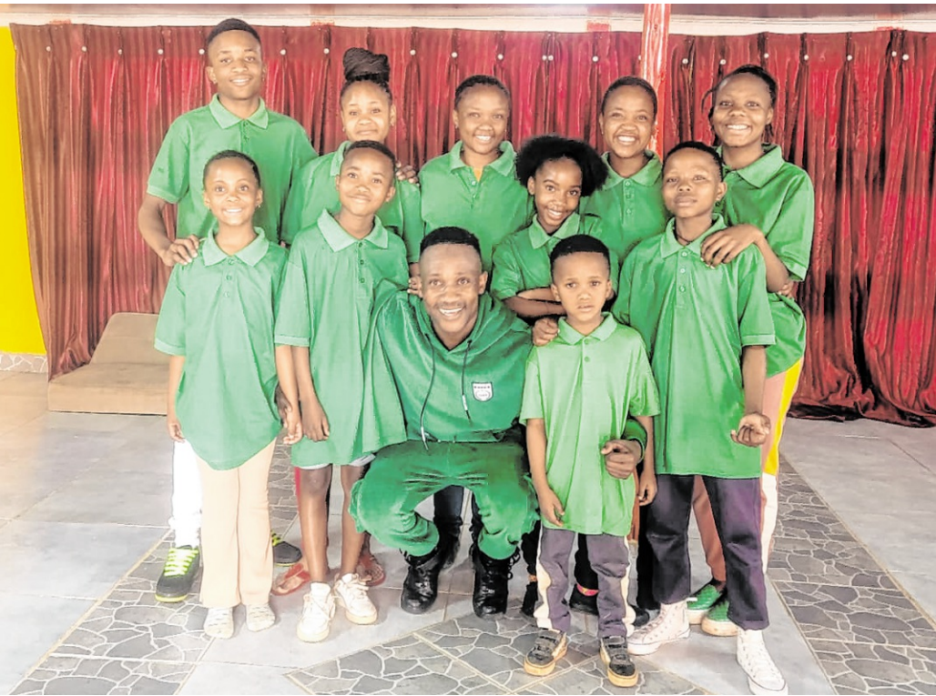
Neun Kinder und Jugendliche aus dem südafrikanischen Ratanda kommen im Rahmen des Projekts „WOZA NAWE“ nach Heidelberg.