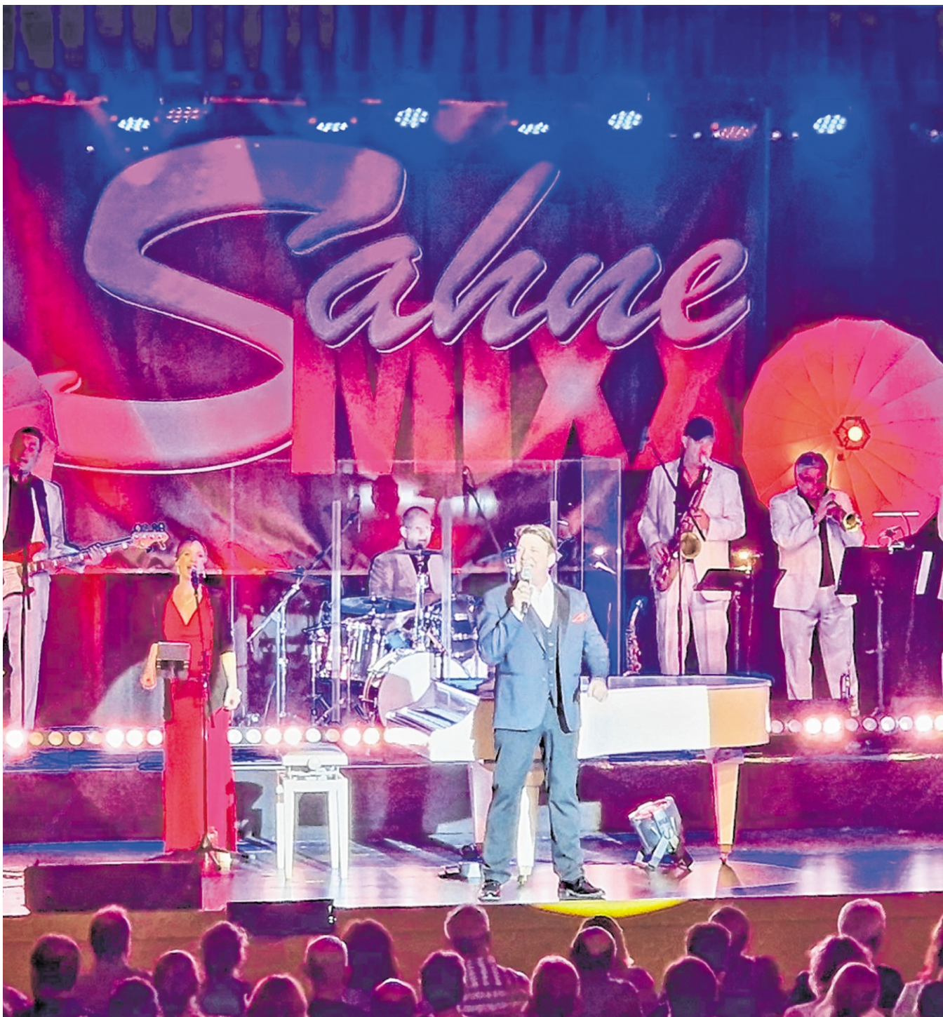
Am 17. Januar 2026 bringen „SahneMixx“ die großen Klassiker des Ausnahmekünstlers nach Eberbach in die Stadthalle.