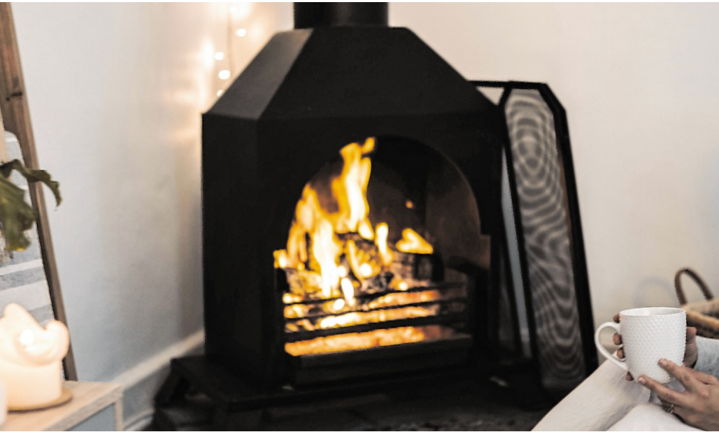
Im rund 90-minütigen Online-Kurs lernen Besitzerinnen und Besitzer von Holzöfen, ihre Feuerstätten effizient und umweltfreundlich zu betreiben. BILD: PEXELS

Deshalb bietet die Stadt Heidelberg in Kooperation mit der E-Learning-Plattform ofenakademie.de Besitzerinnen und Besitzern von Holzöfen seit Dezember 2024 eine kostenlose Teilnahme am „Ofenführerschein“ an. Im rund 90-minütigen Online-Kurs lernen Besitzerinnen und Besitzer von Holzöfen, ihre Feuerstätten effizient und umweltfreundlich zu be-