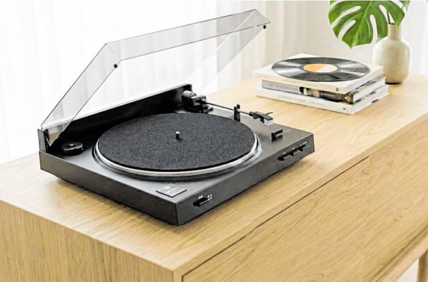
Dual DT 210 USB (Vollautomat)