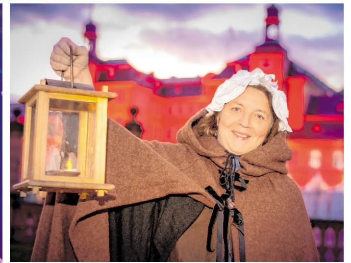
Die „Führung durch das winterliche Schwetzingen“ entführt Interessierte in die Geschichte Schwetzingens.

i Karten in Eberbach bei der Buchhandlung Greif, Telefon 06271/ 25 54, sowie in allen bekannten Vorverkaufsstellen, oder online unter www.kultopolis.com