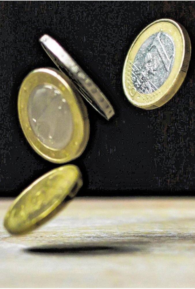
Die Projekte leisten wichtige Beiträge, um Menschen in unterschiedlichen Lebenslagen zu unterstützen

Auch im Bereich der Seniorenarbeit setzt der Kreis wichtige Impulse: Das Projekt „Alt und jung – Gemeinsam stark“ arbeitet gemeinsam mit Mehrgenerationenhäusern (in Weinheim