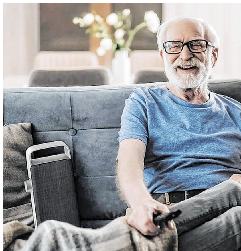
Bilder: SONORO AUDIO GMBH