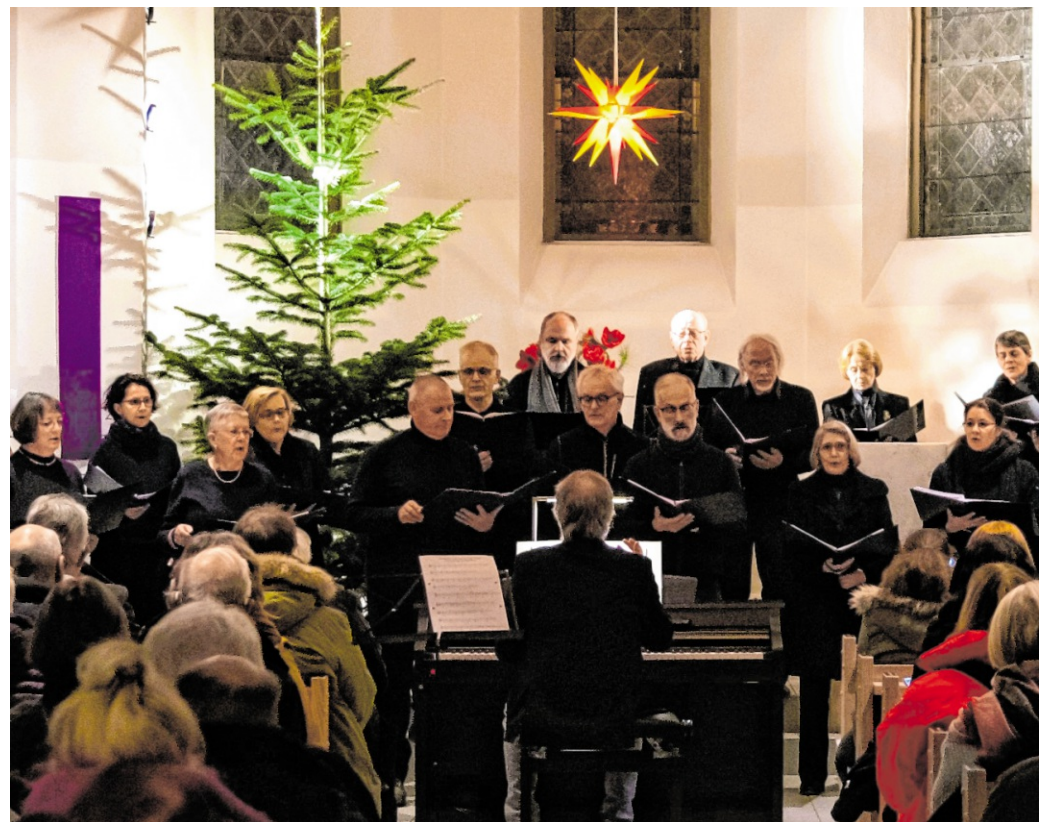
Die adventliche Musik lädt dazu ein, in der Mitte der Adventszeit bewusst innezuhalten.

„Die Förderung des Landes ist für uns eine riesige Chance. Damit können wir das Engagement der vielen Ehrenamtlichen weiterentwickeln und mit professioneller Unterstützung kombinieren. Die Drehscheibe 2.0 wird ein Ort sein, an dem man sich einander begegnet, wo Hilfe ankommt und neue Ideen für das Zusammenleben entstehen.“ red