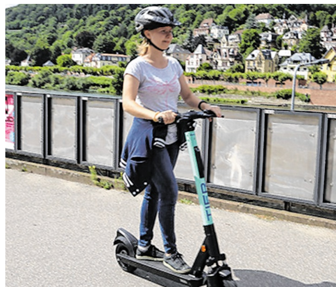
Künftig wird das Aufstellen von E-Tretrollern in Heidelberg ausschließlich auf Grundlage einer sogenannten straßenrechtlichen Sondernutzungserlaubnis gestattet