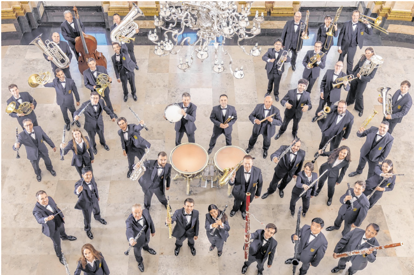
Spielt für den guten Zweck: das Landespolizei Orchester Baden-Württemberg.