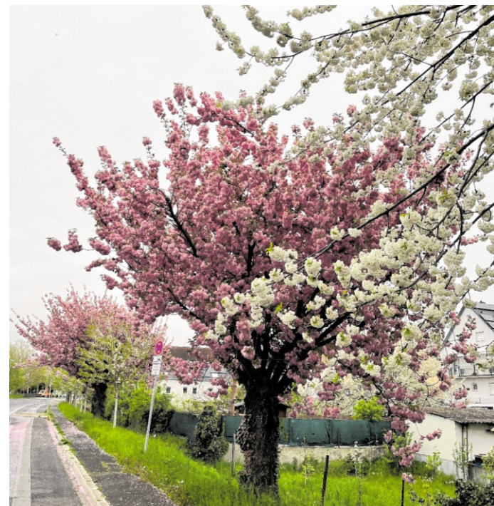
Die Technischen Betriebe Leimen haben im Stadtgebiet eine umfangreiche Frühlingsbepflanzung umgesetzt.

Leimen. Die Gärtnerei der Technischen Betriebe Leimen hat auch in diesem Jahr eine umfangreiche Pflanzaktion im gesamten Stadtgebiet umgesetzt und sorgt damit für einen farnefrohen Start in den Frühling. Mit rot und weiß blühenden Tulpen sowie weiß und gelb blühenden Narzissen wird das Stadtbild nachhaltig verschönert und der Frühling sichtbar willkommen geheißen. Die Blühflächen sind über das gesamte Stadtgebiet verteilt und setzen an zahlreichen Standorten farbliche Akzente. Dazu zählen die K 1455 zwischen Leimen und St. Ilgen, die Rohrbacher Straße, der Kreisell „Schwarze Brücke“, der Parkplatz des S-Bahnhofs St. Ilgen sowie der Kreisell Stralsunder Ring. Besonders in den Morgen- und Abendstunden entfalten die sorgfältig arrangierten Pflanzungen ihre volle Wirkung