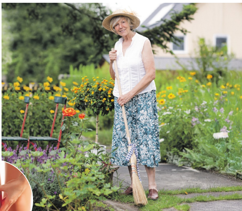
Allein in Deutschland leiden rund 20 Millionen Menschen unter rheumatischen Erkrankungen. Diese zählen zu den häufigsten Ursachen für Gelenkschmerzen.