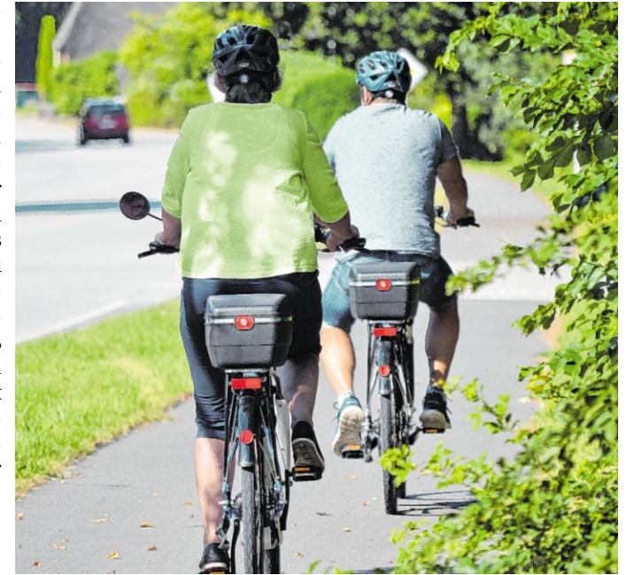
Die Stadt Heidelberg beteiligt sich an der Kampagne Stadtradeln. Die Aktion läuft vom 8. Juni bis 28. Juni.

Beim Stadtradeln nehmen die Teilnehmer in Teams teil: Sie können sich entweder über die Webseite unter www.stadtradeln.de/ oder direkt in der Stadtradeln-App registrieren. Anschließend besteht die Möglichkeit, einem bestehenden Team beizutreten oder ein eigenes Team zu gründen. Alle mit dem Fahrrad zurückgelegten Strecken – etwa zur Arbeit, zur Schule, in den Kindergarten, zum Einkaufen oder bei Ausflügen – können dabei berücksichtigt werden. Auch Fahrten außerhalb des Stadtgebiets fließen in die Kilometerwertung ein. Die Strecken lassen sich entweder manuell eintragen oder automatisch über GPS-fähige Geräte erfassen. Weitere Informationen sowie das Anmeldeformular sind online unter www.stadtradeln.de/heidelberg verfügbar.