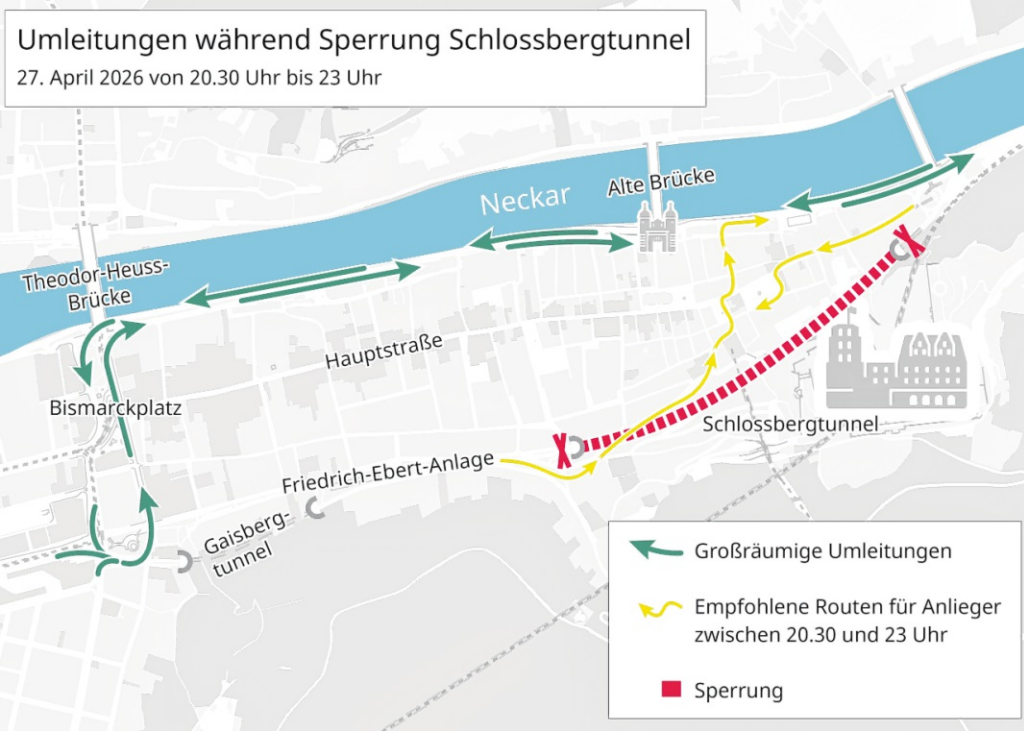
Der Schlossbergtunnel wird am Montag, 27. April, in der Zeit von 20.30 bis 23 Uhr für den Verkehr gesperrt – die großräumige Umfahrung führt entlang der B 37 (Neckarstaden).