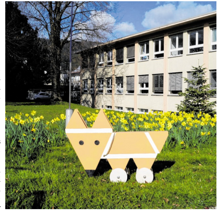
Für das Wiedererkennungszeichen und den Botschafter für Klimaschutz und Klimaanpassung werden bis zum 23. Mai Namensvorschläge gesucht.

Seit 2010 ist Heidelberg bereits zum sechsten Mal als Fairtrade Town zertifiziert und engagiert sich aktiv für eine gerechtere Weltwirtschaft. red