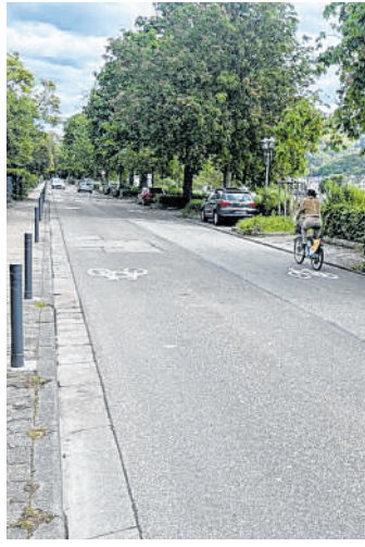
Verkehr: In der Uferstraße in Neuenheim dürfen Radfahrende nun auch in beiden Richtungen auf der Straße fahren.