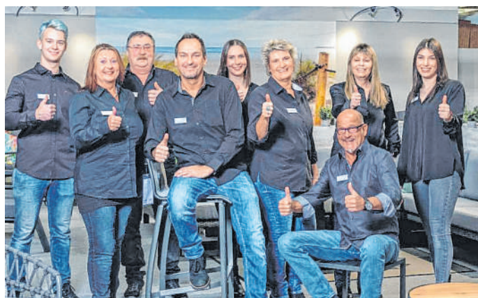
Das Team von Gartenmöbel-Bacz: Gute Beratung und ein hervorragender Service sind garantiert. Bei Bacz freuen sich alle auf viele interessierte Besucher.