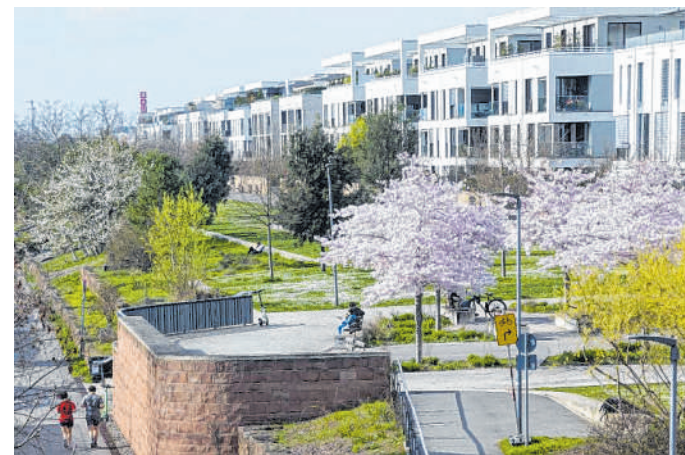
Mit dem Bau neuer Stadtviertel wie der Bahnstadt hat Heidelberg neuen Wohnraum für Familien und junge Menschen geschaffen: Mit 30 Jahren ist das Durchschnittsalter der Bahnstadt im Vergleich zur Gesamtstadt sehr niedrig. In ganz Heidelberg sind die Menschen durchschnittlich etwa zehn Jahre älter.

Heidelberg ist bereits heute als eine der jüngsten Städte Deutschlands bekannt. Von 44 Land- und Stadtkreisen Baden-Württembergs besitzt die Studentenstadt die durch-