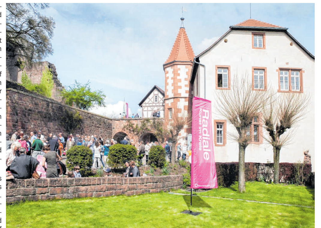
Die nächste Radiale öffnet ihre Pforten im Frühjahr 2025: Ortsspezifische Ausstellungskonzeptionen an mehreren Orten im Landkreis prägen das Ausstellungskonzept.