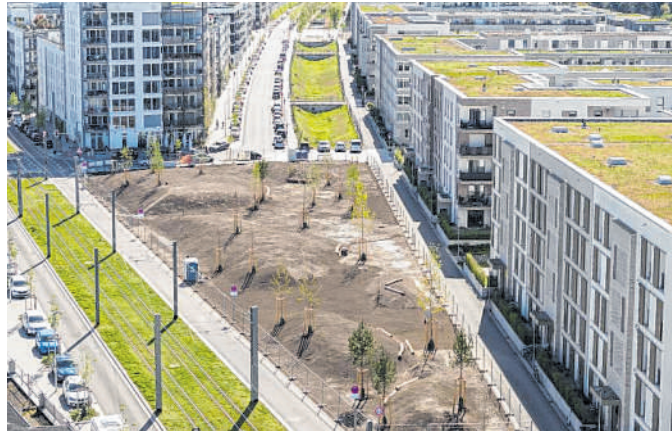
Knapp 30 Bäume wurzeln am Spitzen Eck: dem neuen naturnah angelegten Erholungsort am Langen Anger.