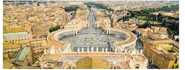
Vatikan: Die EEB Heidelberg lädt im September zu einer Studienreise nach Rom ein.