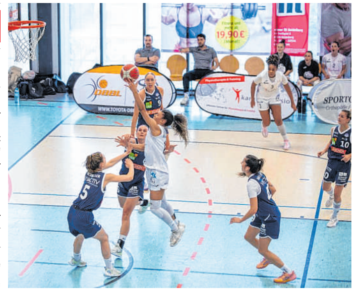
Niederlage: Die BasCats verloren das Viertelfinalrückspiel gegen die VfL VIACATIV AstroLadies Bochum klar.

Besuchen Sie unsere MEGA-Ausstellung mit den Marken: Carthago - Knaus - Weinsberg - Tabbert Hobby - Chausson - LMC - VW-California Vanastro. sonntags freie Umschau. Neue Adresse: Ketzlerweg 3 67105 Schifferstadt www.rikis.de info@rikis.de 06235/449010 rikis Wohnmobile und Wohnwagen Privat sucht Wohnmobil oder Wohnwagen von privat. TEL.: 01701564007 Wir kaufen Wohnmobile+Wohnwagen Tel.03944-36160-www.wm-aw.de+Fa