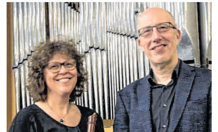
Freitagskonzert: Am 17. Mai gibt es Orgel- und Flötenmusik in der Kirchengemeinde St. Johannes Neckargemünd

Der Eintritt ist frei, am Ausgang wird um eine Kollekte zu Gunsten der Orgel gebeten.