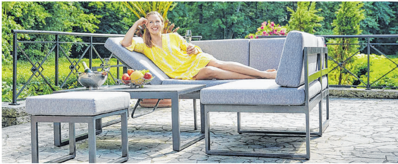
Zuhause den Sommer genießen: Mit geschmackvollen und bequemen Gartenmöbeln von Bacz.