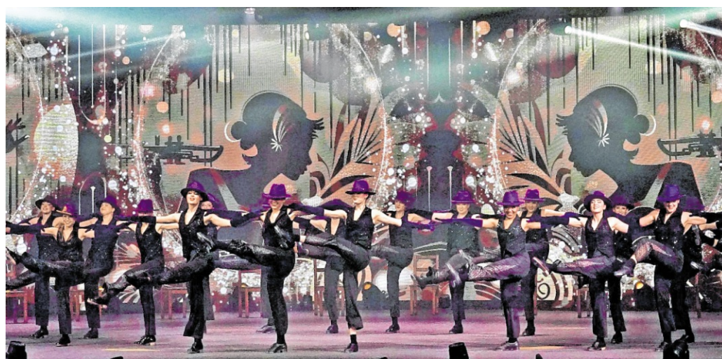
Die Show „US AGAIN“ der Penguin Tappers begeisterte im Januar bei vier ausverkauften Vorstellungen insgesamt 4.400 Besucher.

Mit vielen Filmkameras aus acht Aufnahmepunkten produzierten Ralph und Uschi Lache einen Videofilm, den sie nach