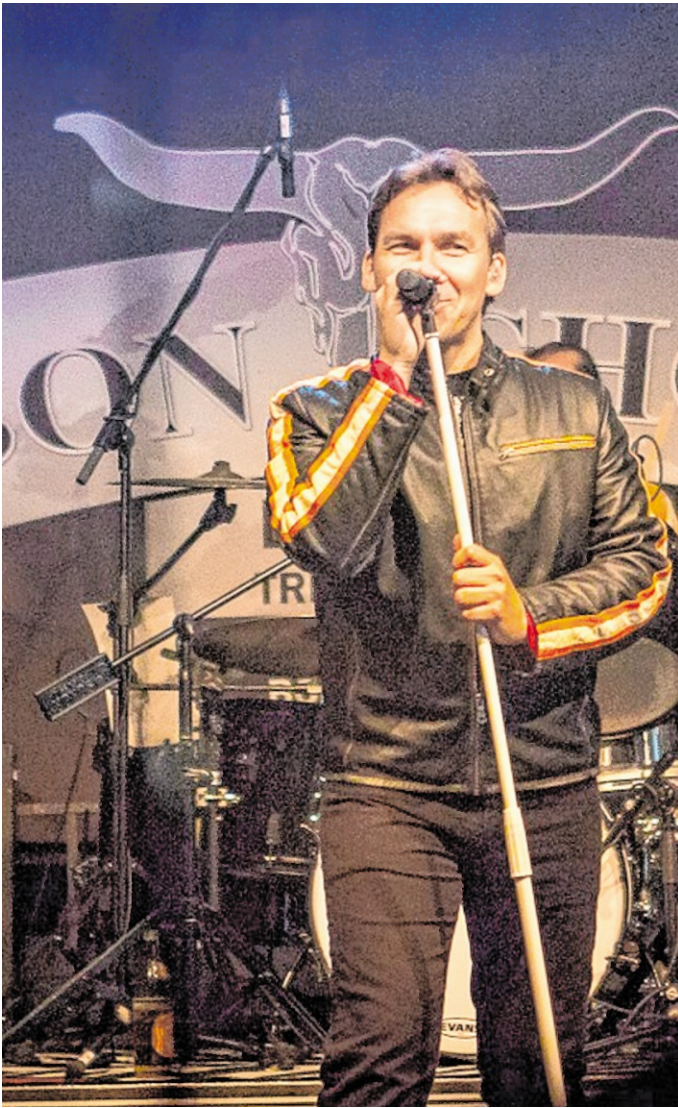
Rund ein Dutzend Bands, Chöre und Gruppen gestalten das größte Open-Air-Konzert der Bergstraße. Mit dabei ist auch wieder Bonshow, die Bon Jovi-Coverband.