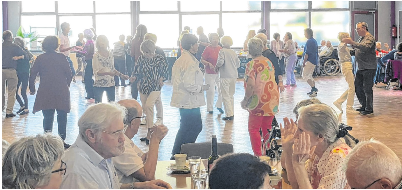
Die beliebte Weinheimer Veranstaltung bringt Generationen zusammen und unterstützt diesmal die DRK-Tagespflege.