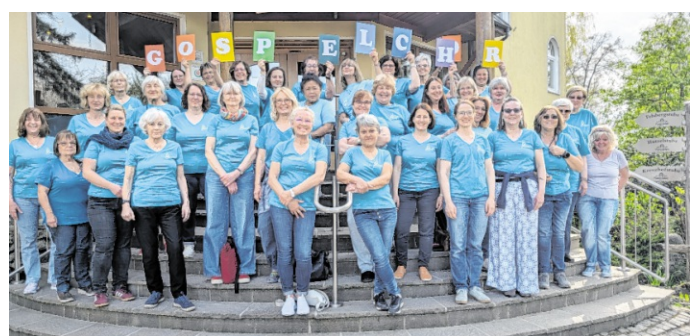
Beim Probenwochenende in Lautertal bereitete sich der Frauenchor des Gospelchors Hemsbach auf die bevorstehenden Konzerte im Juni vor.

Dieser Film feiert am Sonntag, 3. Mai, ab 10 Uhr im Modernen Theater Kino in Weinheim in Zusammenarbeit mit dem Förderverein und Kinochef Dominic Speiser Premiere. Eine weitere Vorstellung ist bereits für den 17. Mai, ebenfalls ab 10 Uhr, terminiert. Der Eintritt kostet sieben Euro. Vorverkauf und Kartenreservierungen sind unter der Telefonnummer 06201/ 6 21 55 oder persönlich im Kino möglich. red