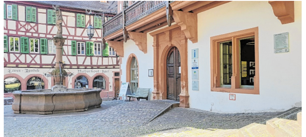
Am Marktplatzbrunnen vor dem Alten Rathaus in Weinheim startet die Themenführung „Am Brunnen gelauscht – Lustiges, Listiges und Skandalöses“.

Wer noch Interesse hat, kann sich bis Dienstag, 5. Mai, per E-Mail unter stellakirgiane@aol.com oder unter der Telefonnummer 0171/ 5 77 88 58 anmelden.