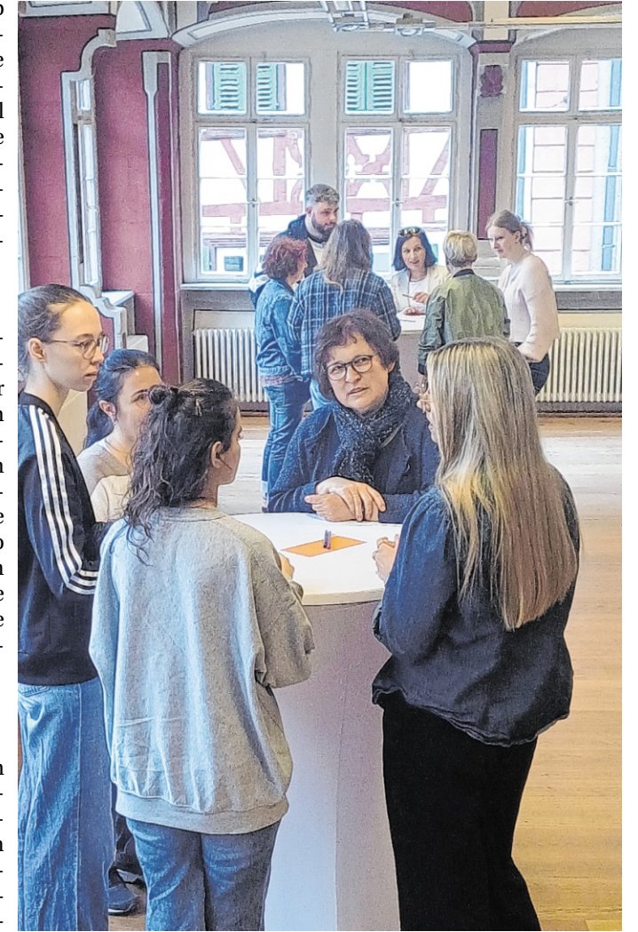
In Weinheim können Auszubildende im pädagogischen Bereich an einem qualifizierten Schulungs- und Workshop-Programm teilnehmen. Bei einem Seminar im Alten Rathaus stand der Austausch zwischen Auszubildenden und Fachkräften aus den Einrichtungen im Mittelpunkt.

Fast vier Stunden lang begegneten sich die erfahrenen und angehenden Fachkräfte intensiv, lernten einander besser zu verstehen und miteinander zu reden, statt nur zu vermuten. „Solche Projekte machen unse-