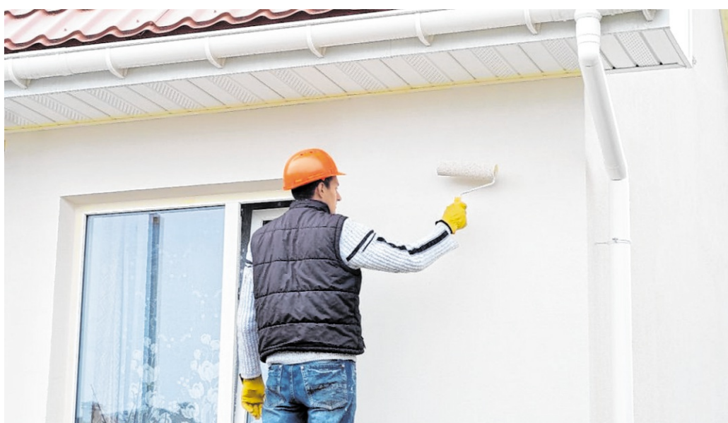
Die Fassade ist die Visitenkarte des Eigenheims. Ein frischer Anstrich wertet die Optik auf und schützt zugleich die Bausubstanz.