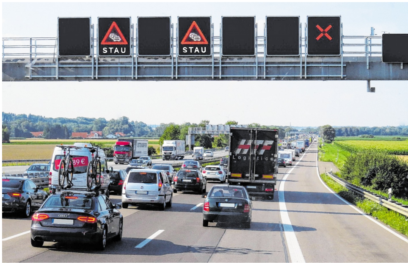
Es wird viel auf den Autobahnen der Region gebaut. Das könnte zu Staus führen.

Auch an dieser Stelle bekommt die Autobahn eine Fahrbahnsanierung. Die Details sind aber noch nicht genau geplant. Gebaut wird voraussichtlich Ende des Jahres sein. bjz