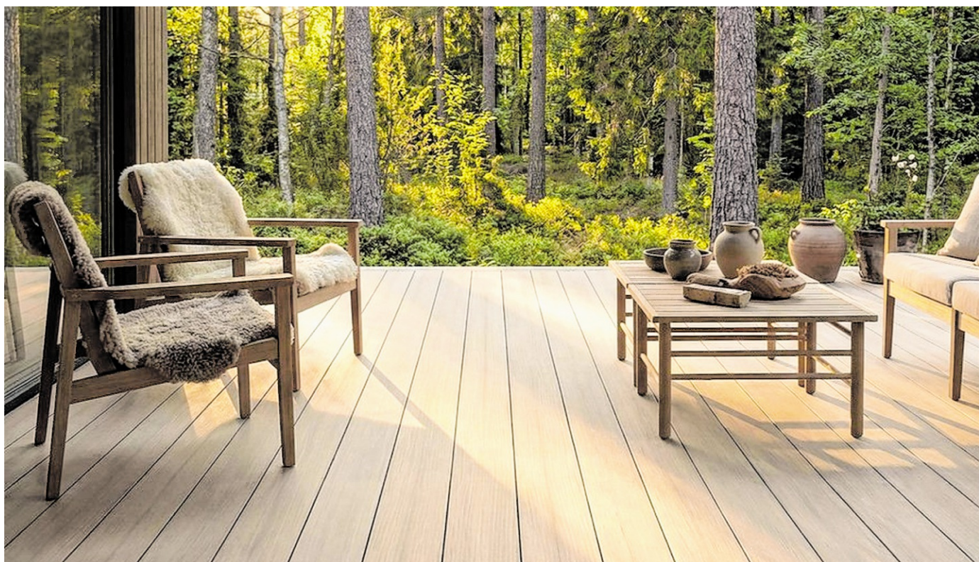
Warme Oberflächen und natürliche Töne lassen die Stimmung des Waldes näher an die Terrasse rücken.