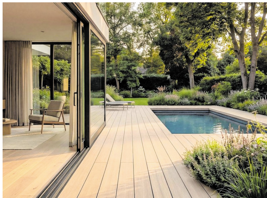
So ästhetisch wie Holz, dabei aber pflegeleicht und langlebig: Holzverbundwerkstoffe ermöglichen eine hochwertige Terrassengestaltung und eignen sich auch als Pooleinfassung