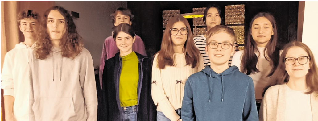
Neue Köpfe, neue Ideen, neue Energie: Der Weinheimer Jugendgemeinderat stellt sich neu auf und macht klar, dass die Jugend künftig eine stärkere Stimme in der Stadt haben will.