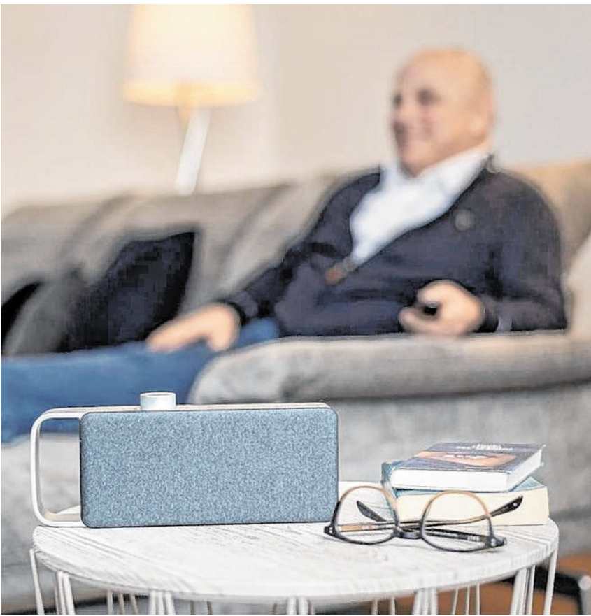
Ob auf dem Beistelltisch oder direkt neben einem platziert – OSKAR bringt immer den sprachoptimierten Fernsehton direkt zu einem an den Sitzplatz.