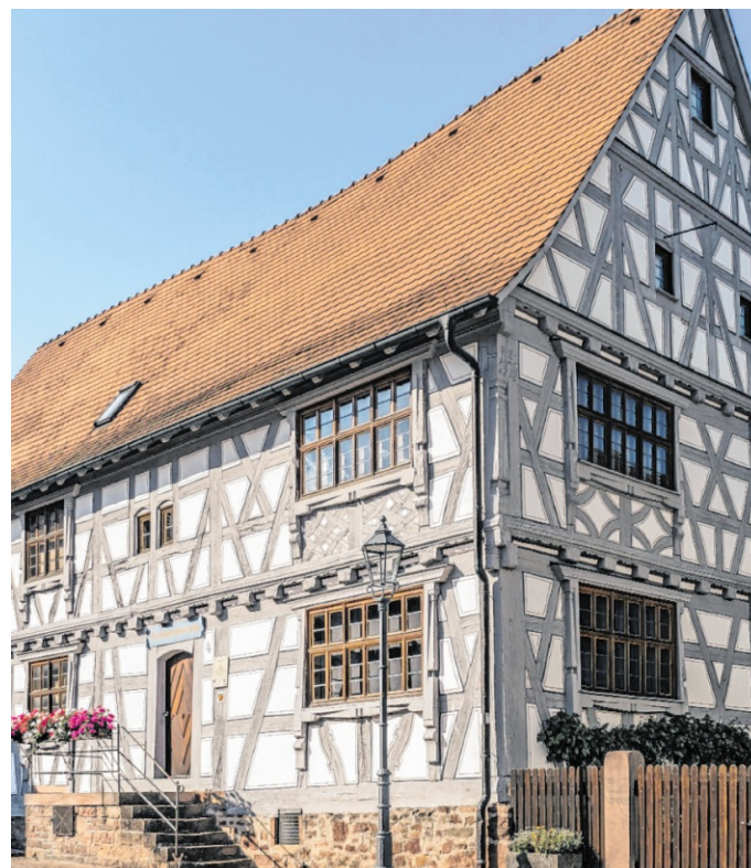
Das Museum spiegelt Leben und Arbeiten einer Bauernfamilie um 1900 detailgetreu wider.

Entstanden ist ein wunderbares Museum mit Hof, Scheune und Schmiede, welches das Leben und Arbeiten einer Bauernfamilie um 1900 detailgetreu widerspiegelt. Im Jahr 1990 erhielt das Heimatmuseum Ep-