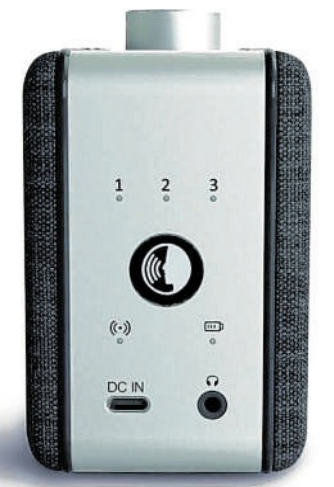
Für ungestörten Fernsehgenuss kann OSKAR mit Kopfhörern verwendet werden.

Mit OSKAR, dem tragbaren TV-Hörverstärker von faller, können Sie endlich wieder jedes Wort klar und deutlich verstehen. Die innovative Technologie hebt die Stimmen hervor und filtert störende Geräusche, sodass Sie Ihre Lieblingssendungen in bester Klangqualität genießen können. OSKAR ist kinderleicht in nur drei Schritten startklar: anschließen, einschalten und losgeht's. Den innovativen Helfer gibt es im MeinMorgen Onlineshop zu erwerben.