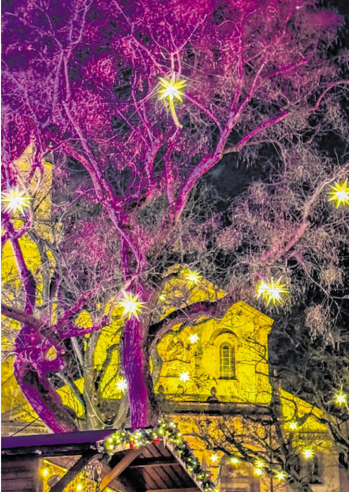
Überall locken warme Lichter, feierliche Klänge und kulinarische Genüsse.

Lützelsachsen/Sulzbach/Weinheim. Der Weihnachtsmarkt auf dem Dorfplatz in Lützelsachsen hat sich längst vom Geheimtipp zu einer festen Attraktion entwickelt, nicht zuletzt durch die Aufwertung mit dem Backhaus. Organisiert wird der Markt vom Weihnachtsmarkt-Team des Vereins „Hier macht was auf“. Als jüngster Weihnachtsmarkt im Reigen der Stadt- und Ortsteile wächst er jedes Jahr weiter: neue Stände und Aktionen bereichern das Angebot stetig. In diesem Jahr findet der Lützelsachsener Weihnachtsmarkt am Sonntag, 14. Dezember, von 14 bis 20 Uhr statt. Besucher können sich auf kulinarische Spezialitäten, regionale Aussteller, eine Tombola sowie ein abwechslungsreiches Musikprogramm aus dem Ort freuen. Ortsvorsteher Christian Lehmann eröffnet den Weihnachtsmarkt um 14.30 Uhr. Um 15.30 Uhr treten die Lützelsinger auf, gefolgt vom Schulchor der Hans-Joachim-Gelberg-Grundschule um 16.30 Uhr. Um 17.30 Uhr begrüßt der Nikolaus die kleinen Gäste, danach sorgt musikalische Unterhaltung für stimmungsvolle Begleitung. Insgesamt 40 Stände präsentieren Kunsthandwerk, Mode, Dekoration, Schmuck, Nährarbeiten, Holz- und Tonarbeiten und vieles mehr – so beliebt ist der Markt, dass es sogar eine Warteliste gibt. Parallel findet am Sonntag, 14. Dezember, in Sulzbach von 14 bis 20 Uhr der Weihnachtsmarkt in der Prinz-Friedrich-Anlage statt. Dort wird der Markt um 14 Uhr von