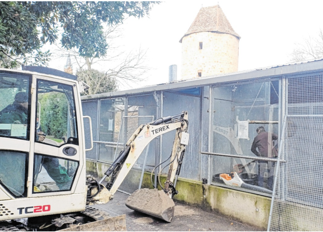
Frischer Sand, neue Teiche und Grünflächen – Weinheims Vögel bekommen ein liebevoll erneuertes Zuhause im Schlosspark.