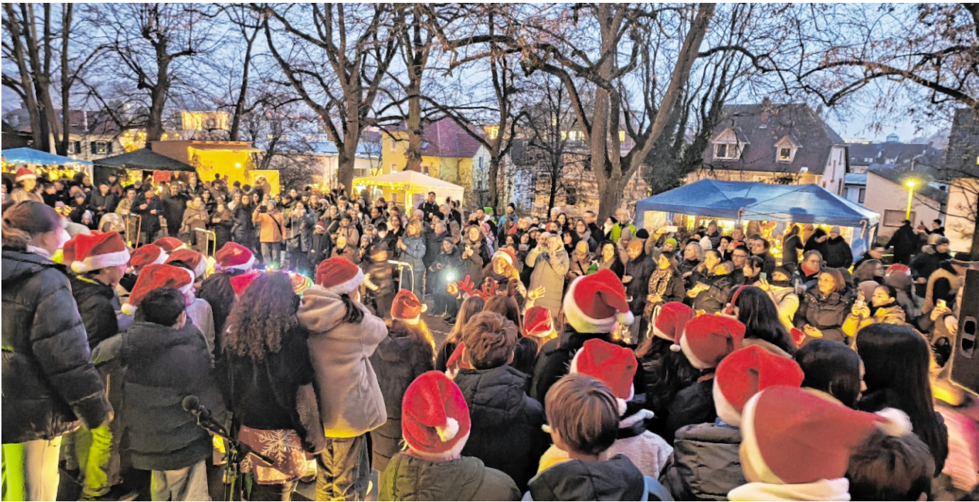
Mit einem großen Schulchor, warmem Lichterglanz und liebevoll dekorierten Ständen bot das Adventsfest der Friedrich-Realschule auch in diesem Jahr eine besonders herzliche Einstimmung auf die Weihnachtszeit.