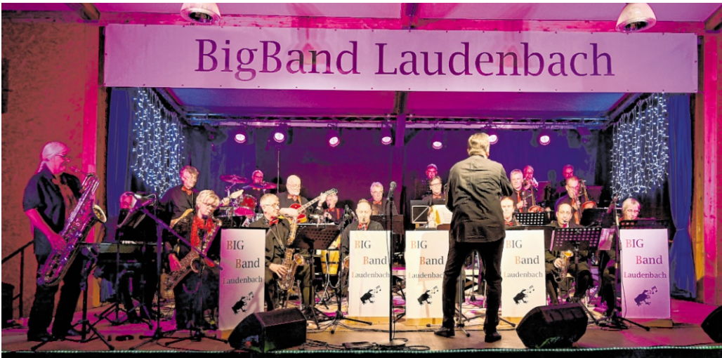
Vier Jahrzehnte Musik, Energie und Leidenschaft – die BigBand Laudenbach verzauberte beim Jubiläumskonzert ihr Publikum.