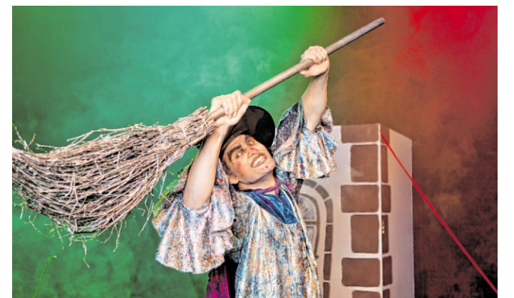
Hänsel und Gretel wird am 16. Dezember aufgeführt.