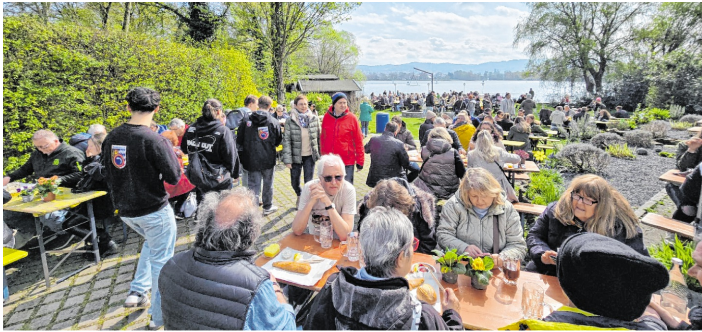
Beim traditionellen Backfischessen des Badisch-Unterländer-Angelsportvereins Weinheim am Waidsee herrschte an Karfreitag großer Besucherandrang. Mehr als 45 ehrenamtliche Helfer versorgten die Gäste bei Osterwetter mit Backfisch und weiteren Speisen.