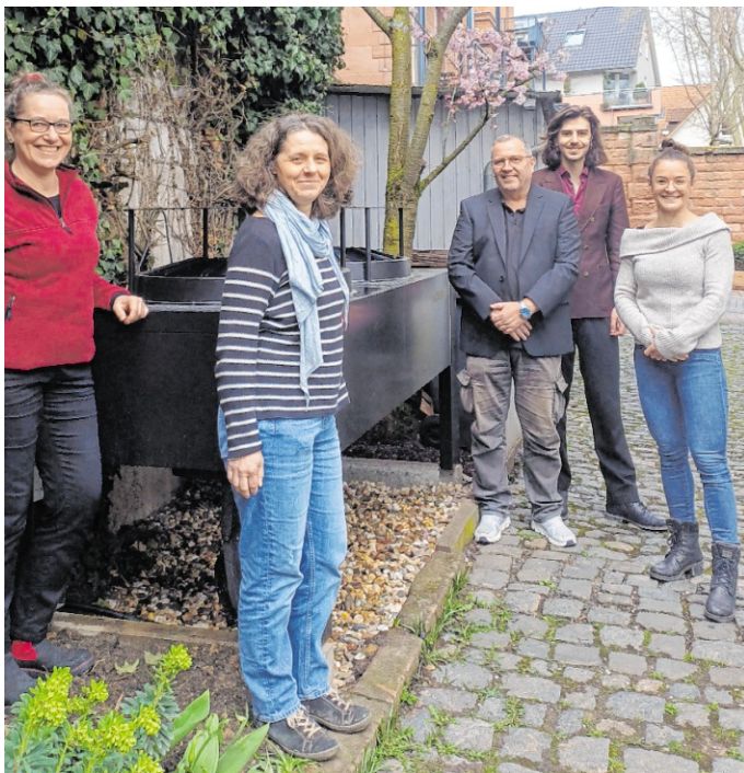
Wie heizen wir morgen? Das Klimaschutzteam der Stadt Weinheim liefert Antworten – praxisnah, verständlich und direkt vor Ort bei „Weinheim heizt vor!“.

Weinheim. Wie ein Haus oder eine Wohnung künftig in Anbetracht knapper, teurer und absehbar nicht mehr zulässiger fossiler Brennstoffe beheizt werden kann, beschäftigt derzeit viele Haus- und Wohnungsbesitzer. Solardächer, Wärmepumpen, Geothermie und individuelle Lösungen werfen viele Fragen auf. Antworten gibt es bei einer Veranstaltung der Stadt Weinheim am Dienstag, 21. April, in der Weinheimer Stadthalle von 16 Uhr bis 20.30 Uhr. Unter dem Motto „Weinheim heizt vor!“ ist die mehrstündige Informationsveranstaltung bei freiem Eintritt und Sonderangeboten eine Mischung aus Vortragsveranstaltung und Handwerkermesse.