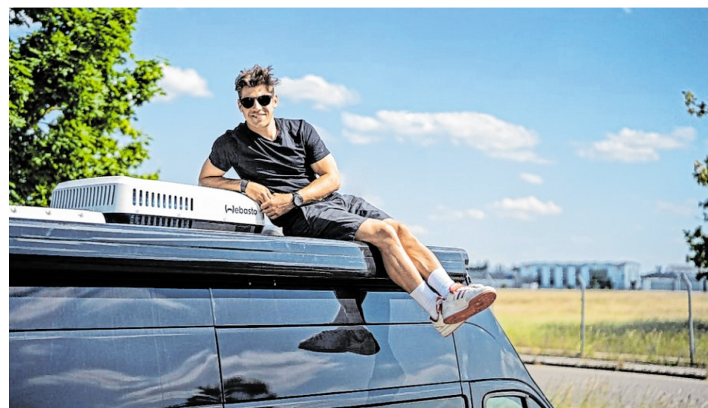
Auch Motorradrennfahrer Marcel Schrötter ist überzeugt: Alles Gute kommt von oben – vor allem die frische und kühle Luft im Wohnmobil durch eine Aufdachklimaanlage.

mageräte mit Invertertechnologie und variablem Kompressor. Vorteil: Dadurch lässt sich die Kühlleistung stufenlos steuern. „Herkömmliche Geräte steuern ihre Kühlleistung darüber, dass sie entweder angeschaltet sind und kühlen oder abgeschaltet sind. Ein Inverter-Kompressor hingegen läuft kontinuierlich, aber mit variabler Leistung. Das spart Energie, reduziert die Lautstärke und vermeidet Stromspitzen beim Einschalten“, erläutert Experte Jörg Faltn. Ein weiterer Aspekt, der beachtet werden sollte, ist die Bauweise des Geräts: Das Gehäuse sollte flach, leicht und dennoch robust sein. Einen praktischen Mehrwert bieten einige Geräte mit nützlichen wählbaren Modi wie Entfeuchtungs-, Timer- oder Schlaffunktion. Hilfreich ist zudem, wenn sich die Luftverteilung durch das Einstellen der Lamellen nach Bedarf anpassen lässt. djd