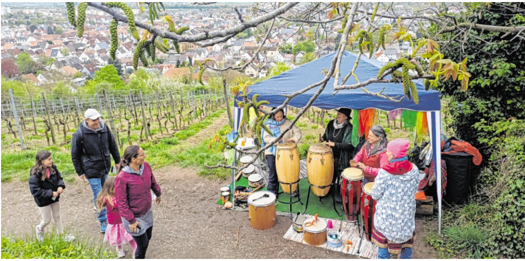
Rund 6000 Menschen waren beim Blütenwegfest an der nördlichen Bergstraße zwischen Sulzbach und Laudenbach unterwegs. Trotz trüben Himmels und kühlen Winds zeigten sich die Organisatoren zufrieden.