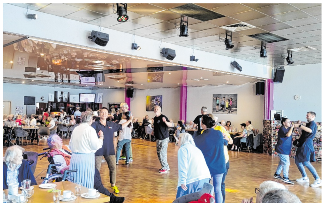
Bei der Veranstaltung „Woinemer KaffeeBall“ stehen Musik, Begegnung und geselliges Beisammensein im Mittelpunkt.