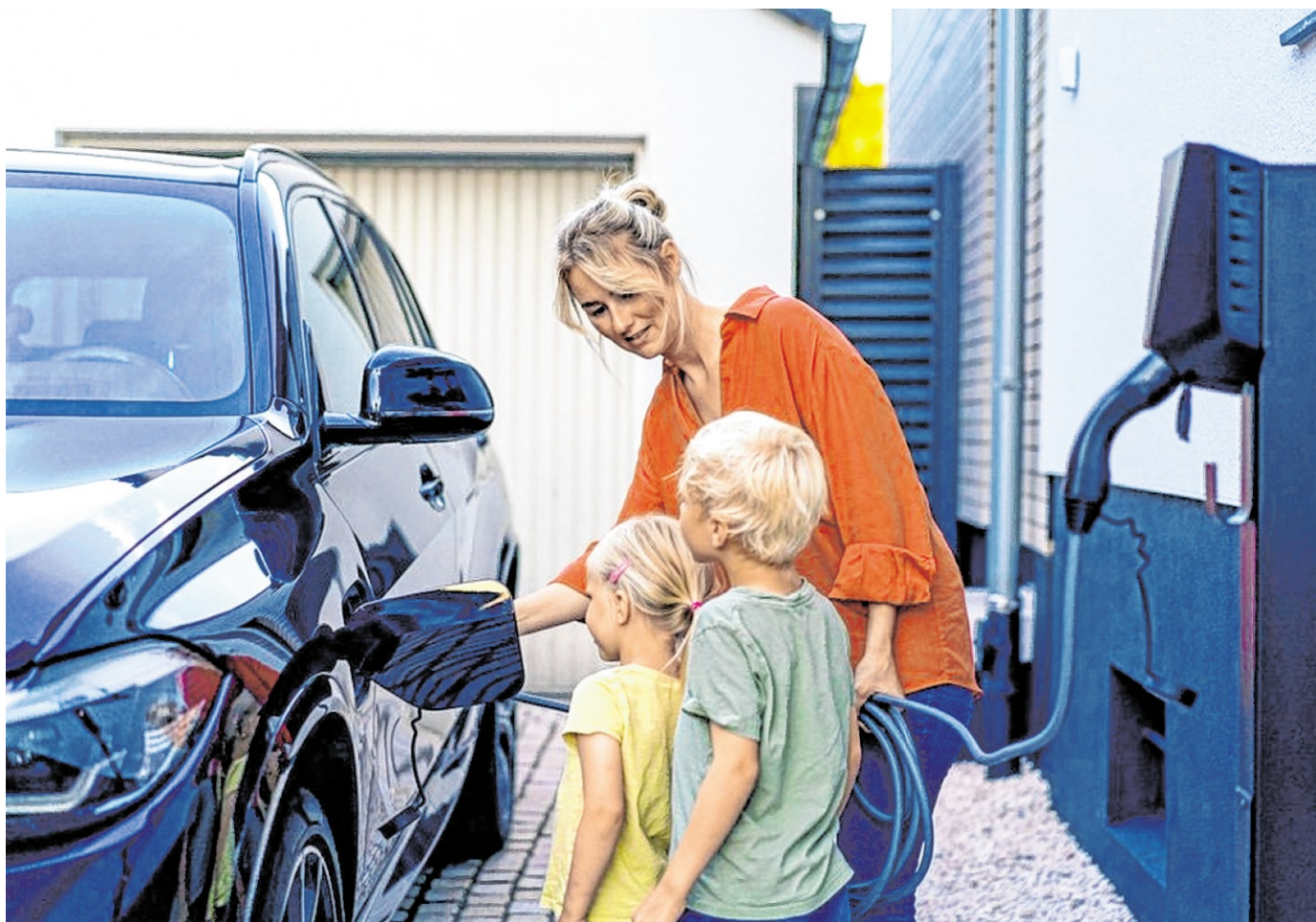
Ein E-Auto als klimafreundlicher Familientransporter? Der Anteil von Kfz mit rein elektrischem Antrieb steigt stetig.