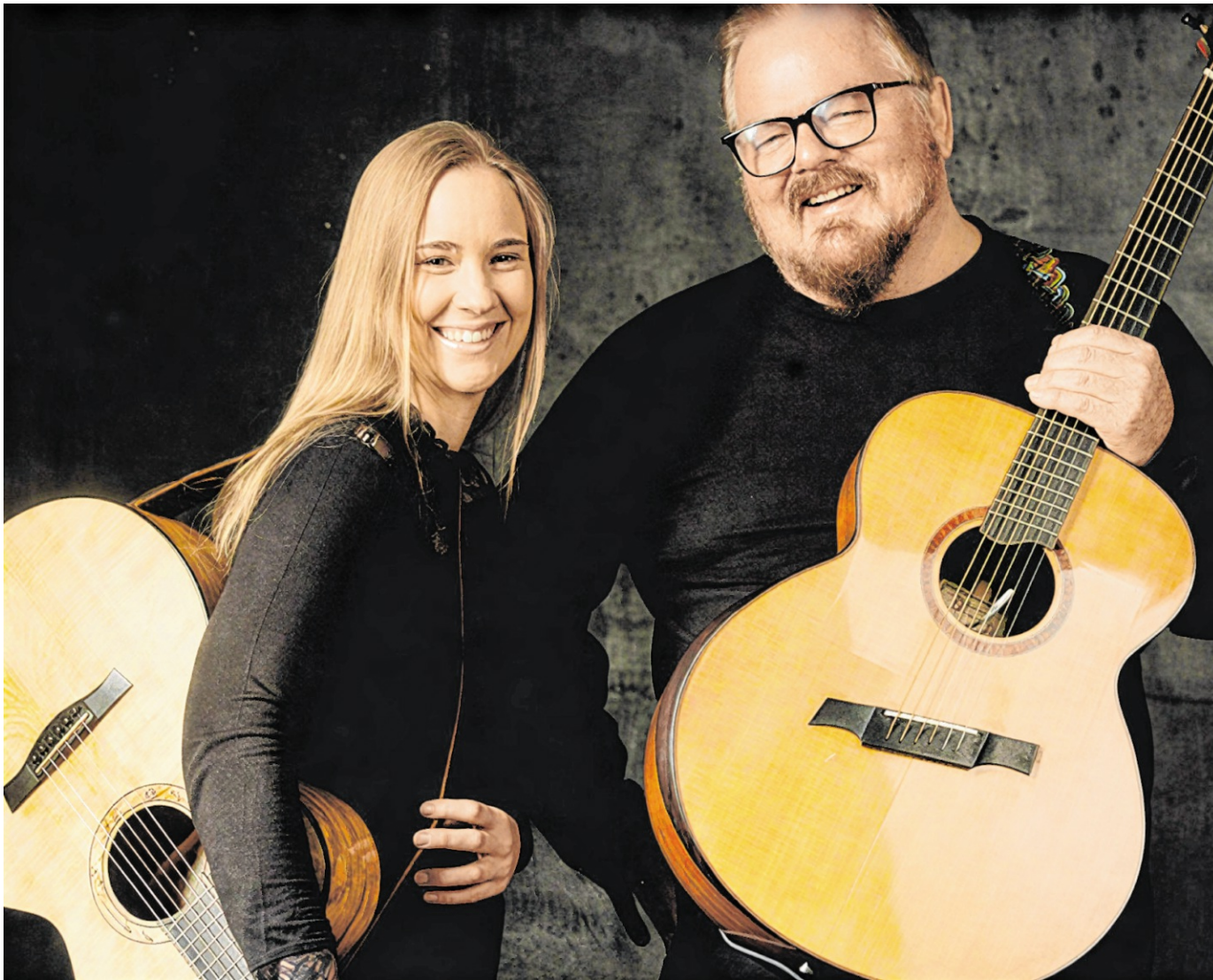
Die Gitarristin und der Musiker stehen für ein Duo-Programm gemeinsam auf der Bühne.