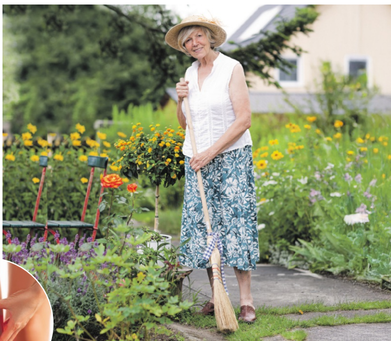
Alein in Deutschland leiden rund 20 Millionen Menschen unter rheumatischen Erkrankungen. Diese zählen zu den häufigsten Ursachen für Gelenkschmerzen.