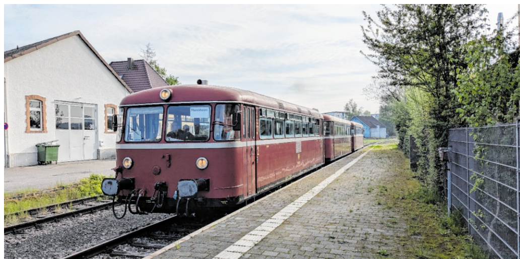
Am Samstag, 25. April, fährt der Schienenbus zwei Mal nach und von Mannheim.

Der Zug hält dazu extra an der Station Mannheim ARENA/Maimarkt, von wo das Maimarktgelände direkt mit dem Bus oder auch zu Fuß erreichbar ist. Nach rund acht Stunden bringt der Schienenbus die Maimarkt-Besucher um 18.24 Uhr ab Mannheim ARENA/Maimarkt wieder ohne Umstieg zurück ins Krebsbachtal. Weitere Unterwegshalte sind in Waibstadt und Meckesheim. Sowohl im Schienenbus als auch in Mannheim gilt das ver-