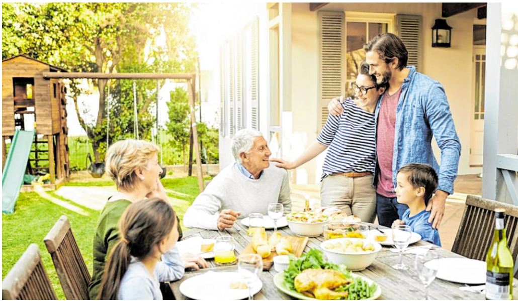
Eltern können Streitigkeiten um das Erbe vermeiden, indem sie klug vorsorgen und ihren Nachlass sorgfältig regeln – organisatorisch wie finanziell.

Eltern können das vermeiden, indem sie klug vorsorgen und ihren Nachlass sorgfältig regeln – organisatorisch wie finanziell. „Dabei ist es wichtig, die unterschiedlichen Freibeträge der Erben zu kennen. Denn geringe Freibeträge und hohe Steuersätze können das Erbe gefährden. Das gilt selbst, wenn Kin-