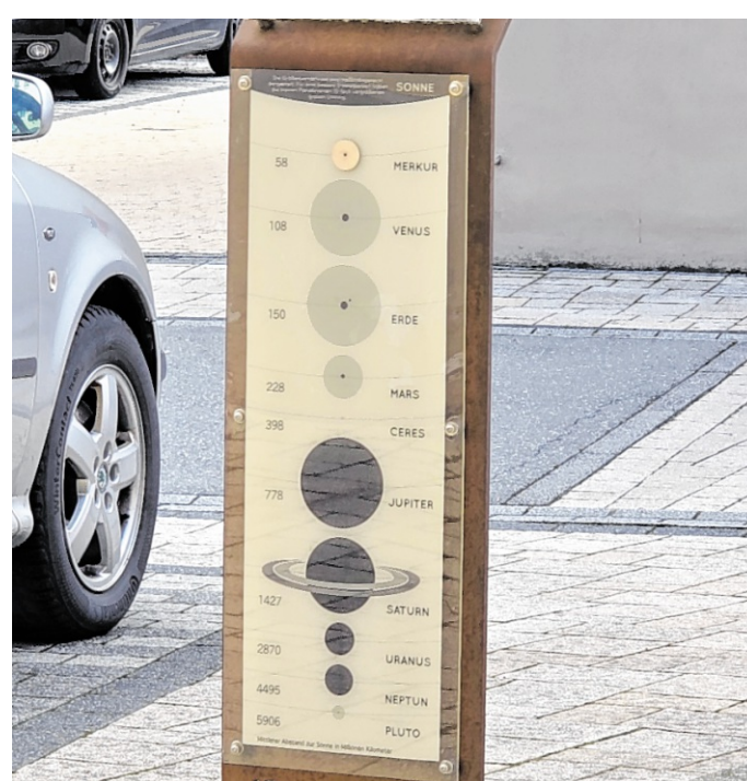
Auf dem Planetenweg in Meckesheim sind insgesamt alle acht Planeten des Sonnensystems sowie die Zwergplaneten Ceres und Pluto vertreten.

Auf dem Weg sind alle acht Planeten unseres Sonnensystems sowie die Zwergplaneten Ceres und Pluto vertreten. Jede Station zeigt anschaulich, wie groß die Planeten wirklich sind – und wie weit sie voneinander entfernt kreisen. So werden die Dimensionen und Abstände un-