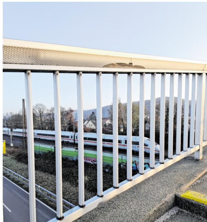
An der Heinebrücke wurden zweimal zehn Leuchtenabdeckungen, die im Handlauf integriert sind, zerstört.