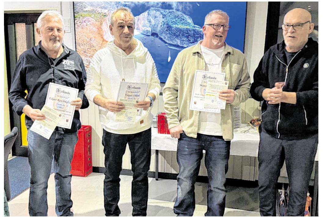
Die Vereinsmeister des Angelvereins Weinheim zeigen jedes Jahr, wer am Waidsee die besten Fänge erzielt hat – Präzision, Geduld und Können werden belohnt.

Besonders hervorzuheben ist die Jugendarbeit des Vereins. Mit über 30 Jugendlichen zeichnet der Angelverein eine sehr positive Entwicklung und stetig steigende Mitgliederzahlen im Nachwuchsbereich. Neben dem Angeln steht dabei auch die Vermittlung von Wissen über Flora und Fauna rund um den Waidsee im Mittelpunkt. Im Anschluss wurde über die finanzielle Lage des Vereins berichtet. Die Kassensprecher bestätigten eine ordnungsgemäße und transparente