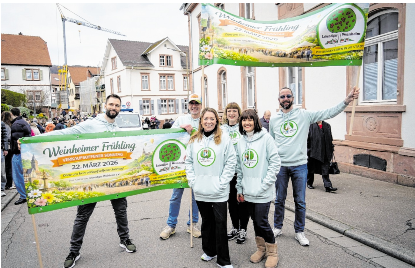
Das Team „Lebendiges Weinheim“ hat gemeinsam mit der Stadtverwaltung das Rahmenprogramm organisiert.

Kurs zum Thema Demenz Lützelsachsen. Am Donnerstag, 26. März, findet um 16 Uhr ein kostenfreier „Demenz Partner“-Kurs im Lützeltreff, Kurpfalzstraße 4 in Lützelsachsen statt. „Demenz Partner“ ist eine Initiative der Deutschen Alzheimer Gesellschaft, die das Ziel verfolgt, Wissen über Demenz zu verbreiten und Menschen für einen offenen und respektvollen Umgang zu sensibilisieren. Der 90-minütige Basiskurs richtet sich an alle Interessierten und an Menschen, die im Alltag mit Demenz in Berührung kommen. Eine Anmeldung ist nicht erforderlich. red