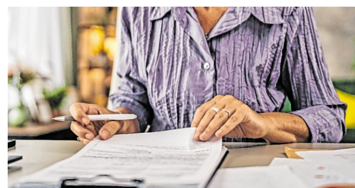
Ein gültiges Testament muss einige formale Anforderungen erfüllen – so muss es beispielsweise handschriftlich ausgefüllt und unterschrieben sein.