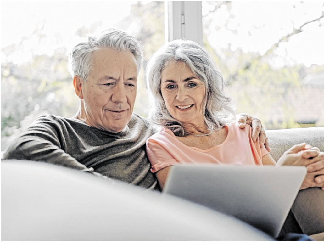
Eine Bestattungsvorsorge ermöglicht es, die Form des Abschieds selbst zu bestimmen und Angehörige gleichzeitig von Entscheidungsdruck sowie finanziellen Unsicherheiten in einer emotional aufwühlenden Zeit zu entlasten.

Je individueller die Vorstellungen, desto wichtiger ist eine frühzeitige Vorsorge. Das gilt insbesondere für alternative Bestattungsformen, die vom klassischen Erd- oder Urnengrab abweichen. Wer sich etwa für neuere Bestattungsformen wie die Anfertigung eines Erinnerungsdiamanten entscheidet, kann bereits zu Lebzeiten De-