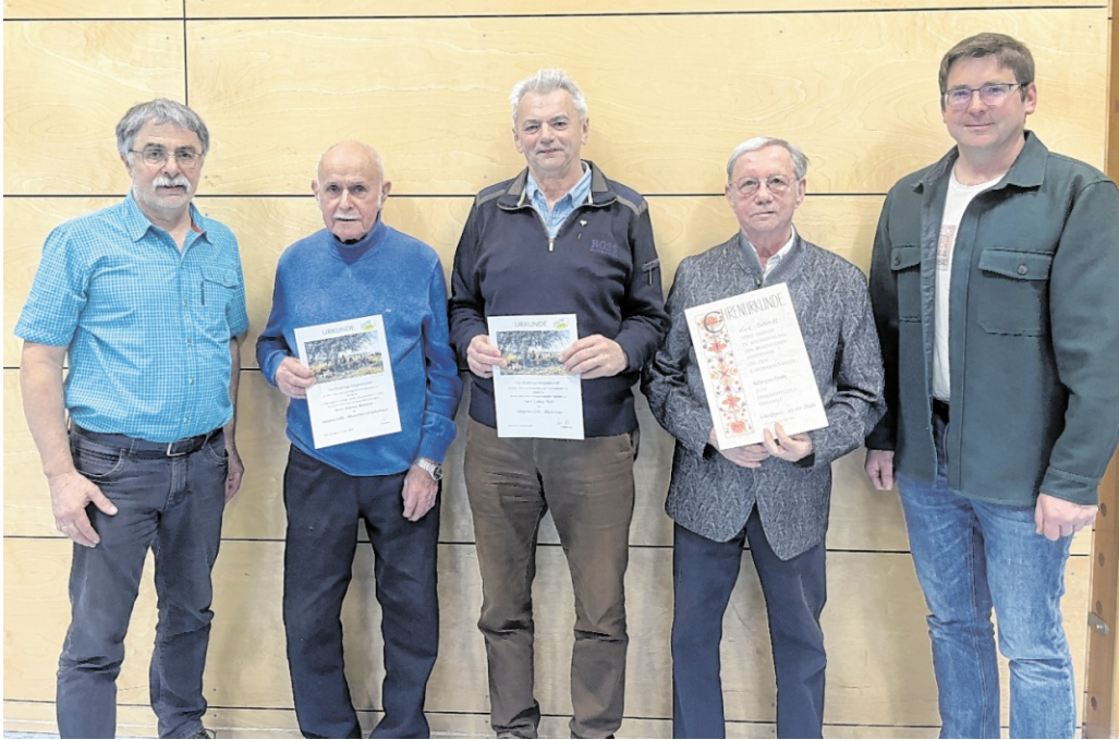
Bei der Jahreshauptversammlung standen die Ehrungen verdienter Mitglieder im Fokus.

Am 29. November folgte der Weihnachtsmarkt. Dort war der