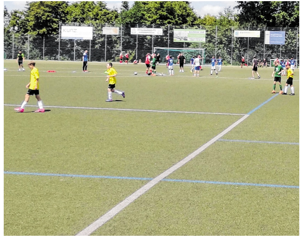
Der Kunstrasenplatz der SG Hohensachsen soll nun nach dem Gemeinderatsbeschluss erneuert werden.

Am Ende durfte sich der BC Hemsbach über eine Gold- und eine Silbermedaille freuen. Entsprechend zufrieden zeigten sich die Trainerinnen und Trainer mit dem Abschneiden ihrer Nachwuchssportlerinnen, die nun mit viel Selbstvertrauen auf die Baden-Württembergischen Landesmeisterschaften im kommenden Monat blicken können.