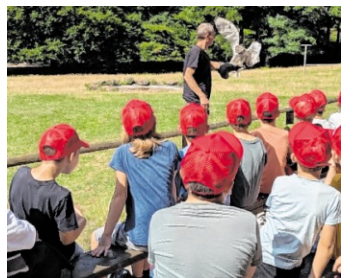
Zehn Tage voller Abenteuer

Hemsbach. Zehn Tage voller Spaß, Spiel und Spannung: Vom 10. bis 21. August finden wieder die beliebten Hemsbacher Ferienspiele statt, zum 47. Mal insgesamt. Das Angebot richtet sich in diesem Jahr an Sechsbis Zwölfjährige. Organisation und Durchführung werden wie gewohnt vom Jugendzentrum Hemsbach übernommen. Ab dem 1. Juni startet die Anmeldung unter https://partner.venuzule.de/stadt-hemsbach/courses/ .