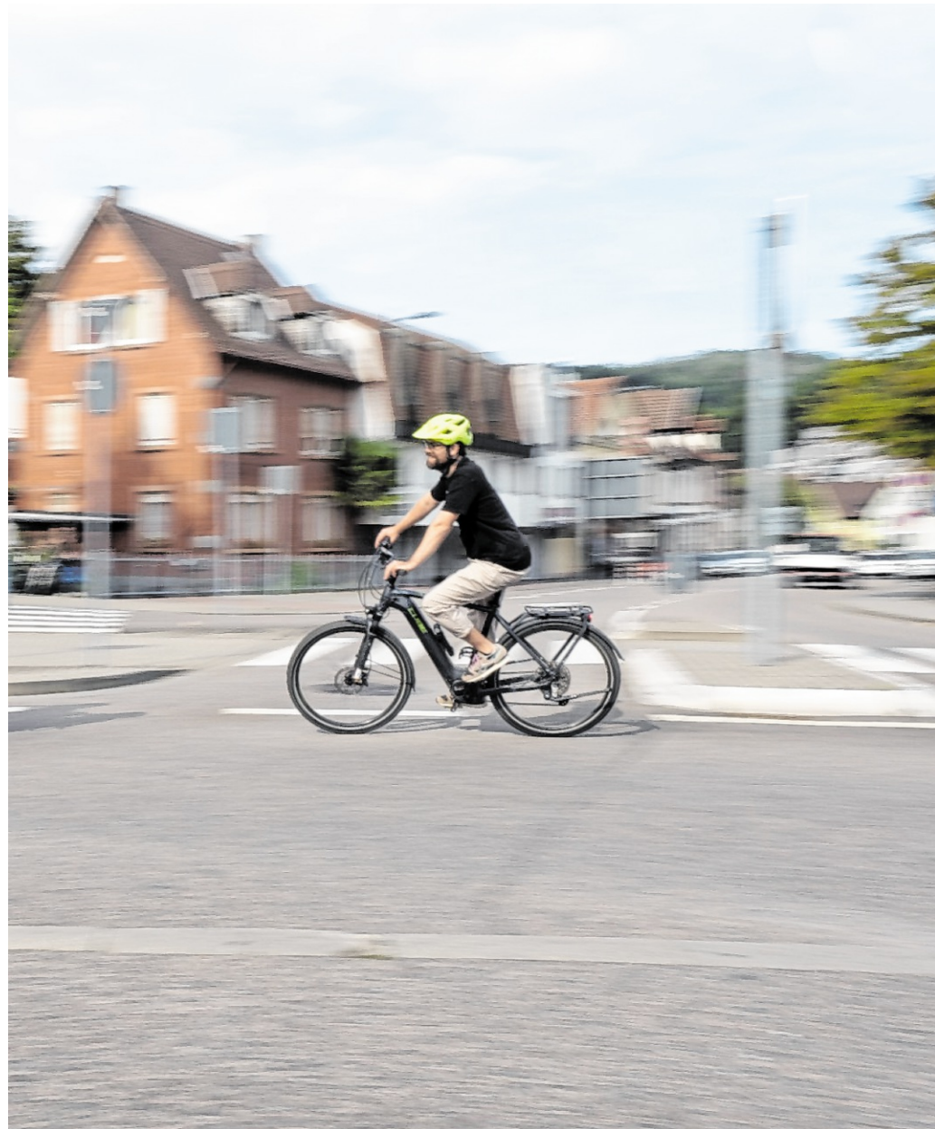
Weinheim beteiligt sich vom 14. Juni bis 4. Juli erneut an der Stadtradeln-Aktion im Rhein-Neckar-Kreis. Die Anmeldung für Stadtradeln in Weinheim ist bereits geöffnet.

i Der Film wird am Mittwoch, 3. Juni, um 20.15 Uhr und am Samstag, 7. Juni, um 17.30 Uhr im Olympia Kino Hirschberg gezeigt.