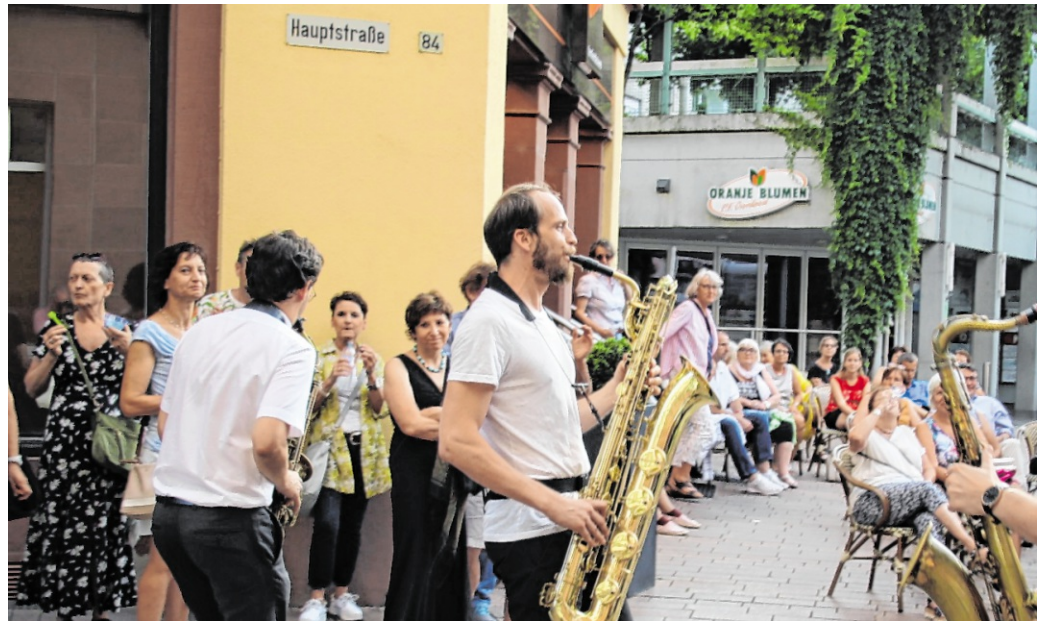
Die „Fête de la Musique“ bringt erstmals in klassischer Form Livemusik auf viele Plätze der Altstadt.