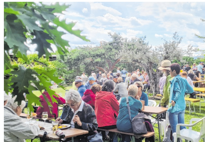
Besucher können bei den offenen Höfen von Station zu Station schlendern

Direkt gegenüber ist das Bio-Weingut Kohl (Hof 4), welches den Garten und Weinverkauf geöffnet hat. Auch wird hier der neue Weinjahrgang präsentiert. Im Garten mit Olivenbaum zwischen Reben und Blick zum Pfälzer Wald ver-