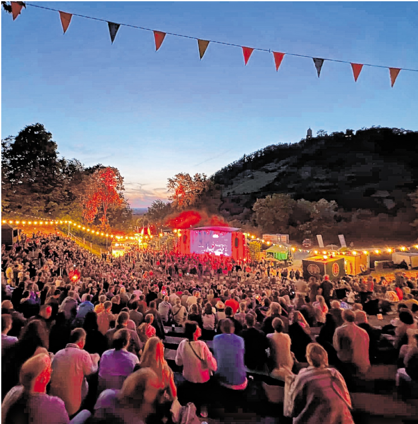
Musik, Magie und Sommerlaune gibt's beim Maiberg Open Air in Heppenheim.