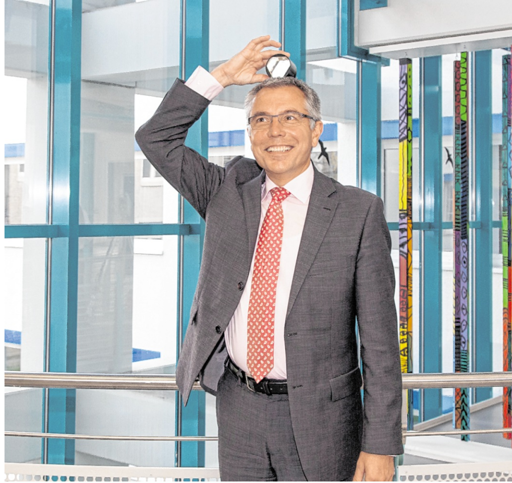
In all den Jahren kam bei allem Ernst auch der Spaß nicht zu kurz, wie dieser Schnappschuss aus dem Jahr 2014 anlässlich des Tags der offenen Tür im Landratsamt Sinsheim zeigt.

Im Bereich der Mobilität hat der Kreis unter Landrat Dallinger seine Rolle als aktiver Gestalter deutlich ausgebaut. Mit der Fortschreibung von Nahverkehrs- und Radverkehrskonzepten, der Einführung neuer Regiobuslinien ab 2019 sowie der kontinuierlichen Förderung