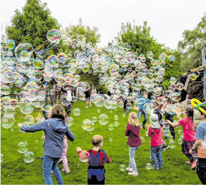
Für Alt und Jung wird gleichermaßen viel geboten beim „Mei Fescht Meckse“ am Samstag, 2. Mai, auf dem Sport- und Schulparkplatz in Meckesheim.