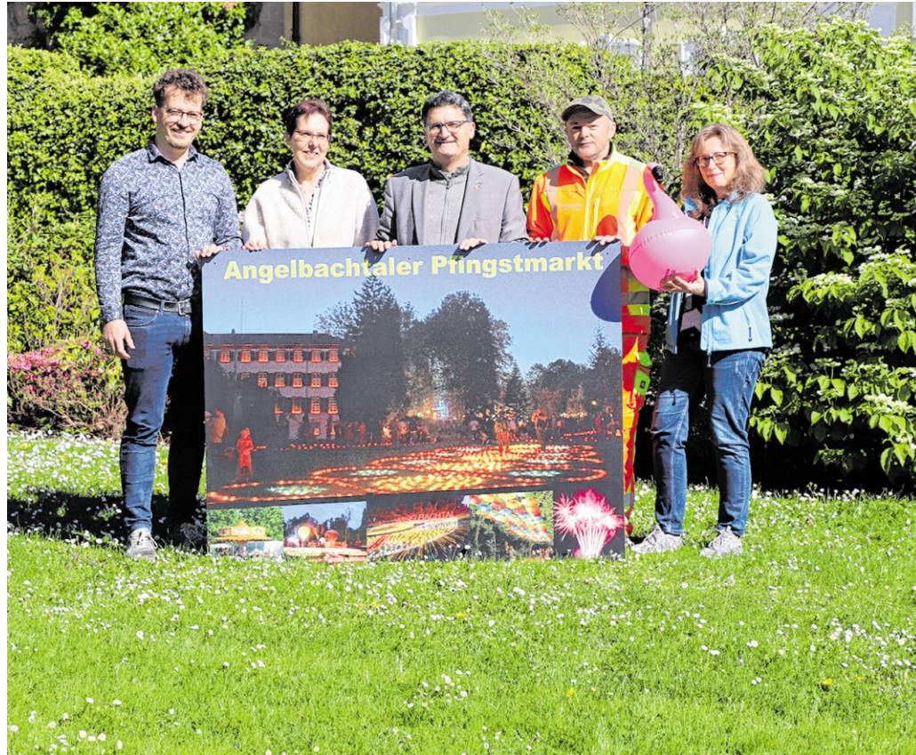
Freuen sich auf den Angelbachtaler Pfingstmarkt: Das Team der Gemeinde Angelbachtal.

In der Dorfmitte präsentiert sich ab Sonntag eine abwechslungsreiche Gewerbeschau, die Vielfalt und Leistungsfähigkeit der Angelbachtaler Betriebe eindrucksvoll zeigt.