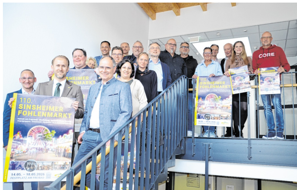
Vorfreude auf den 110. Sinsheimer Fohlenmarkt: Vertreter der Stadt, Sponsoren und Mitwirkende des großen Volksfestes.