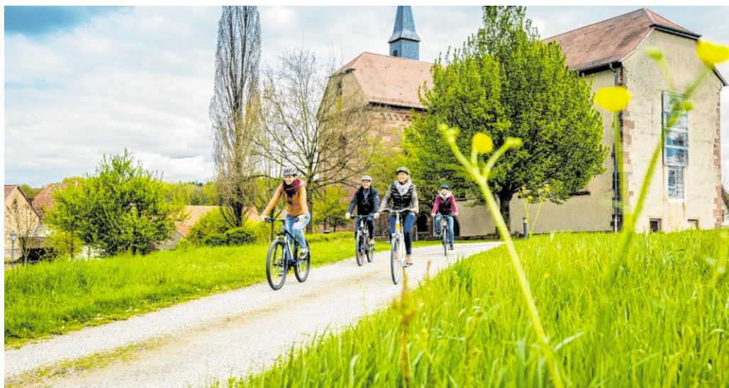
Auch das Kloster Lobenfeld wird im Rahmen einer Radtour der RadGuides Rhein-Neckar angesteuert – diese starten nun wieder mit vielen interessanten Touren in die Saison.

Weiter geht es über Schwanheim zur Quelle des Schwarzbachs oberhalb von Neunkirchen, dem höchsten Punkt der