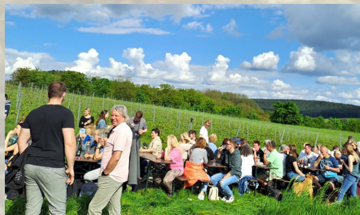
Frühlings-Auftakt der besonderen Art: Durch die schöne Angelbachtaler Landschaft beim Wine & Gin Walk.