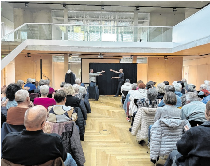
Die Sparkasse Kraichgau-Stiftung organisiert gemeinsam mit den „TheaterExperten“ Veranstaltungen zur Betrugsprävention, wie hier kürzlich in Waghäusel.

Bruchsal/Angelbachtal. Die Sparkasse Kraichgau setzt sich aktiv für den Schutz älterer Bürgerinnen und Bürger vor Betrugsmaschinen ein: Im Rahmen einer Reihe von interaktiven Informationsveranstaltungen hat die Sparkasse Kraichgau-Stiftung gemeinsam mit den „TheaterExperten“, einer Theatergruppe aus Ludwigsburg, sowie den örtlichen Kommunen die interaktive Aufführung „Hallo Oma“ realisiert. Ziel ist es, Seniorinnen und Senioren praxisnah über die Gefahren des Telefonbetrugs aufzuklären.