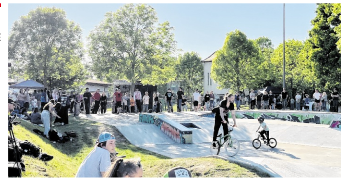
Der „SPRING BASH“ am Samstag, 9. Mai, bietet einen Skate-Contest und Festivalatmosphäre.

Die Rückmeldungen der Teilnehmer waren durchweg positiv: Viele schätzten die anschauliche Darstellung der Betrugsversuche und die Möglichkeit, direkt mit Fachleuten ins Gespräch zu kommen. Die Sparkasse Kraichgau plant, das erfolgreiche Format auch in Zukunft in weiteren Städten und Gemeinden des Geschäftsgebiets fortzuführen, um möglichst viele ältere Menschen in der Region zu erreichen und für die Gefahren des Enkeltricks zu sensibilisieren. Die nächsten Aufführungen sind am 22. Juli (14.30 Uhr) in Angelbachtal und am 9. Oktober (18.30 Uhr) in Bretten-Diedelsheim. pr/ug/spk