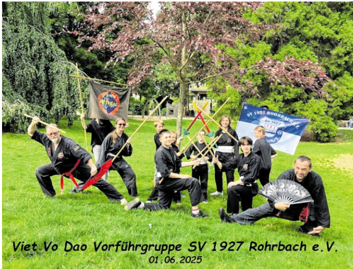
Viet Vo Dao Vorführgruppe SV 1927 Rohrbach e.V. 01.06.2025

Sinsheim. Mit Pferdeschau, Fassbieranstich, Musik und einem großen Feuerwerk startet der Sinsheimer Fohlenmarkt in vier abwechslungsreiche Festtage. Von Donnerstag, 14., bis Sonntag, 17. Mai, erwartet die Besucher in und rund um das Festzelt ein buntes Programm für alle Generationen - von Tanz, Fröhlschoppen und Kindernachmittag bis hin zu Krämermarkt, verkaufsoffenem Sonntag, Autoausstellung und Blaulichttag. Ergänzt wird das traditionsreiche Volksfest durch den Vergnügungspark, der sogar bis Montag geöffnet hat.