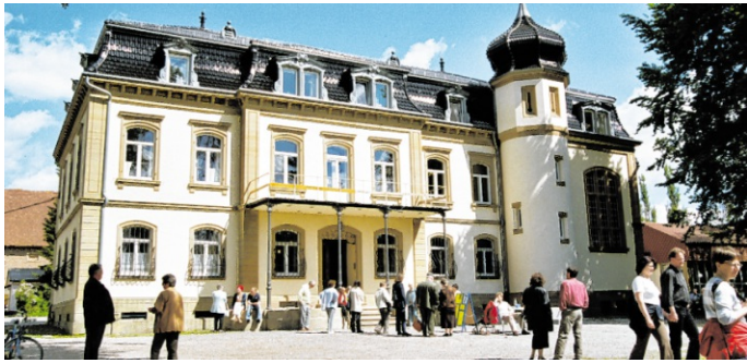
Blick auf das Schloss Buchenauerhof, das am Erlebnistag von innen besichtigt werden kann.

Reichartshausen. Die Sportschützen (SGi Reichartshausen) laden am diesjährigen Vatertag, 14. Mai, zu einem gemütlichen Grillfest ins Schützenhaus ein. Beginn der Veranstaltung ist ab 10 Uhr. Besucher dürfen sich auf frisch Gegrilltes, kühle Getränke und gesellige Stunden in entspannter Atmosphäre freuen. Das Fest bietet die ideale Gelegenheit, den Feiertag gemeinsam mit Familie, Freunden oder Vereinskameraden zu verbringen. Für das leibliche Wohl ist bestens gesorgt – von herzhaften Spezialitäten vom Grill bis hin zu erfrischenden Getränken. Die Sportschützen freuen sich auf zahlreiche Gäste und einen gelungenen Festtag. red