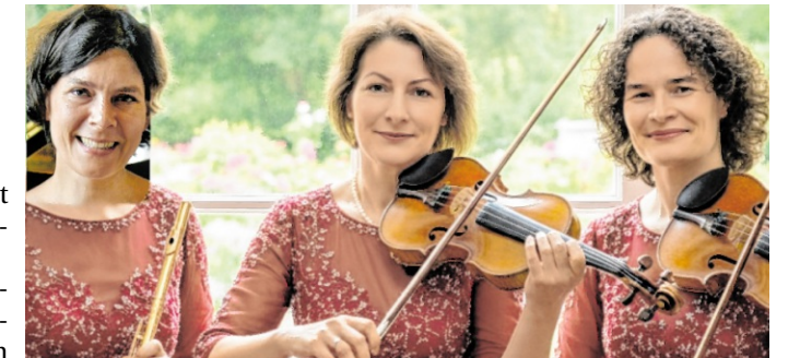
Die drei Musikerinnen am 25. Mai erleben.

Der Eintritt ist frei, um Spenden wird gebeten.