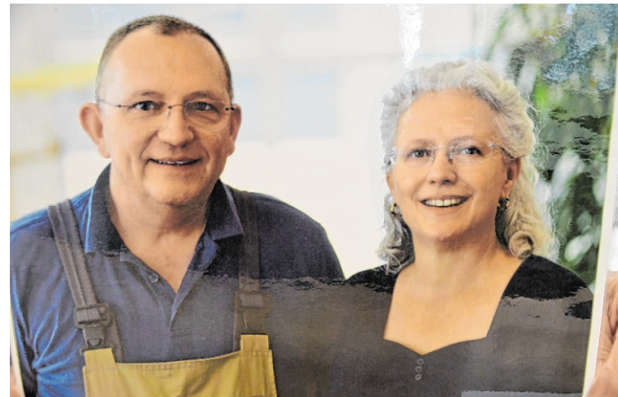
Zu den hochwertigen Betten wird auch die passende Bettwäsche, Matratzen und alles was zum Sortiment gehört, angeboten.

Beim Abverkauf werden hochwertige Betten, Wasser- und Luftvitalbetten dynaglobe sowie sortimentserweiterte Produkte und Inventar zu Schnäppchenpreisen angeboten. Alles muss raus. Der Abverkauf läuft von Montag, 4. Mai, bis Samstag, 27. Juni (letzter Öffnungstag).