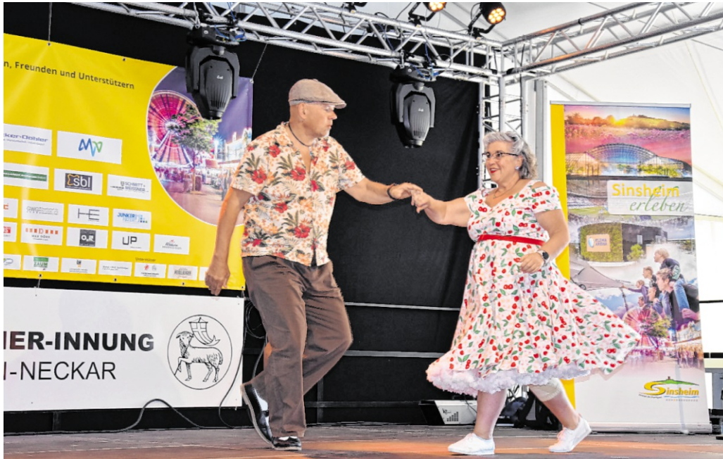
Beim Seniorennachmittag freitags wartet ein unterhaltsames Rahmenprogramm mit Kaffee und Kuchen.