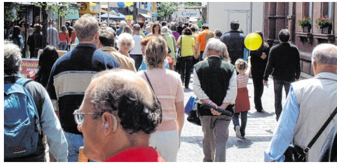
Die Besucher können am verkaufsoffenen Fohlenmarkt-Sonntag gemütlich durch die Innenstadt bummeln.