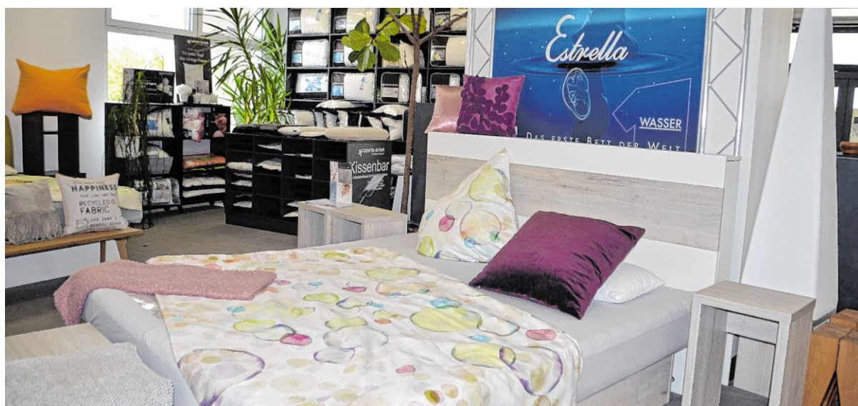
Zu den hochwertigen Betten wird auch die passende Bettwäsche, Matratzen und alles, was zum Sortiment gehört, angeboten.