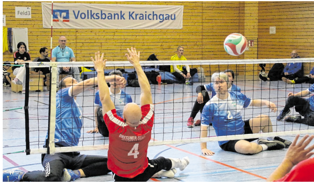
Sitzvolleyball: Beim Volksbank Kraichgau-Cup steht neben dem sportlichen Ehrgeiz vor allem das Miteinander im Vordergrund.

Sportlicher sowie gesellschaftlicher Austausch über Landesgrenzen hinweg.