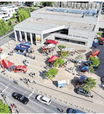
Am Fohlenmarktsonntag präsentieren sich Feuerwehr, Polizei THW und DRK beim Blaulichttag.