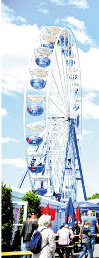
Auch in diesem Jahr wartet die Familie Lowinger wieder mit einem spektakulären Vergnügungspark auf.

Auch die jüngsten Fohlenmarktbesucher kommen nicht zu kurz. Mehrere Kinderfahrgeschäfte sorgen für ein abwechslungsreiches Angebot. Ergänzt wird das Angebot durch Spiel- und Geschicklichkeitsbetriebe wie beispielsweise Entenangeln, Dosenwerfen, Verlosung, Pfeilwerfen, „Fang den Frosch“ und vieles mehr.