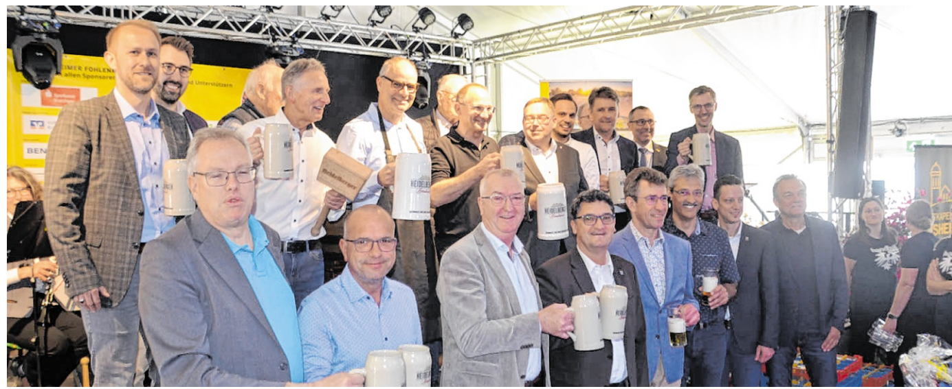
Zahlreiche Ehrengäste geben sich alljährlich bei der Fohlenmarkt-Eröffnung ein Stelldichein.

Der Freitagnachmittag gehört auf dem Fohlenmarkt traditionell den Senioren. Im Festzelt gibt es beim Seniorennachmittag Kaffee und Kuchen mit musikalischem und unterhaltensreichem Rahmenprogramm. Sinsheimer Stadträte haben sich auch in diesem Jahr bereit erklärt, die Festwirte bei der Bewirtung zu unterstützen. Die Lehman Brothers sorgen für musikalische Unterhaltung. An Infoständen im Festzelt stellen