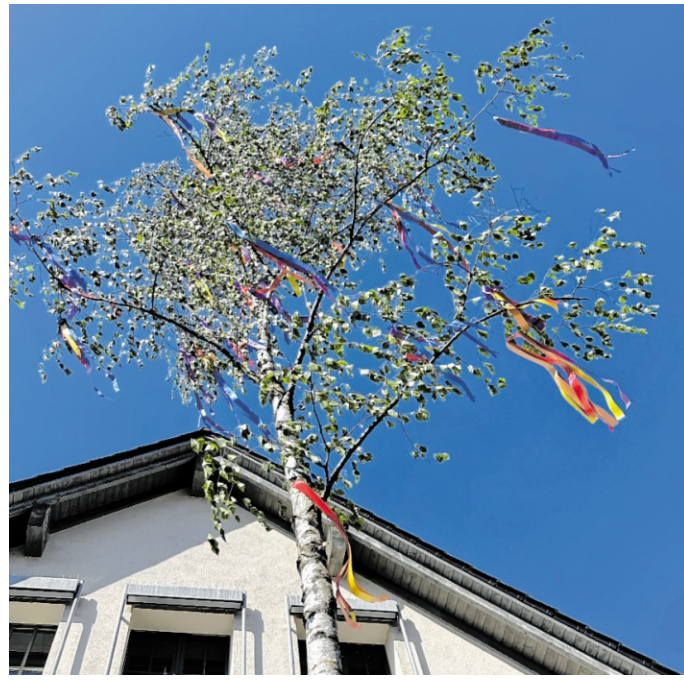
Mit schwungvollen Klängen und guter Laune zog der Musikverein Reichartshausen bei den Maienspielen durch den Ort.