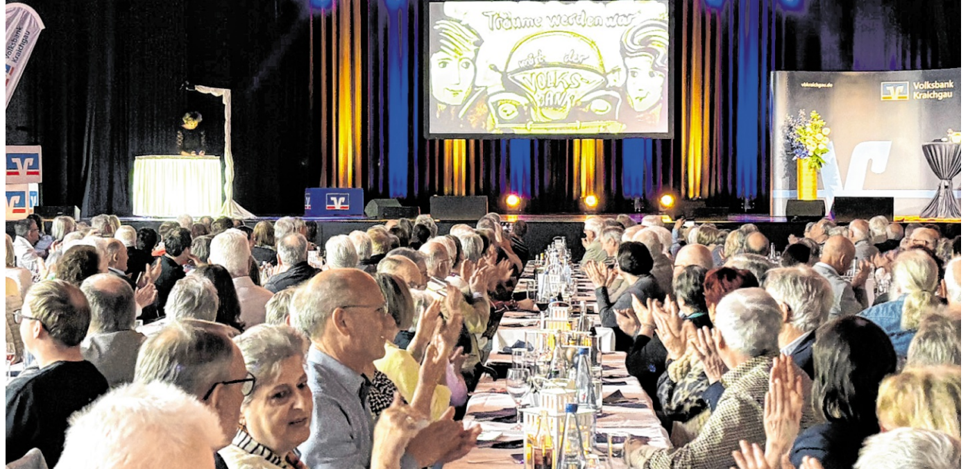
Am 14. April feierte die regionale Genossenschaftsbank, mit rund 460 Teilhabern aus der Region Sinsheim, bis zu 70 Jahre Mitgliedschaft bei der Volksbank Kraichgau.