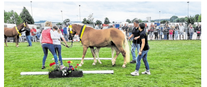
Ein Highlight beim Sinsheimer Fohlenmarkt ist die Pferdeschau mit Zuchtstutenprämierung auf dem Bolzplatz am Jugendhaus.

Pferdeschau und Zuchtstutenprämierung sind traditionell untrennbar mit dem Fohlenmarkt verbunden. Prämierung und Schauprogramm, veranstaltet von den Zuchtvereinen Nordbaden in Kooperation mit der Stadt Sinsheim, finden am Donnerstag ab 10 Uhr auf dem Bolzplatz am Jugendhaus statt. Der Reiterhof Nerpel sorgt für die Bewirtung am Gelände.