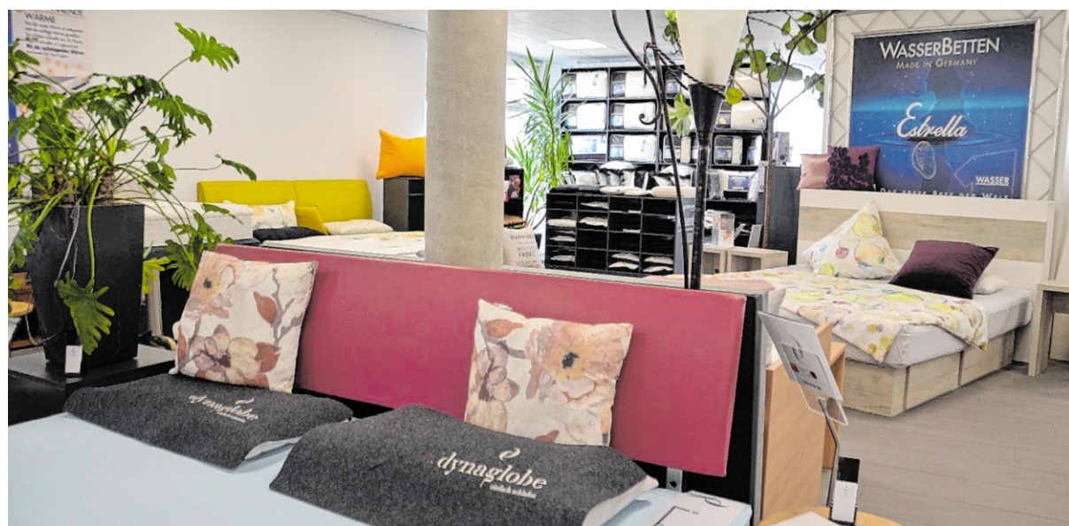
Impressionen von den hochwertigen Betten nebst Zubehör bei Gröner in Walldorf.