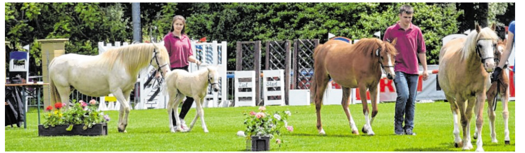
Zuchtstutenprämierung beim Sinsheimer Fohlenmarkt.

Die Eröffnung des Sinsheimer Fohlenmarktes findet am 14. Mai um 11 Uhr im Festzelt statt. An diesem Tag dürfen sich die Besucher von 11 von 12 Uhr über eine Stunde Freifahrten an allen Fahrgeschäften freuen. Am Donnerstagabend gegen 21.30 Uhr kann dann das Riesenfeuerwerk bestaunt werden. Der ganztägige Familientag am Montag, 18. Mai bietet halbe Fahrpreise an allen Fahrgeschäften und Sonderaktionen an allen Verkaufsgeschäften an.