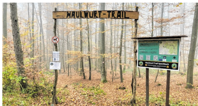
So sieht der Eingang zum „Maulwurf-Trail“ aus, an dem auch eine Infotafel steht.

„Die Grundlage für den Trail war ein bereits existierender, schmaler Wanderpfad im Spechbacher Wald“, erklärt Förster Markus Groß, der maßgeblich an der Planung beteiligt war. „Dieser Pfad wurde 2019 zu einem befahrbaren Mountainbike-Trail umgebaut. Es war mir wichtig den kompletten Prozess zu begleiten.“ Er übernahm die Abstimmung mit den Beteiligten sowie die Vorbereitung der Genehmigungen für die Untere Forstbehörde des Rhein-Neckar-Kreises, die das Vorhaben von Anfang an unterstützt hat. Seit 2022 kümmert sich eine engagierte Gemeinschaft aus Mountainbikern ehrenamtlich um die Weiterentwicklung und