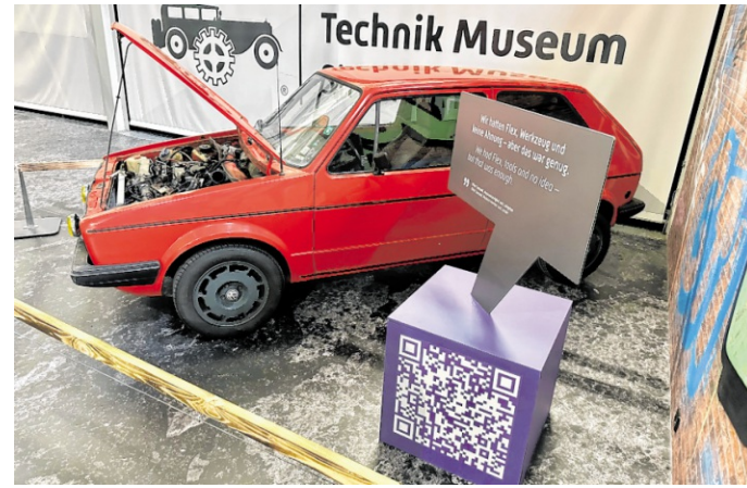
In der Sonderausstellung „Faszination Tuning“ im Technik Museum Sinsheim ergänzt ein lila Informationswürfel das Ausstellungserlebnis mit persönlichen Geschichten des Leihgebers und zusätzlichen Hintergründen zum Exponat.

vaten Sammlern, die ihre Fahrzeuge und Technikobjekte der Öffentlichkeit zur Verfügung stellen. Dadurch werden Projekte möglich, die international Aufmerksamkeit erregen. Dazu zählen spektakuläre XXL-Transporte wie die der Concorde, der Boeing 747, des Raumgleiters Buran oder zuletzt des U-Boots U17. Solche Vorhaben lassen sich nur realisieren, weil Mitarbeitende, Ehrenamtliche, Mitglieder und Fans als starke Gemeinschaft zusammenarbeiten. „Wir sind keine Visionäre, aber wir sind eine Gemeinschaft von Träumern. Viele davon sind be-