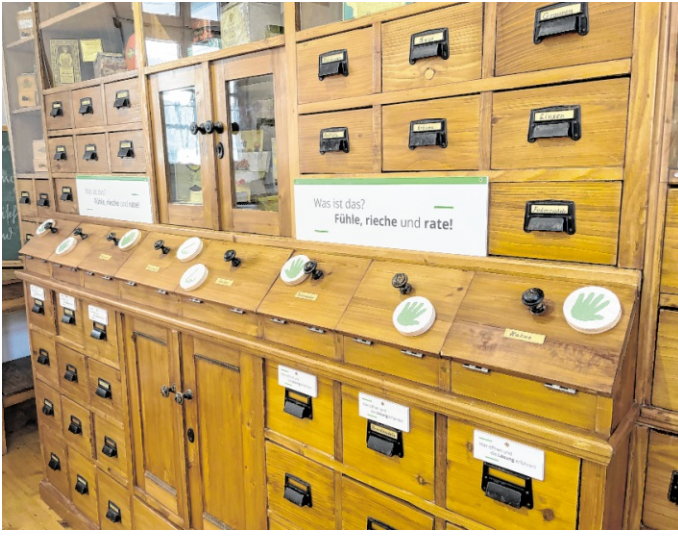
Im Lichdi-Laden lässt sich Geschichte im wahrsten Sinne des Wortes „begreifen“ – und nun auch an einer Riechstation mit dem Geruchssinn entdecken.

Während man einerseits mehr über die Geschichte des Einkaufens erfahren kann, bietet die Ausstellung andererseits Informationen zu den ehemaligen deutschen Kolonien sowie zu den Waren, die aus diesen Gebieten importiert wurden. Die Fühlstation mit thematisch passenden Objekten lädt Besucher ein, die Geschichte im