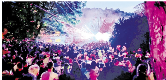
Beeindruckendes Zusammenspiel von Lichtkunst und Klangkompositionen bei der Musik-Lasershow.