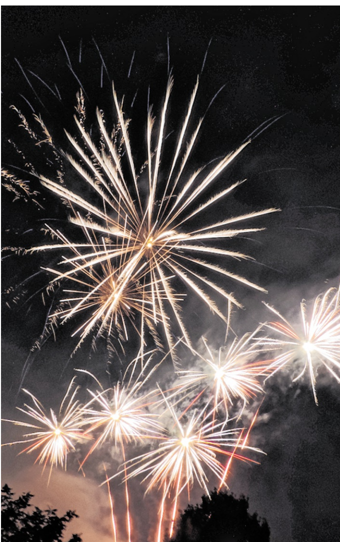
Am Pfingstmarkt-Samstag wird ein Feuerwerk den Angelbachtaler Abendhimmel erleuchten.

FAMILIENFEST: Programm zum Angelbachtaler Pfingstmarkt.