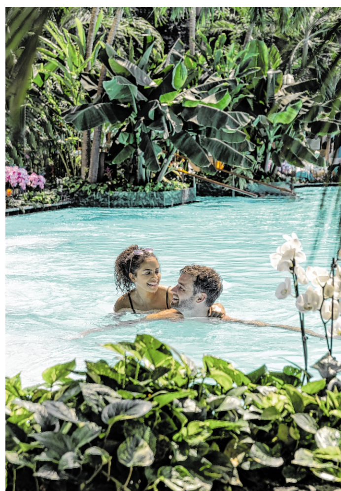
Palmparadies und Lagune: Hier kann man den Sommerurlaub als erholsame und erlebnisreiche Familienzeit genießen.