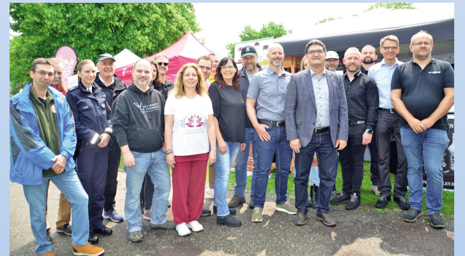
Eröffnung der Gewerbeausstellung mit den Ausstellern, Bürgermeister und Vorsitzendem der Unternehmerinitiative.

Begleitet wird die Ausstellung von der besonderen Atmosphäre des Angelbachtaler Pfingstmarktes mit seinem vielfältigen kulinarischen Angebot, Musik und einem abwechslungsreichen Rahmenprogramm für die ganze Familie. Die Unternehmerinitiative Angelbachtal freut sich auf zahlreiche Besucherinnen und Besucher und lädt herzlich dazu ein, die 16. Gewerbeausstellung, die am Pfingstsonntag ab 11 Uhr rund um die Dorfmitte zum Besuch einlädt, zu entdecken.