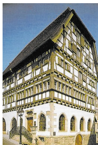
Stadt- und Fachwerkmuseum „Alte Universität“.

Eppingen. In der Ferien-Werkstatt in der „Alten Universität“ dreht sich am Donnerstag, 28. Mai, alles um das Thema Drucken. Nach einer Führung in der Sonderausstellung dürfen die Kinder in der Museums-Werkstatt in der Zeit zwischen 10 und 12 Uhr selbst kreativ werden. Dort entstehen Druckexperimente mit selbst gebastelten Druckwalzen. Für den Workshop ist eine Anmeldung bis spätestens Montag, 25. Mai erforderlich. Kosten pro Person vier Euro, ab sechs Jahren. ug