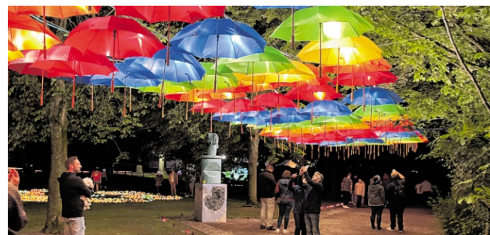
Eine Regenbogenallee aus unzähligen bunten Schirmen erstrahlt im Schlosspark.