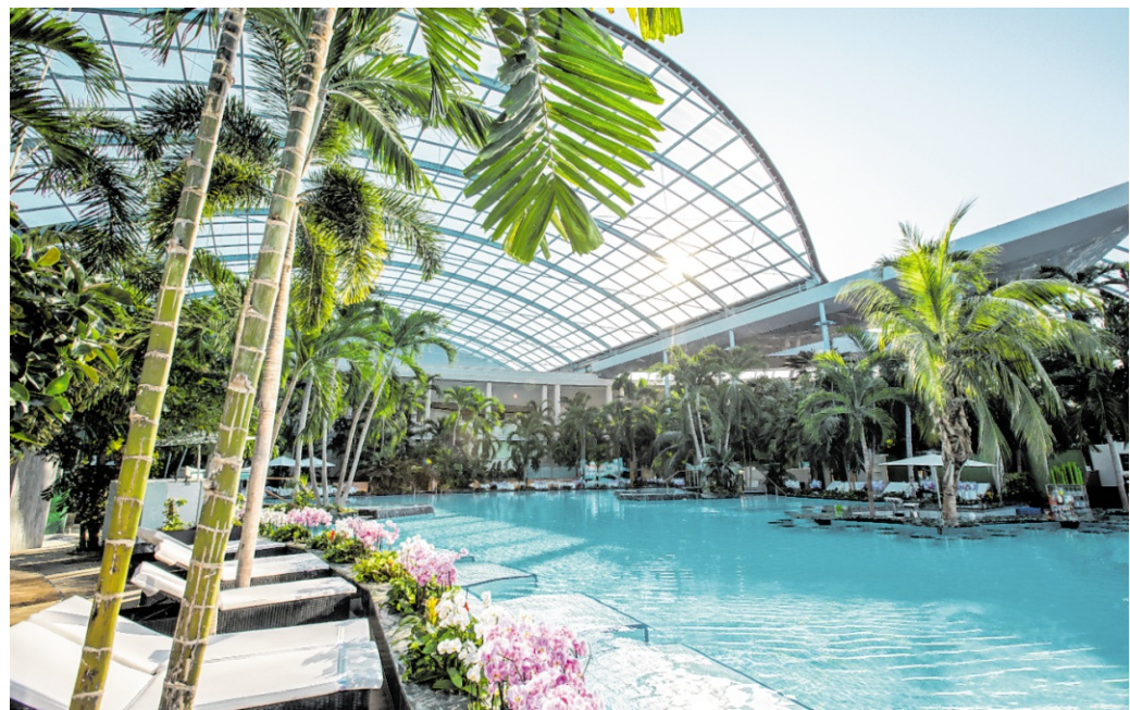
Zwischen dem 27. Juni und 13. September öffnet die Thermen & Badewelt Sinsheim das Palmenparadies und den Paradise Beach für die ganze Familie.