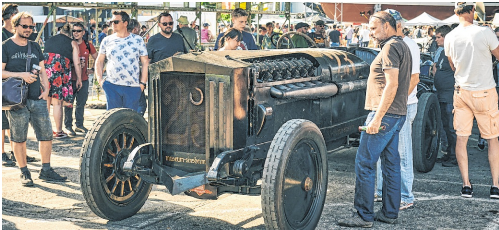
Der BRAZZELTAG steht wie kaum ein anderes Event für das Motto „Für Fans von Fans“: Mitglieder, Aussteller, Enthusiasten und Besucher machen das Technik-Festival in Speyer Jahr für Jahr zu einem einzigartigen Erlebnis.

Seit dem 6. Mai, dem Eröffnungstag des Technik Museum Sinsheim vor 45 Jahren, treten die Museen mit einem einheitlichen Erscheinungsbild auf. Aus dem bisherigen Blau des Technik Museum Sinsheim und dem Rot des Technik Museum Speyer wird künftig Lila. Der neue Markenauftritt wird sowohl in den Museen als auch digital sichtbar, unter anderem durch eine neu gestaltete Website ( www.technik-museum.de ). Die Farbwahl ist bewusst getroffen: Lila entsteht aus der Verbindung von Blau und Rot. Sie steht für Kreativität, Vorstel-