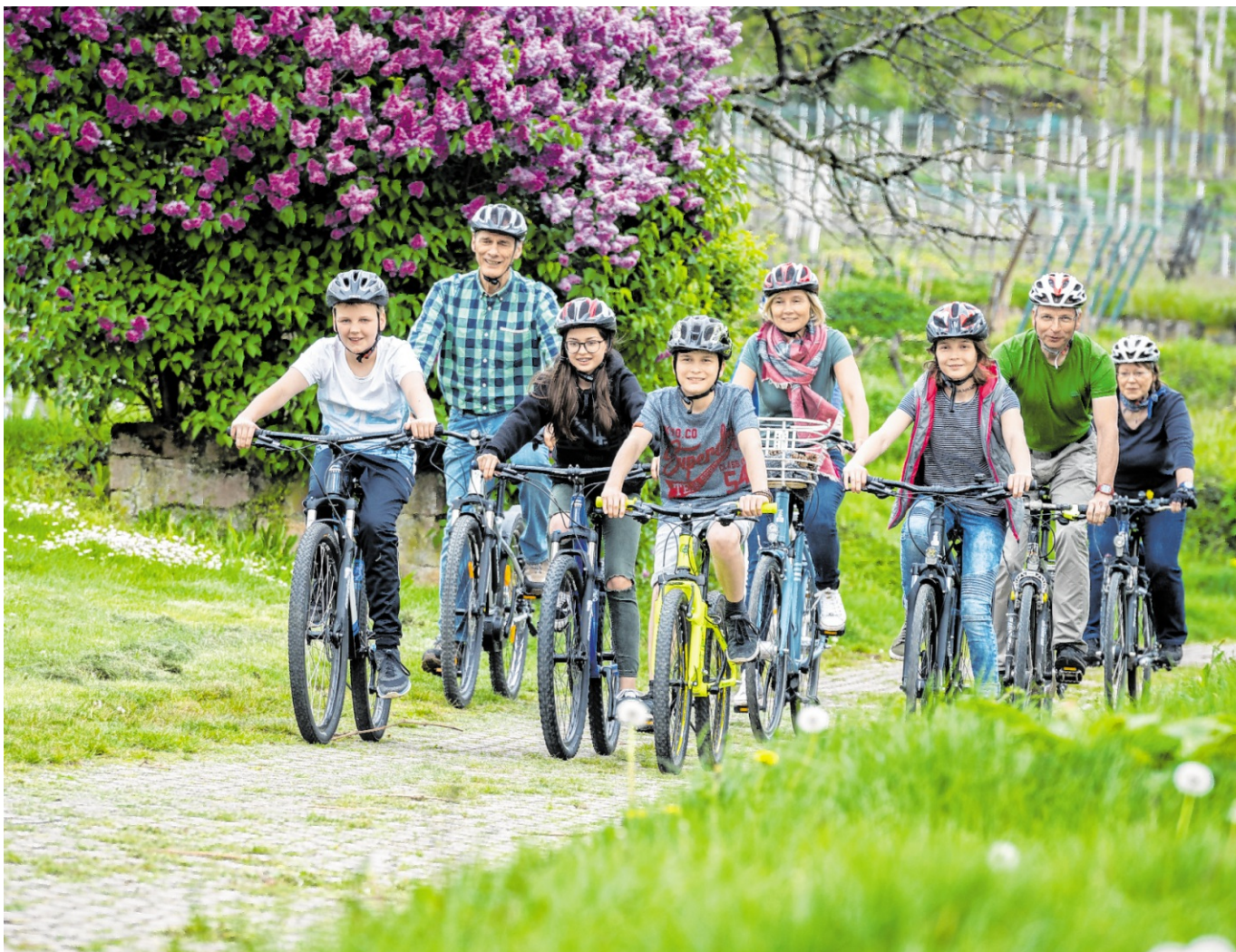
Geführte Radtouren der RadGuides Rhein-Neckar führen durch den Kraichgau und den Kleinen Odenwald sowie zur Wertstoffsortieranlage in Sinsheim.

Telefon: 07261/ 976 386 E-Mail: ugross-redaktion@t-online.de