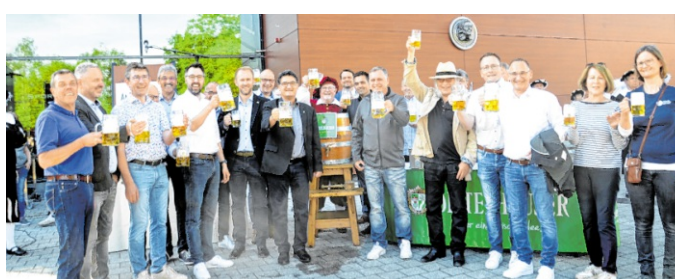
Ein Prosit auf den Angelbachtaler Pfingstmarkt.

Bereits zur Eröffnung am Pfingstamstag, um 18 Uhr vor der örtlichen Sonnenberghalle, erwartet die Gäste eine stimmungsvolle Atmosphäre mit zahlreichen Marktständen, Fahrgeschäften und gastronomischen Angeboten. Besucher dürfen regionale Spezialitäten, süße Leckereien, herzhaftes Speisen sowie ein breites Getränkeangebot genießen. Die Kinder freuen sich auf zahlrei-