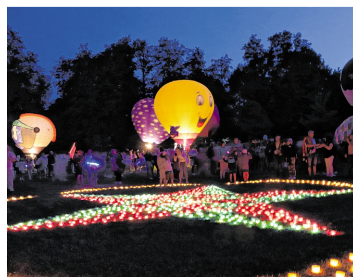
Pfingstmarkt-Highlight: Die Beleuchtung am Sonntagabend mit den Ballonfahrern.

Als wäre das Lichtermeer aus 50.000 Kerzen nicht schon spektakulär genug, wartet eine Attraktion, die den Blick wie von Zauberhand gen Himmel zieht: Das „Ballonteam Friesenheim“ verwandelt den Schloss-