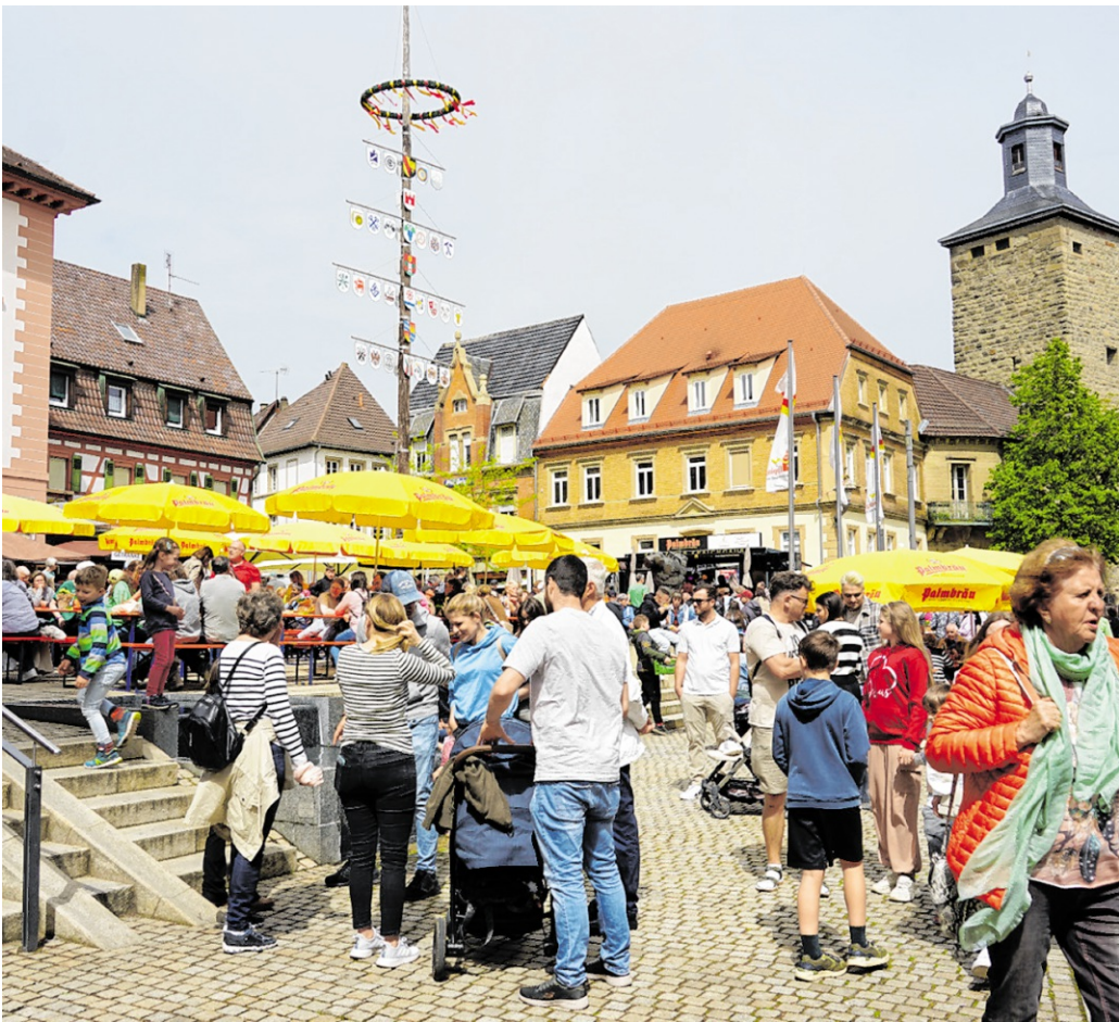
Brauchtum, Unterhaltung, Kultur und Einkaufserlebnis: Eppingen feiert den Frühling.

Für das leibliche Wohl sorgen die Gastronomiebetriebe ARAS Bar, Helget's Restaurant und das Restaurant Palme mit einem vielfältigen kulinarischen Angebot.