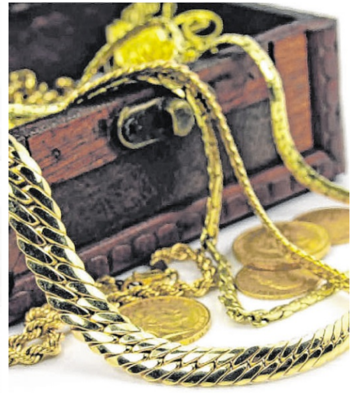
Goldschmuck und Goldmünzen