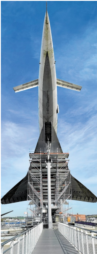
Die Tupolev Tu-144 auf dem Dach des Technik Museums Sinsheim wird umfassend restauriert und neu lackiert.

Lange galt es als wahrscheinlich, dass die Tu-144 für eine