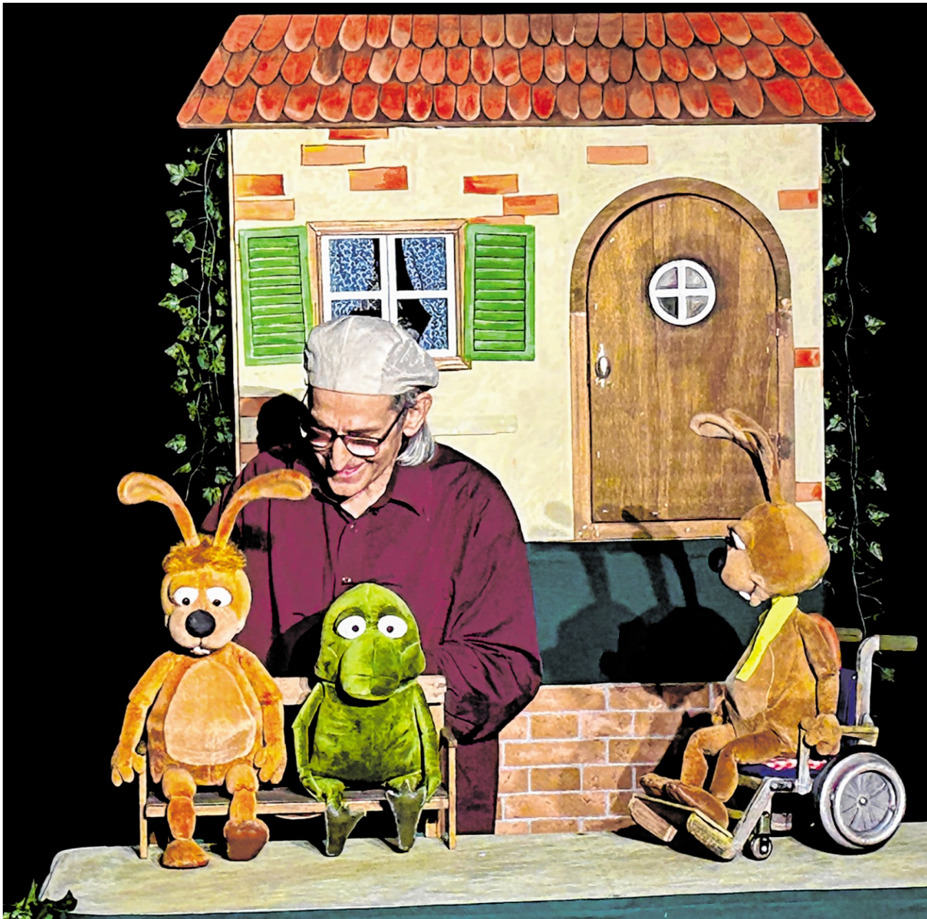
Die beliebten Figuren Nulli und Priesemut bringen ein ebenso warmherziges wie mitreißendes Abenteuer mit: „Rolli Tom“.

Polizei 110 Feuerwehr/Rettungsdienst 112 Einheitliche Behördennummer 115 Kinder- und Jugendtelefon 0800/ 111 0333 Kinderärztlicher Notdienst Ortsvorwahl/19 292 Zahnärztlicher Notdienst 06221/ 254 4917 Kreiskrankenhaus Sinsheim 07261/ 66-0 Opfernotruf 01803/ 343 434 Telefonseelsorge 0800/111 0111 Suchthilfe 06252/ 700 590 Tierklinik 07261/ 135 95 Pflegestützpunkt 06221/ 522 2622 Wasserversorgung 07261/ 404 881 Baubetriebshof 07261/ 404 880 AVR Zentrale Auftragsannahme 07261/ 9310 Frauen in Not 08000/ 116 016