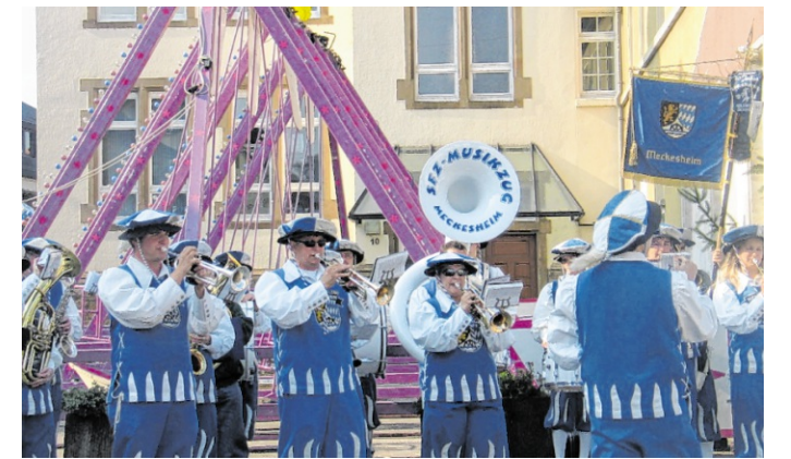
Der SFZ-Musikzug Meckesheim feiert sein 75. Jubiläum beim Meckser Fröhling.