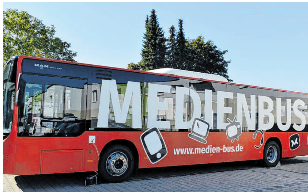
Medienhilfe direkt: Im Mai kommt der Medienbus nach Sinsheim.

weiligen Akustiker erfolgen. Bei Interesse sollte man einfach mal beim nächsten Besuch nachfragen. Nicht nur in Flinsbach sondern auch in weiteren Kirchen des hiesigen Kirchenbezirks ist dies möglich. Meist findet man dazu am Eingang oder an den Bänken Hinweise. Daher sollte man auf das Symbol achten (wie auf dem Bild zu sehen). Dieses gibt Auskunft darüber, ob eine sogenannte T-Spule eingebaut ist. ug/PL