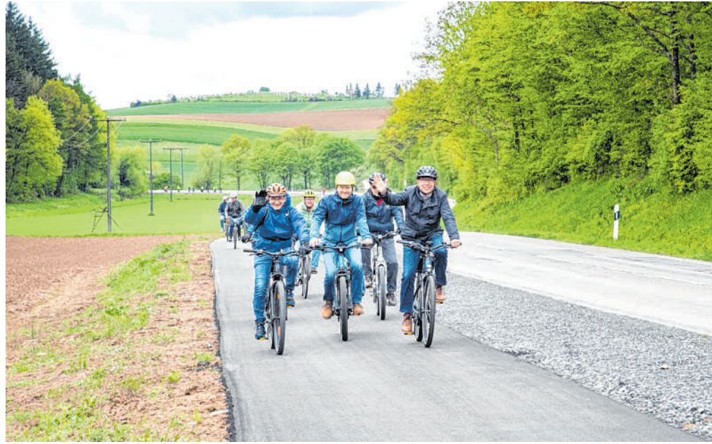
Verkehrssituation entscheidend verbessert: Jetzt kann nach Herzenslust geradelt werden.