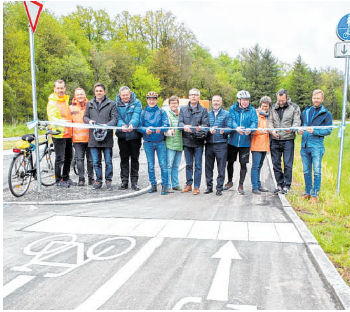
Offiziell eingeweiht: Der Radweg zwischen Sinsheim Steinsfurt und Adersbach.