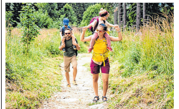
Gegen rund um Epfenbach: Beim Wandertag der Erlebnisregion kann die Gegend entlang einer acht Kilometer langen Strecke erkundet werden.

Weitere Informationen: www.DMGint.de/Frümü/