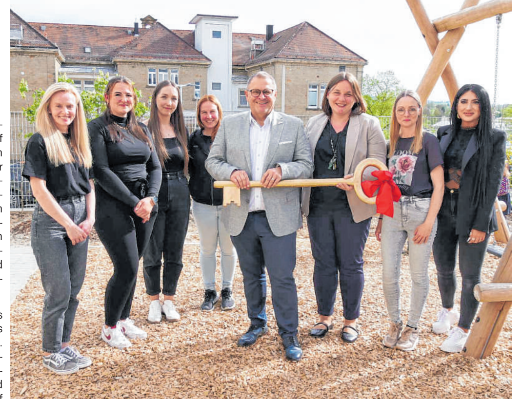
Symbolischen Schlüsselübergabe: Der Kindergarten Katharinenstraße startete als siebte Einrichtung in städtischer Trägerschaft nun offiziell in den Kindergarten-Alltag.