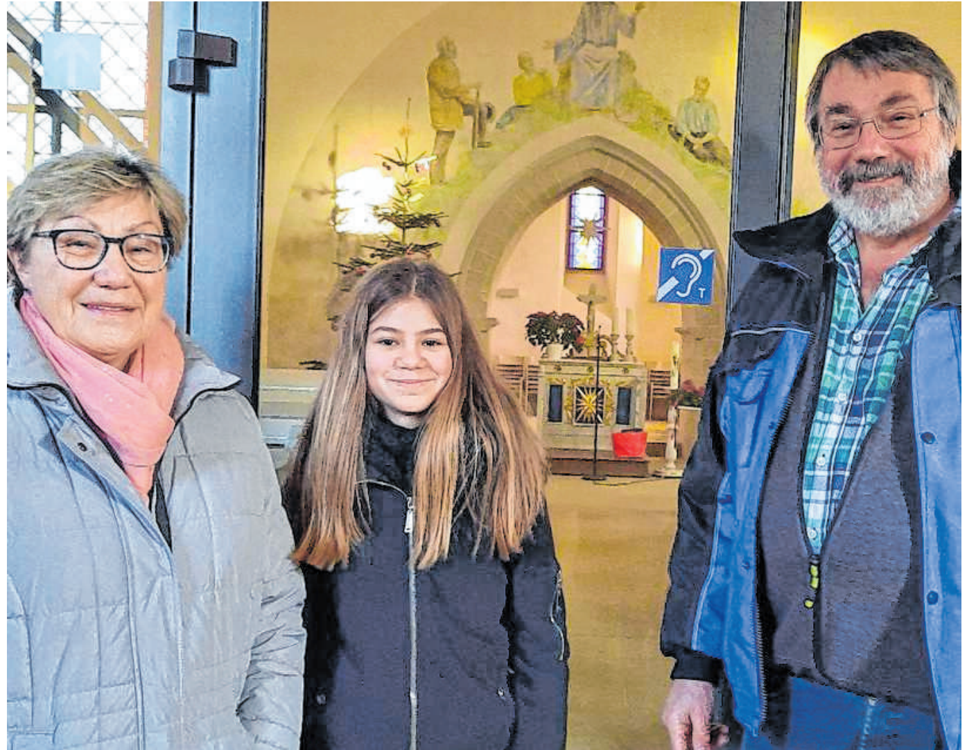
Störgeräusche oder ein ungünstiger Platz stellen nun kein Problem mehr dar: Die Konfirmandin kann sich nun in ein kircheninternes System einwählen, das über einen Induktionsschleifenverstärker die Laute des Tonsystems direkt für Hörgeräteträger hörbar macht.