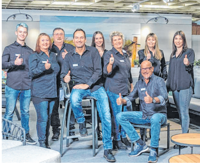
Das Team von Gartenmöbel-Bacz: Gute Beratung und ein hervorragender Service sind garantiert. Bei Bacz freuen sich alle auf viele interessierte Besucher.