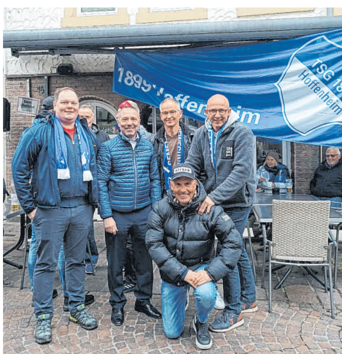
Konzept begeistert: Nicht nur die Besucher der Innenstadt zeigten sich von der neuen Fanmeile angetan.

Die AZP GmbH ist ein Unternehmen der HAAS Mediengruppe : Mannheimer Morgen, Südhessen Morgen, Bergstraße Anzeiger, Schwetzingen Zeitung, mannheimer-morgen.de, Mannheim24.de, Morgenpost.