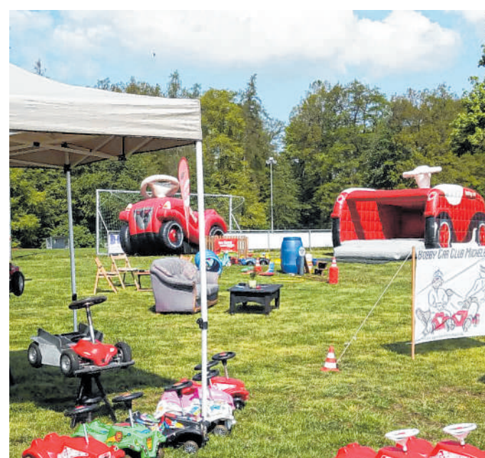
Die Vorbereitungen laufen auf Hochtouren: Am 1. Mai dürfen sich alle wieder auf das Bollenberg-Familien-Fest der SV Union Michelbach freuen.

Informationen zur Fanmeile gibt es online unter www.sinsheim.de/fanmeile/