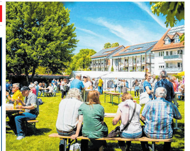
Am 28. April: Das Missions- und Hilfswerk DMG lädt zum Frühlingsmissionsfest auf dem Buchenauerhof ein.

Die AZP GmbH ist ein Unternehmen der HAAS Mediengruppe: Mannheimer Morgen, Südhessen Morgen, Bergsträßer Anzeiger, Schwetzingener Zeitung, mannheimer-morgen.de, Mannheim24.de, Morgenpost.