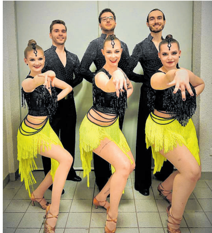
Glänzen beim Frühlingsball: Die Latein-Formation begeisterte mit ihrem Programm unter dem Titel „Brasil“.