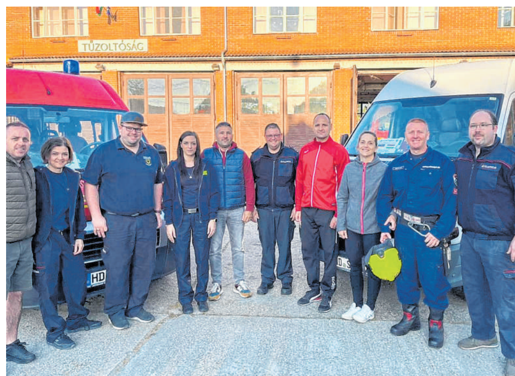
Herzengangelegenheit: Die Sinsheimer Wehrleute lieferten insbesondere Hygieneartikel nach Barcs. BILD: GROSS

FREIWILLIGE FEUERWEHR: Unterstützung für Barcs