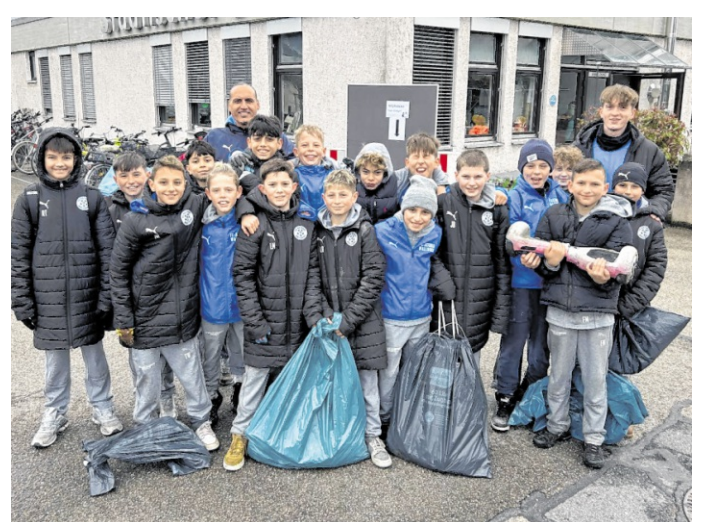
Die U12 schnappte sich Müllbeutel, Rechen und Besen und zog Richtung Wald, um dort sauber zu machen.

Das soziale Mannschaftsprojekt der U17 fand auf dem Fußballplatz statt. Die Kicker trafen sich mit dem Inklusionsteam der FCA Löwen zu einer gemeinsamen Trainingseinheit. Voneinander lernen, die Freude am Fußball teilen und der gemeinsame Austausch hat beiden Teams mal wieder gezeigt, wie verbindend der Sport sein kann. „Solche Aktionen zeigen,