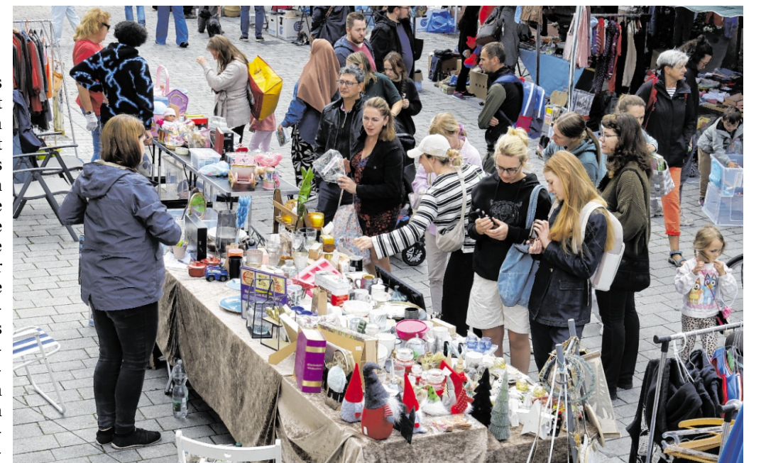
Am 4. Juli verwandelt sich die vordere Hauptstraße in eine bunte Verkaufsmesse. Plätze für Erwachsene und Kinder können ab sofort reserviert werden.

Interessierte Flohmarktteilnehmer sollten sich rechtzeitig anmelden, um sich ihren gewünschten Platz zu sichern. Der Flohmarkt bietet eine wunderbare Gelegenheit, in der Hauptstraße zu stöbern, zu verkaufen und einen bunten Tag in der Stadt zu genießen. red