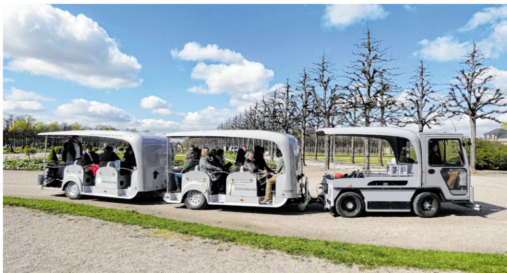
72 Hektar Gartenkunst ganz entspannt erleben: Die Solar-Wegebahn bringt Besucher klimafreundlich zu den Highlights der Anlage.

Mit der neuen Solar-Wegebahn wird es nun deutlich einfacher, den gesamten Garten zu erkunden – insbesondere für Gäste, die nicht gut zu Fuß sind. Die etwa 90-minütige Rundfahrt startet an der Schlossterrasse und führt durch die wichtigsten Bereiche der Anlage.