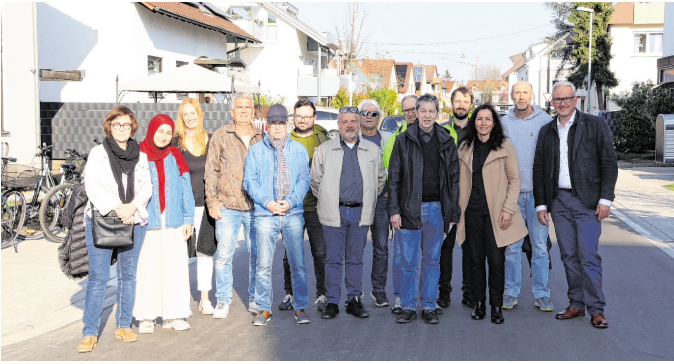
Vertreter der Stadtverwaltung, des Gemeinderats, der Stadtwerke Waldorf und des beteiligten Ingenieurbüros überzeugten sich von der gelungenen Fertigstellung der Rheinstraße.