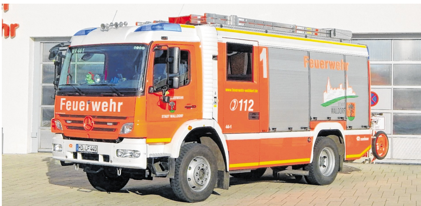
Zwei ältere Löschfahrzeuge der Freiwilligen Feuerwehr müssen ersetzt werden. Der Gemeinderat hat in seiner jüngsten Sitzung jetzt die Anschaffung beschlossen.