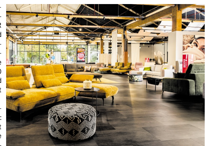
Polstermöbel Fischer in Bruchsal

Am Standort Bruchsal stehen erfahrene Lieblingsplatzberater bereit, um bei der Auswahl des