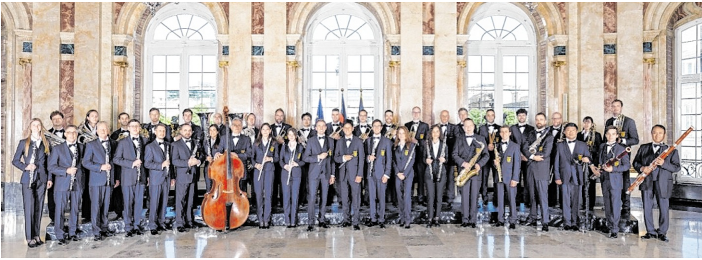
45 Berufsmusiker aus 16 Nationen begeistern mit Spielfreude und technischer Perfektion.