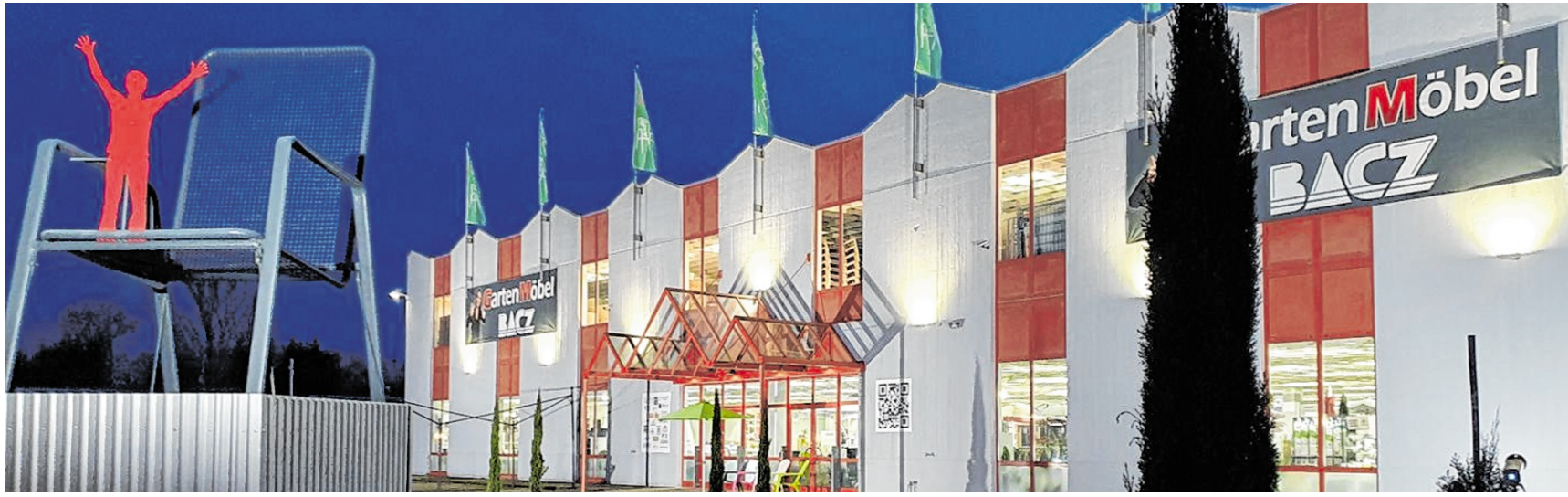
Jetzt sollt man unbedingt Gartenmöbel-Bacz in Helmstadt besuchen - direkt beim größten Gartenstuhl Deutschlands.