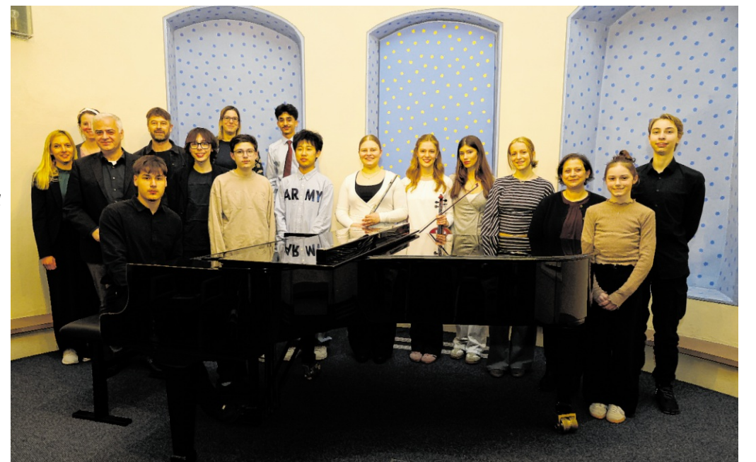
Beim Kammerkonzert des Gymnasiums im Rahmen der Konzerte der Stadt begeisterten die jungen Talente mit einer großen musikalischen Bandbreite vor vollem Haus.