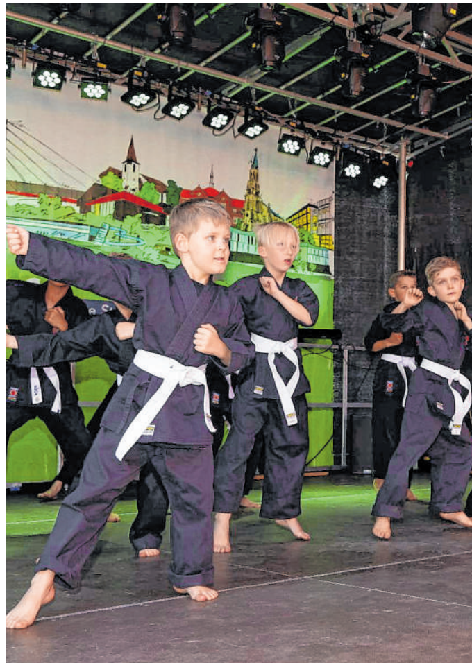
Kampfkunst: Die Nachwuchssportler zeigen beim Spargelmarkt ihr Können.