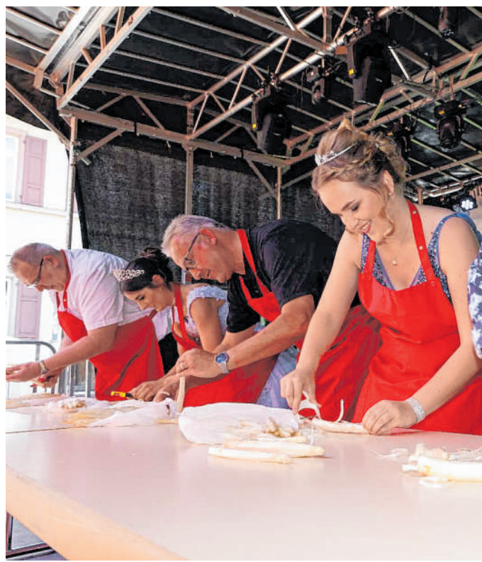
Wer macht das Rennen?: Ein Highlight ist der Spargelschälwettbewerb am Sonntag, 12. Mai.