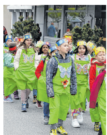
Winter adé: Anlässlich des Sommertagszugs tragen die Schüler der Waldschule grüne Schürzen mit Schmetterlingsmotiven.

Waldorf. Da hat sich der Winter doch noch mal blicken lassen, als sich am frühen Sonntagmittag der Sommertagszug durch Waldorfs Straßen schlängelt. Temperaturen im niedrigen einstelligen Bereich und viel Wind, dazu drohender Regen durch aufziehende Wolken. „So schlechtes Wetter hatten wir bisher noch nicht“, stellt auch Ralf Becker fest. Becker ist Vorsitzender des Vereins Der Churpfalz wilder Haufen, der den Sommertagszug in Kooperation mit der Stadt organisiert. Rund 20 Mitglieder des Vereins sind im Einsatz, dazu etwa 70 Schüler der elften Klassen des Waldorfer Gymnasiums. Sie helfen dabei mit, die Fahrzeuge und Gruppen zu begleiten und den Weg abzusichern.