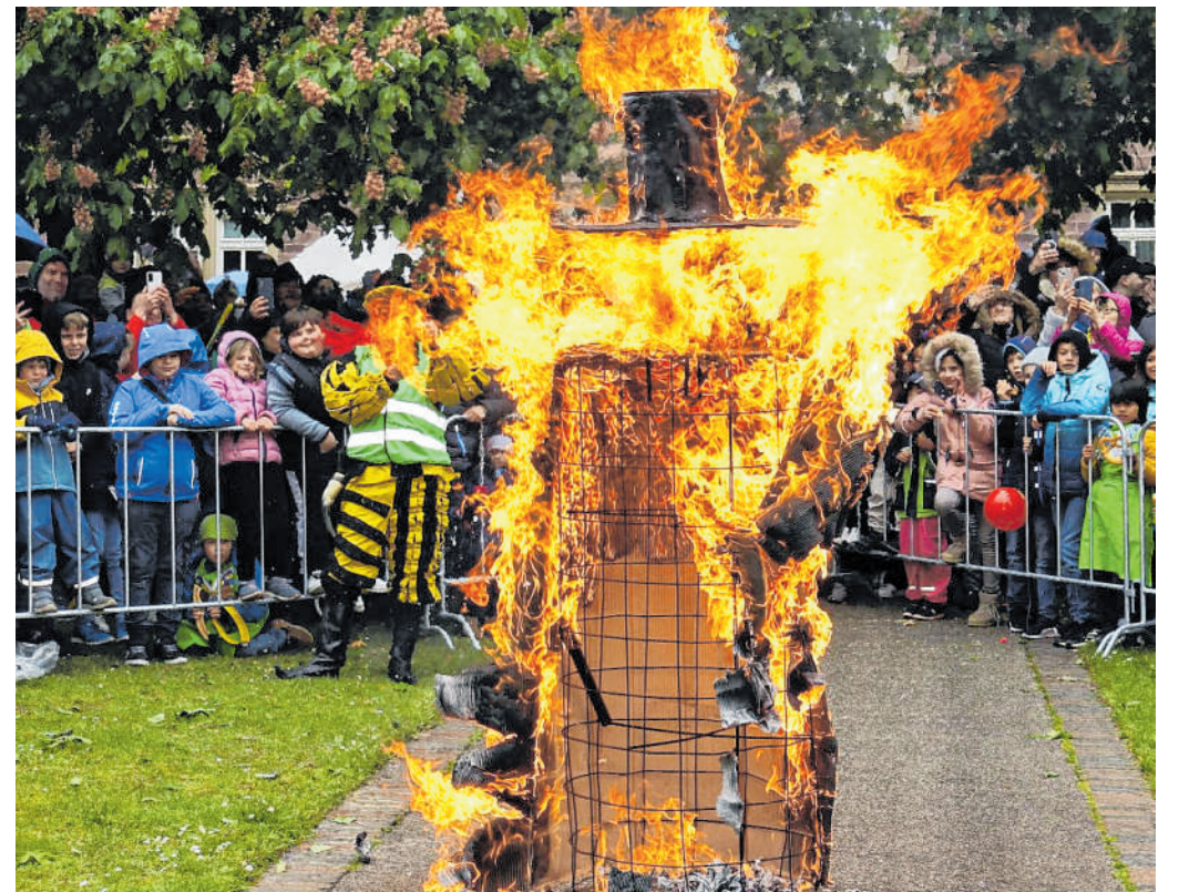
Spektakel: Der rund 2,50 Meter hohe Schneemann wurde auf der Wiese des Astorparcs abgebrannt.