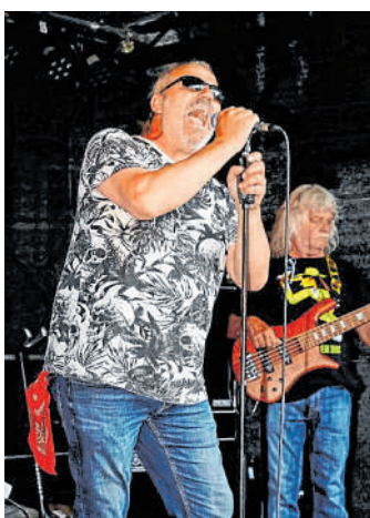
Musik: Viele Live-Acts haben ihr Kommen zugesagt.