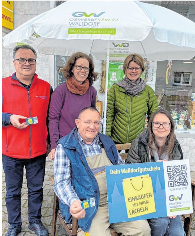
Walldorf-Gutscheine werden von der Stadt bezuschusst: Die Verkaufshütte wird sich während der drei Spargelmarkttag in der Hauptstraße vor dem Café Aro befinden.

1 A Trapezbleche auf Maß direkt vom Hersteller. 10% online Rabatt mit dem Code db3 + bundesweite Lieferung. Tel.: 07575 9278290 www.dachbleche24-shop.de