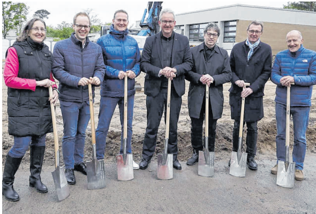
Herausforderung angenommen: Die Kinder der Wald- und Sambugaschule bekommen eine nagelneue Mensa, einen weiteren Grundschulpavillon und einen größeren Schulhof.