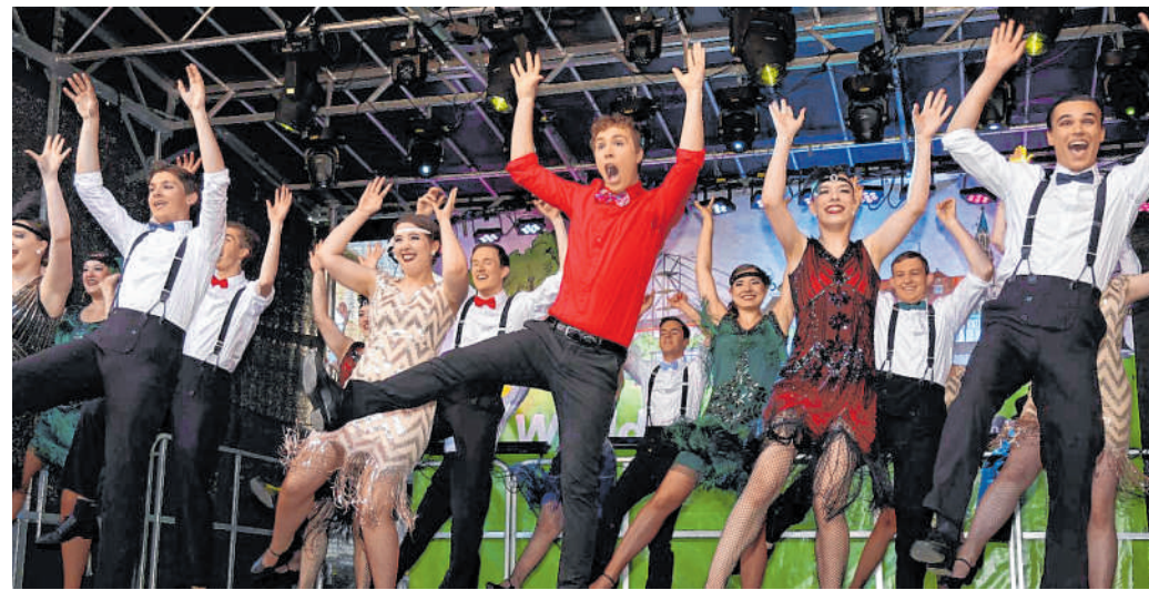
Große Ereignisse werfen Schatten voraus: Auch Tanzvorführungen werden den Gästen geboten.