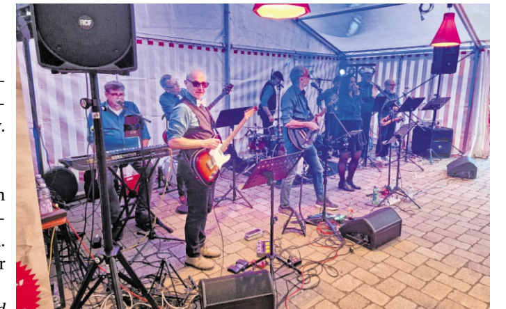
Beim Frühlingsfest des Musikvereins Rettigheim sorgen auch in diesem Jahr wieder Musikgruppen und Bands für die musikalische Unterhaltung.