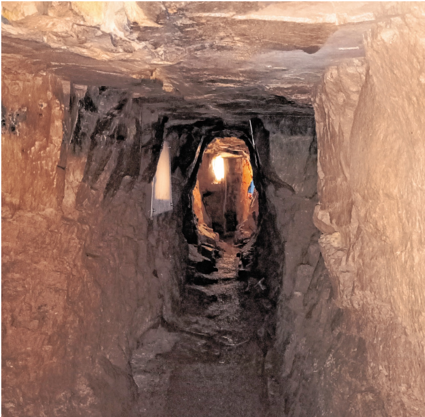
Der Brunnenstollen an der Burg Dilsberg ist nach dem Auszug der Fledermäuse aus dem Winterquartier wieder geöffnet. Der knapp 80 Meter lange unterirdische Gang kann selbstständig oder im Rahmen einer Führung erkundet werden.

Polizei 110 Feuerwehr/Rettungsdienst 112 Einheitliche Behördennummer 115 Ärztlicher Notfalldienst 116 117 Kinderärztlicher Notdienst Ortsvorwahl/192 92 Zahnärztlicher Notdienst 06221/ 354 4917 Augenärztlicher Notdienst 0180/ 606 2211 Giftnotruf Freiburg 0761/ 192 40 Kinder- und Jugendtelefon 0800/ 111 0333 Opfernotruf 01803/ 343 434 Telefonseelsorge 0800/ 111 0111 Malteser Hilfsdienst 06222/ 922 50 Technischer Notdienst Bauhof 0152/ 389 014 52 Stadtwerke Walldorf 06227/ 828 80