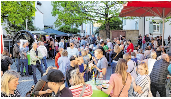
Das erste After-Work-Event in diesem Jahr erfreute sich eines guten Zuspruchs