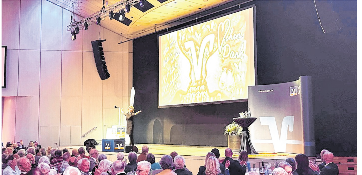
Am 28. April feierte die regionale Genossenschaftsbank, mit rund 450 Teilhabern aus der Region Wiesloch, bis zu 70 Jahre Mitgliedschaft bei der Volksbank Kraichgau.