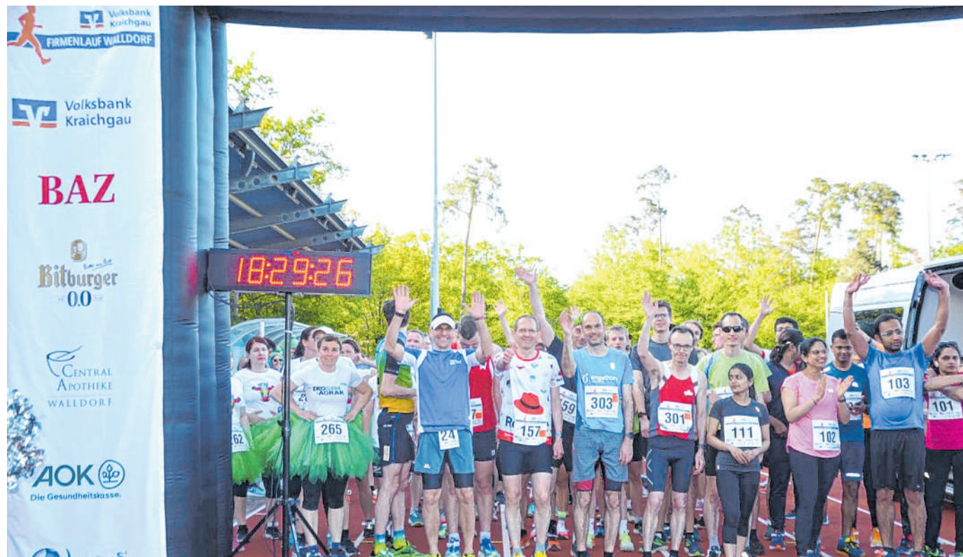
Vorfreude: Der Just-For-Fun-Lauf findet am Mittwoch, 15. Mai, um 18.30 Uhr statt.

Dort verteilt auch das Team der Central Apotheke wieder Erfrischungen von Ensinger an alle Teilnehmer. Schließlich führt die Strecke über die Heidelberger Straße und den Dannhecker Wald wieder zurück, wo die Hobbysportler wieder zum guten Schluss im Waldstadion über die Ziellinie laufen. Die Laufdistanz beträgt circa 5,1 Kilometer (diese ist allerdings nicht offiziell vermessen). ug