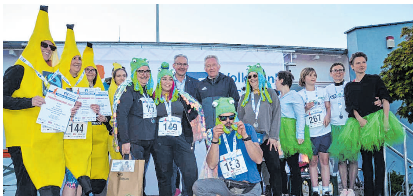
Tolle Preise winken: Besonders ausgefallene und attraktive Laufkostüme werden bei der Siegerehrung prämiert.

Die Strecke startet wie jedes Jahr im Waldstadion Walldorf. „Da in der Walldorfer Innenstadt keine Baustelle mehr sein wird, können wir auf unsere übliche Strecke zurück“, so Hamann. Diese führt die Läufer aus dem Stadion durch den Dannhecker Wald und über die Heidelberger Straße bis in die Walldorfer Innenstadt. Der Weg führt dann durch die Adler-, Friedrich- und Badstraße und dann um die Kirche St. Peter. Nach der Durchquerung der Fußgängerzone ist die Fankurve mit vielen Zuschauern in der Schwetzingen Straße auf Höhe der evangelischen Stadtkirche immer ein Highlight. Dort verteilt auch das Team der Central Apotheke wieder Erfrischungen von Ensinger Mineralbrunnen an die Läufer. Schließlich führt die Strecke über die Heidelberger Straße und den Dannhecker Wald wieder zurück ins Waldstadion. Nach dem letzten Läufer gegen 19.30 Uhr kann der Verkehr durch Walldorfs Straßen dann schon wieder ungehindert fließen. ug-ham