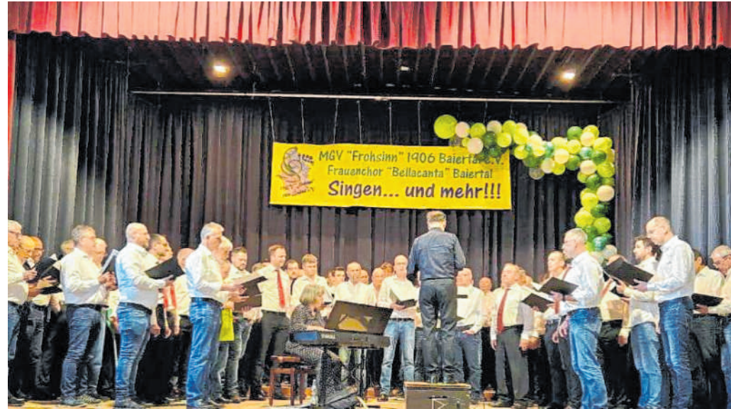
Neue Sänger willkommen: Die beiden Männerchöre gaben einige Stücke ihres umfangreichen Repertoires zum besten.

16 deutsche Schüler werden im Juni nach Rambervillers am Rande der Vogesen reisen. Ein wenig Sorgen macht ihren Lehrern, dass sie immer weniger Französischschüler haben. Erschwerend komme hinzu, dass sich viele im ersten Lernjahr noch nicht trauten, beim Austausch mitzumachen und dieser dann in der achten Klasse in Konkurrenz zum England-Austausch steht.