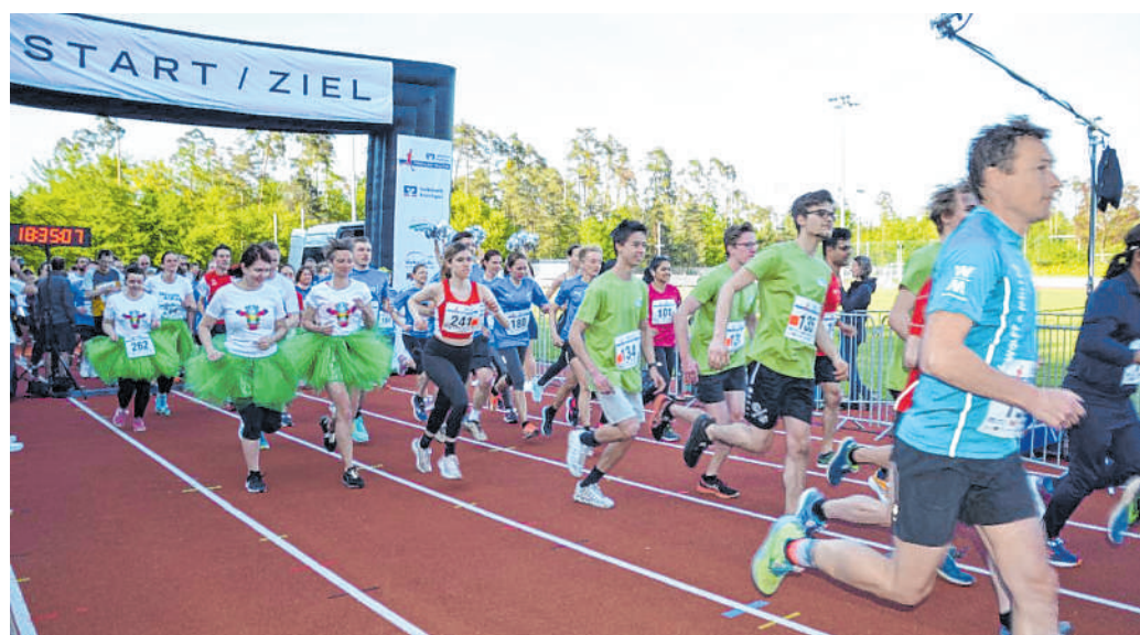
Start und Ziel im Waldstadion: Die hoch motivierten Läufer kurz nach dem Start