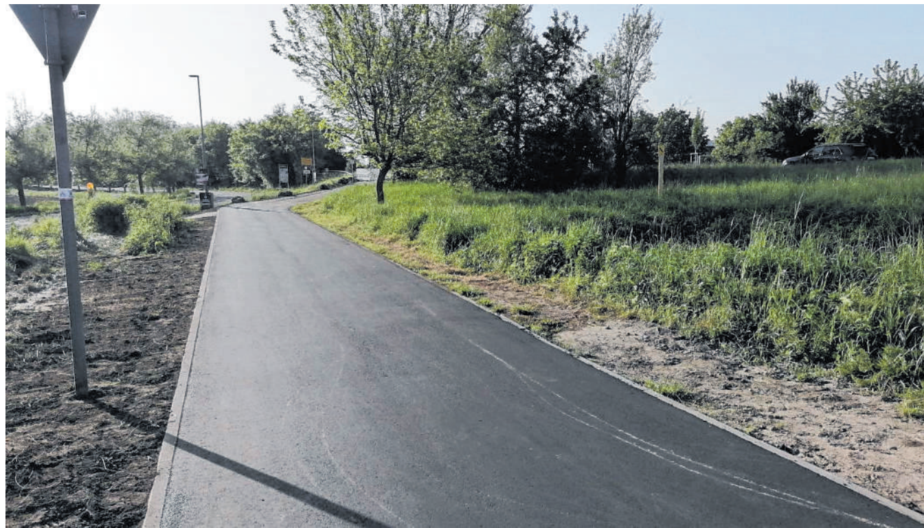
Pünktlich zum Frühjahrsbeginn: Durch einen neuen Fahrbelag wurden Rissen und Dellen beseitigt.