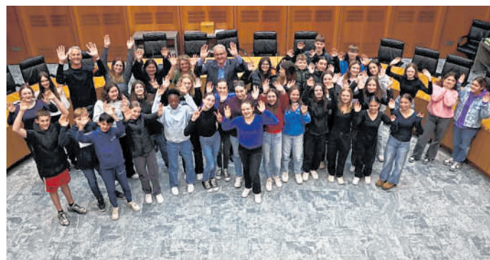
Schüleraustausch zwischen der Theodor-Heuss-Realschule und dem Collège in Rambervillers: Ein interessantes Programm steht den französischen Schülern während ihres Aufenthalts bevor.

„Sprechen Sie uns doch einfach an.“ Der Verein freut sich jederzeit über Verstärkung.