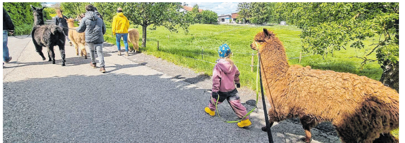
Nonies Hof: Eine Wanderung mit den Alpakas für die ganze Familie.

Ein Erlebnis der besonderen Art sind die Alpaka- und Lama-wanderungen. Hierbei kann der Besucher dem Stress des Alltags entfliehen und sich von der Ruhe und Gelassenheit dieser sanftmütigen und neugierigen Tiere anstecken lassen. Aber auch Weidebesuche, Fotoshoo-