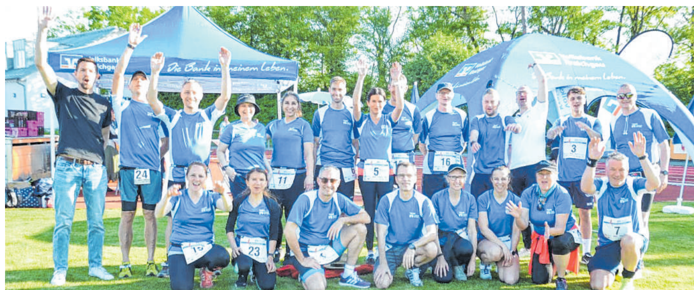
Gute Laune: Das Volksbank-Team ist jedes Jahr mit besonders vielen Teilnehmern mit dabei.