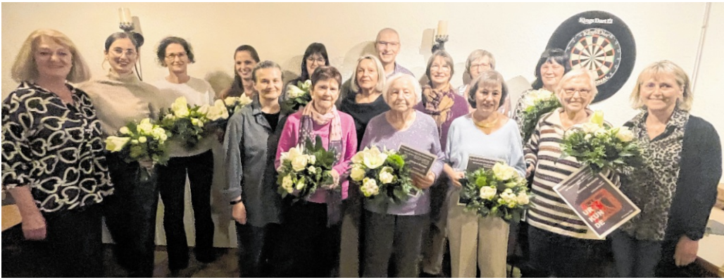
Bei der Generalversammlung des TV Horrenberg-Balzfeld standen langjährige Mitglieder im Rampenlicht: Sie wurden für ihre langjährige Treue ausgezeichnet. Darunter auch vier Frauen, denen für ihr außergewöhnliches Wirken die Ehrenmitgliedschaft verliehen wurde

Die Sportwartinnen und Übungsleiter gaben anschließend Einblicke in den aktuellen Sportbetrieb. In den Gymnastikgruppen werden Kraft, Koordination und Gedächtnis trainiert.