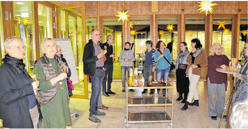
Bei der Wahlparty nach der Stimmauszählung im evangelischen Gemeindehaus war Gelegenheit, mit den Gewählten anzustoßen und ins Gespräch zu kommen.