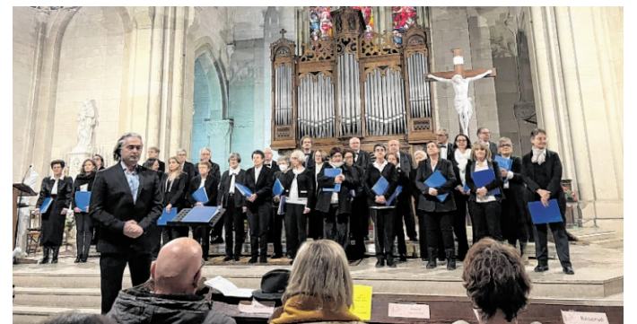
Der französische Chor „Le Choeur des Cordeliers“ freut sich über viele Besucher in der katholischen Kirche St. Peter.