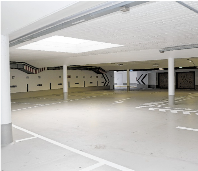
Die Tiefgarage „Hinter der evangelischen Kirche“ kann ab sofort wieder genutzt werden.