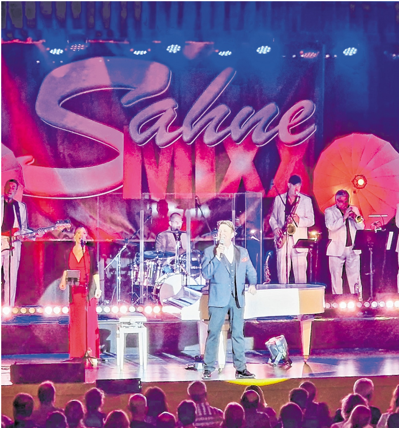
Am 17. Januar 2026 bringen „SahneMixx“ die großen Klassiker des Ausnahmekünstlers nach Eberbach in die Stadthalle.