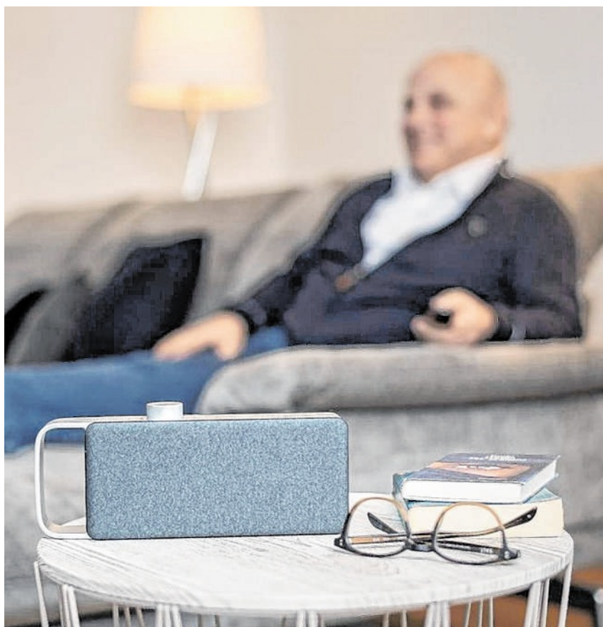
Ob auf dem Beistelltisch oder direkt neben einem platziert – OSKAR bringt immer den sprachoptimierten Fernsehton direkt zu einem an den Sitzplatz.

Für ungestörten Fernsehgenuss kann OSKAR mit Kopfhörern verwendet werden.