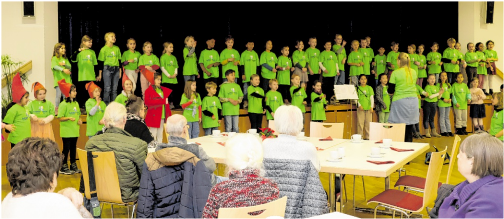
Der Auftritt des Schillerschulchors wurde mit viel Applaus belohnt.