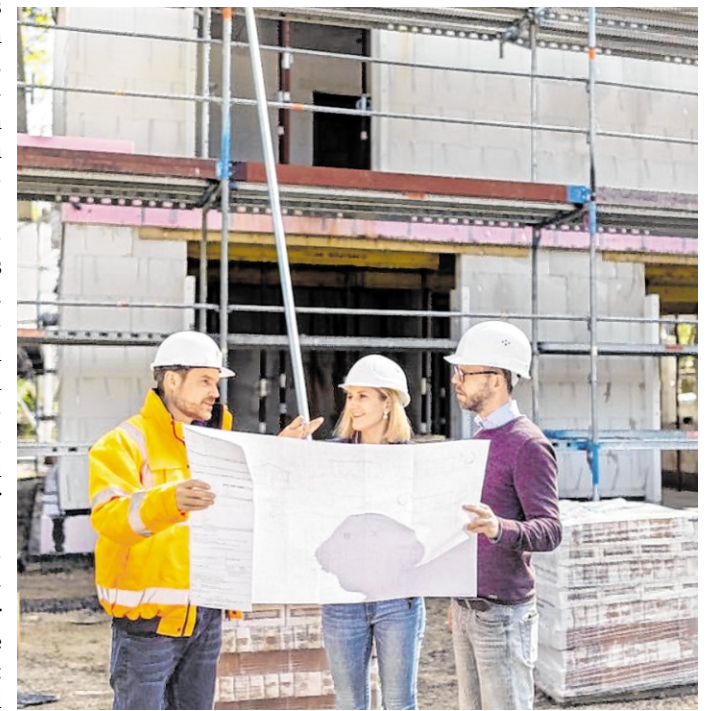
Unklare Baubeschreibungen und fehlende Abstimmung zählen zu den häufigen Ursachen späterer Baumängel.

Zu den häufigsten Problemen gehört eine unvollständige oder zu wenig detaillierte Planung. Wenn Grundrisse, Materialien oder technische Details nur allgemein beschrieben sind, können während der Bauphase Änderungen gewünscht entstehen, die fast immer zusätzliche Kosten verursachen. Auch fehlende Zeit- und Kostenpuffer können Bauherren unter Druck setzen. Unvorhergesehene Bodenverhältnisse, Lieferverzögerungen