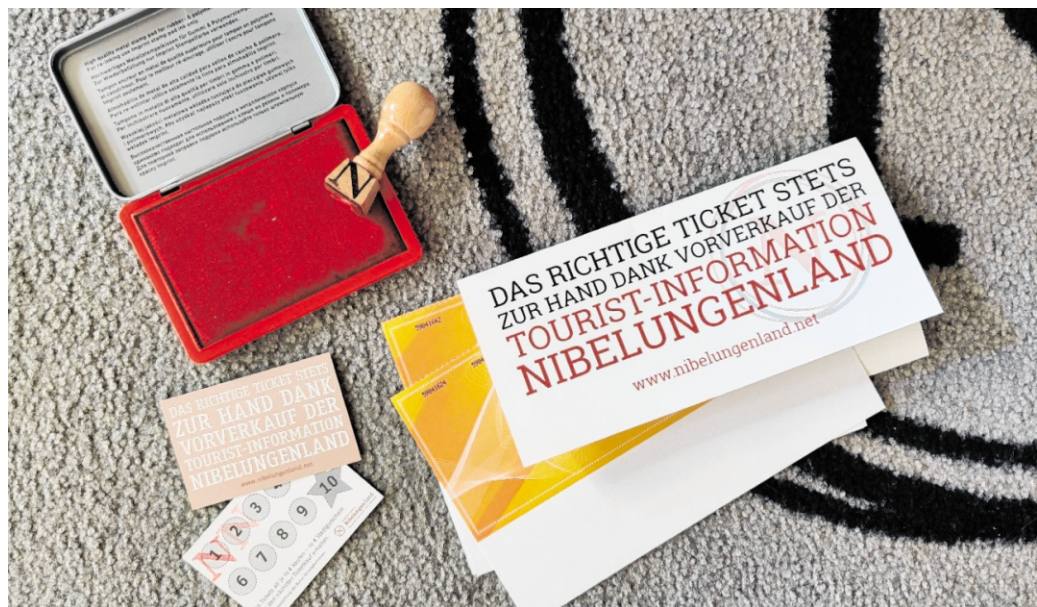
Mit der Einführung der Bonuskarte setzt die Tourist-Information einen weiteren Anreiz, Tickets direkt vor Ort zu erwerben. Zugleich stärkt sie den lokalen Servicegedanken.

Für jedes Veranstaltungsticket im Wert von mindestens zehn Euro wird ein Stempel auf der Bonuskarte vergeben. Beim Kauf mehrerer Tickets erhöht sich die Anzahl der Stempel entsprechend, pro Ticket wird ein Stempel vergeben. Davon profitieren insbesondere Kunden, die mehrere Veranstaltungen besuchen oder Tickets für verschiedene Events erwerben. Ist die Bonuskarte mit zehn Stempeln gefüllt, erhalten die