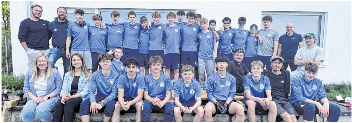
Die U15 des FC-Astoria Walldorf errichtete im Rahmen einer Berufsorientierungswerkstatt ein Sitzelement direkt am Spielfeldrand. Dabei sammelten die Jugendlichen über drei Tage praktische Einblicke in handwerkliche Berufe.

Die Berufsorientierungswerkstatt bietet den Jugendlichen nicht nur eine willkommene Abwechslung zum Trainingsalltag, sondern auch wertvolle Impulse für ihre berufliche Zukunft. Einige Teilnehmer entdeckten dabei bereits ihr Interesse und Talent für handwerkliche Tätigkeiten – ein erster Schritt auf dem Weg in die Arbeitswelt.