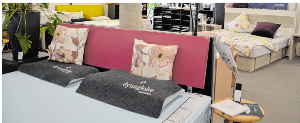
Impressionen von den hochwertigen Betten nebst Zubehör bei Gröner in Walldorf.

Ein Ort der Begegnung bleibt ebenfalls erhalten: Der angeschlossene Seminarraum am Standort bietet Platz für bis zu 80 Personen und kann auch künftig für private und geschäftliche Veranstaltungen angemietet werden. Ob Seminare, Feiern im privaten oder geschäftlichen Rahmen oder ein stilvolles Trauercafé – die Räumlichkeiten stehen weiterhin zur Verfügung.