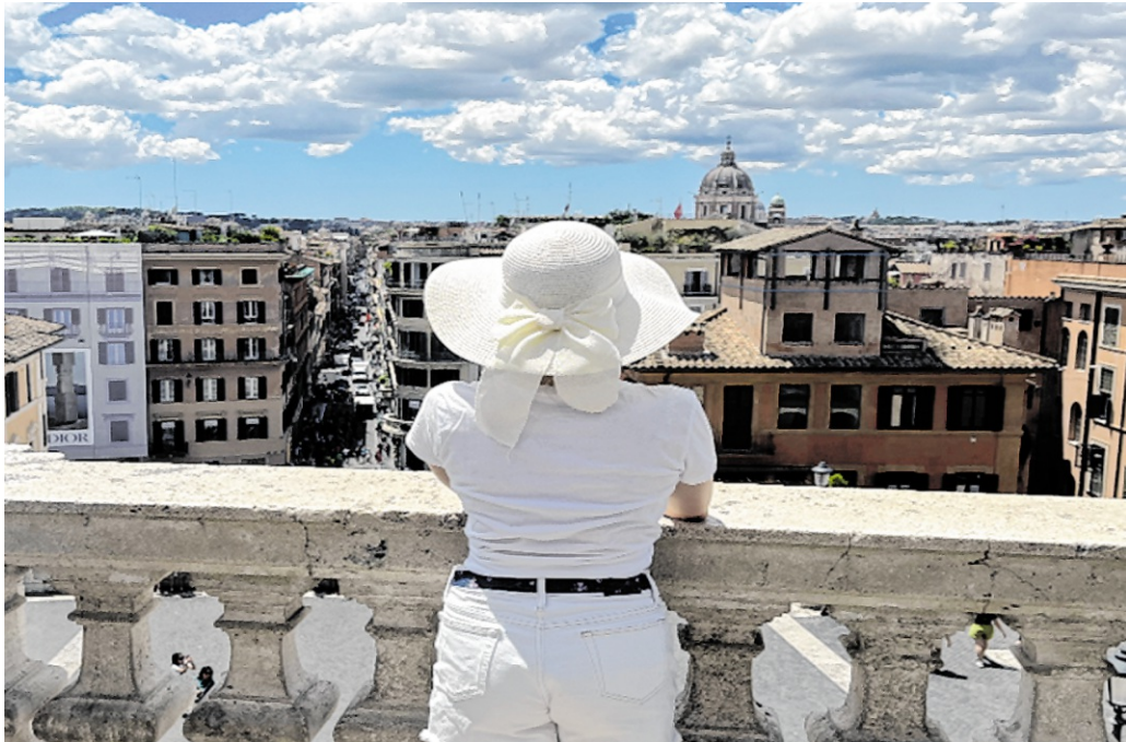
In 2025 haben die Gewinnssparer der Volksbank Kraichgau Gewinne in Höhe von mehr als 1,3 Millionen Euro gewonnen – darunter vier Rom-Reisen.

Gewinnssparen, so heißt die Sozial-Lotterie der Volks- und Raiffeisenbanken, die auch die Volksbank Kraichgau für ihre Mitglieder und Kunden anbietet. So ermöglicht sie es ihnen Geld zu sparen und dabei die Region zu unterstützen. Mit den Sparlosen sichern sich die Gewinnssparer jeden Monat die Chance auf verschiedene Gewinne und unterstützen mit ihrem Einsatz gleichzeitig soziale Projekte im Kraichgau. Ein Gewinnssparlos gibt es ab fünf Euro, davon werden vier Euro des Betrags angespart und ein Euro ist der Spieleinsatz – und damit die Chance auf einen von mehr als einer Millionen