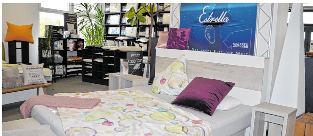
Zu den hochwertigen Betten wird auch die passende Bettwäsche, Matratzen und alles was zum Sortiment gehört, angeboten.

Zudem wird eine beliebte Tradition fortgeführt: Der jährliche Walldorfer Apfeltag auf dem Gelände im Kleinfeldweg 52 findet weiterhin statt. In diesem Jahr, am 5. September, dürfen sich Besucher wieder auf regionale Vielfalt und geselliges Miteinander freuen.