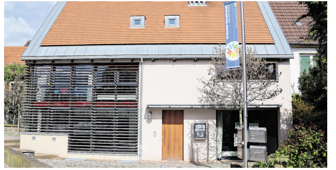
Im Dachgeschoss der „Scheune Hillesheim“ befindet sich die Walldorfer Künstlerwohnung.