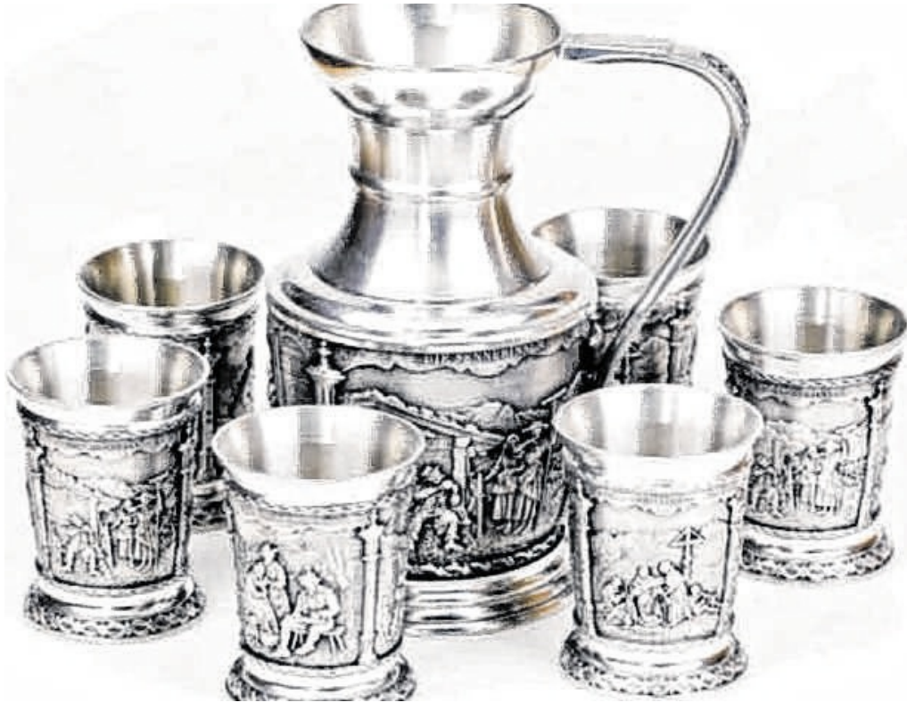
Zinnkrug und Zinnbecher