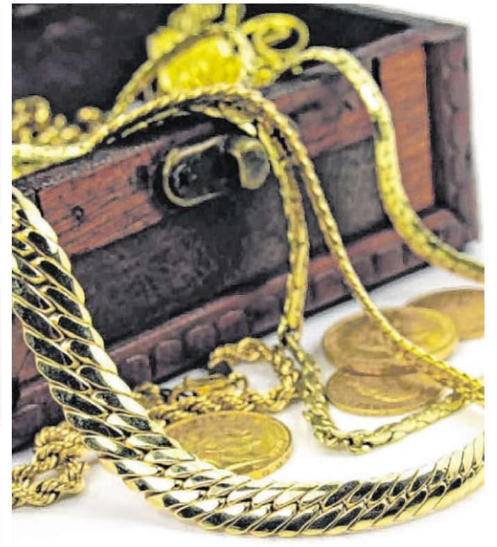
Goldschmuck und Goldmünzen