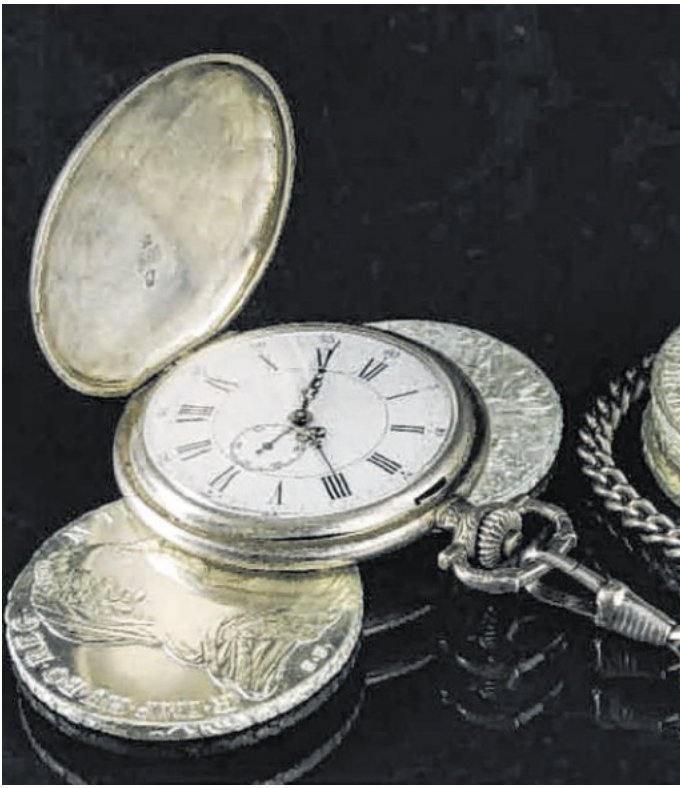
Taschenuhr und Silbermünzen