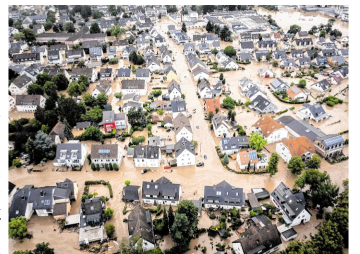
Wasser statt Straßen: Hochwasser führt die Liste der gefürchteten Naturgefahren an. Zwei Drittel der Menschen in Deutschland halten Schäden durch Überflutung oder Starkregen an ihrem Wohnort für möglich.

Einige Versicherer bieten bei neuen Verträgen bereits standardmäßig eine Elementardeckung an. Neben einer Pflichtversicherung wünschen sich viele Menschen mehr Prävention durch den Staat. Rund jeder Zweite hält mehr Investitionen in den Hochwasserschutz für sinnvoll sowie die Ausweitung von Überflutungsgebieten. Etwa ein Drittel spricht sich für mehr Geld im Katastrophenschutz aus. Auf Änderungen im Baurecht oder Klimaschutzmaßnahmen setzt jeweils rund ein Viertel der Befragten. Würden all diese Maßnahmen umgesetzt, könnte die Sicherheit von Gebäuden deutlich verbessert werden. djd